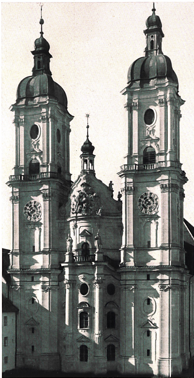
Cathédrale de St-Gall (Suisse)

Inlassablement, la machine à broder frappe ses coups saccadés. Dans un rythme réglé par une volonté invisible, les navettes tournent, les aiguilles dansent et brodent sur un tissu vaporeux de féeriques dessins.