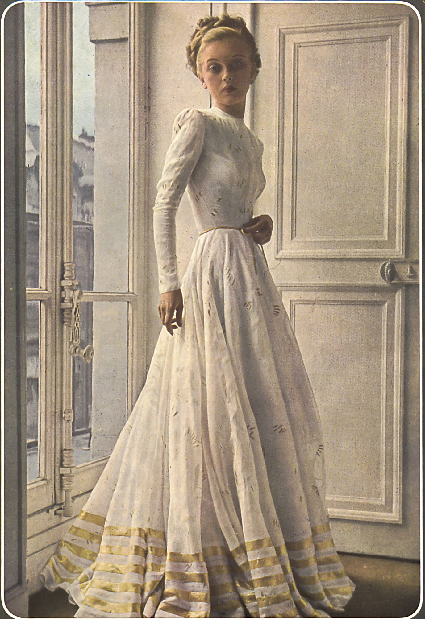
GRÈS Mettler et Cie S.A., St-Gall