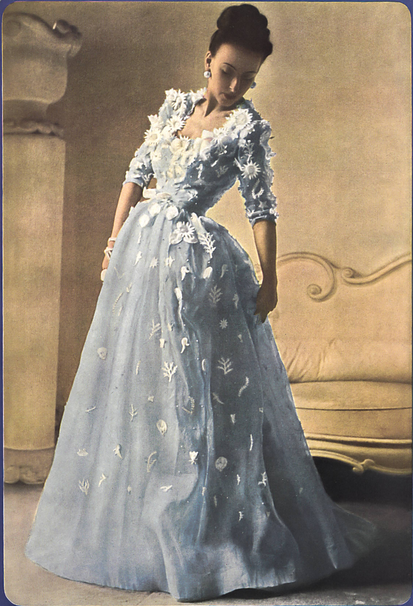
BALENCIAGA Aug. Giger & Cie. St-Gall