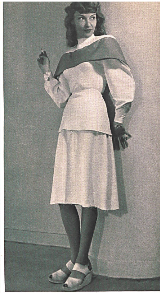
MAD CARPENTIER. Langenthal