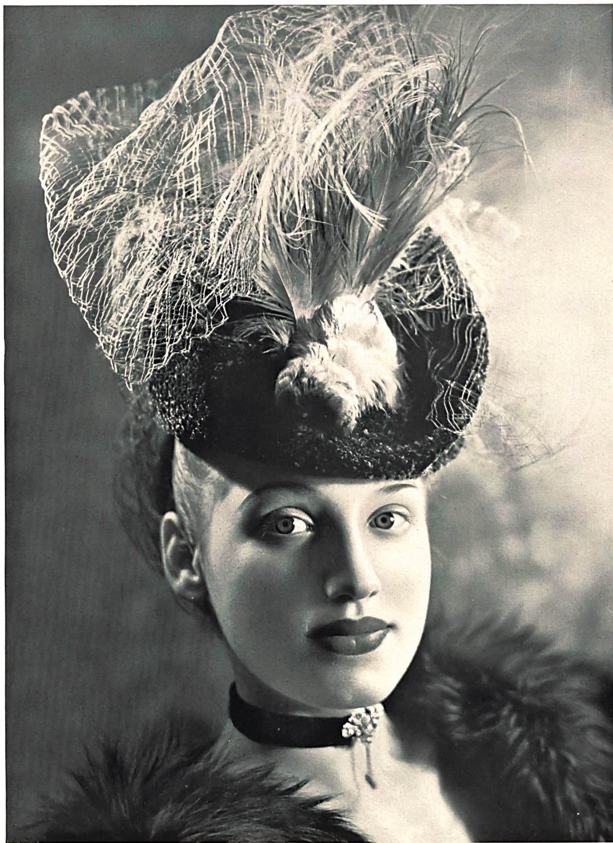
Jacques Isler & Cie S. A., Wohlen. Modèle Charles Muller S. A., Zurich.