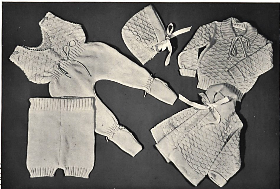
Hochuli & Cie, Safenwil. Ensembles pour bébés. S. T. Studio.