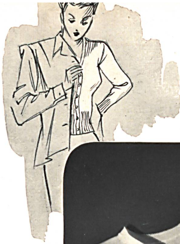
Ruegger & Cie, Zofingue. Boléro à manches longues pour dames.