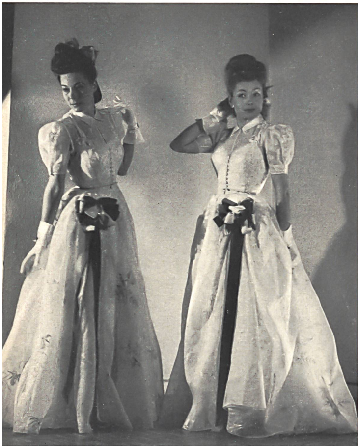
A. Næf & Cie, Flawil. Organdi brodé. Embroidered organdie. Organdi bordado. Vischer & Cie, Bâle. Ruban de velours. Velvet ribbon. Cinta de terciopelo. Modèle Léon Fischer.