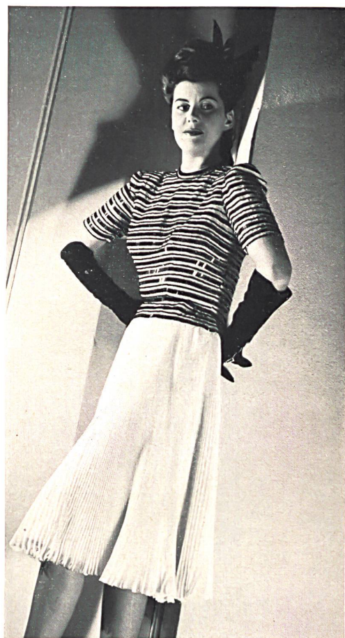
Weisbrod-Zürcher Söhne, Hausen a. A. Georgette chiffon pure soie. — Pure silk Georgette chiffon. — Georgette chiffon pura seda. E. Schubiger & Cie S. A., Uznach. Organza pure soie. — Pure silk Organza