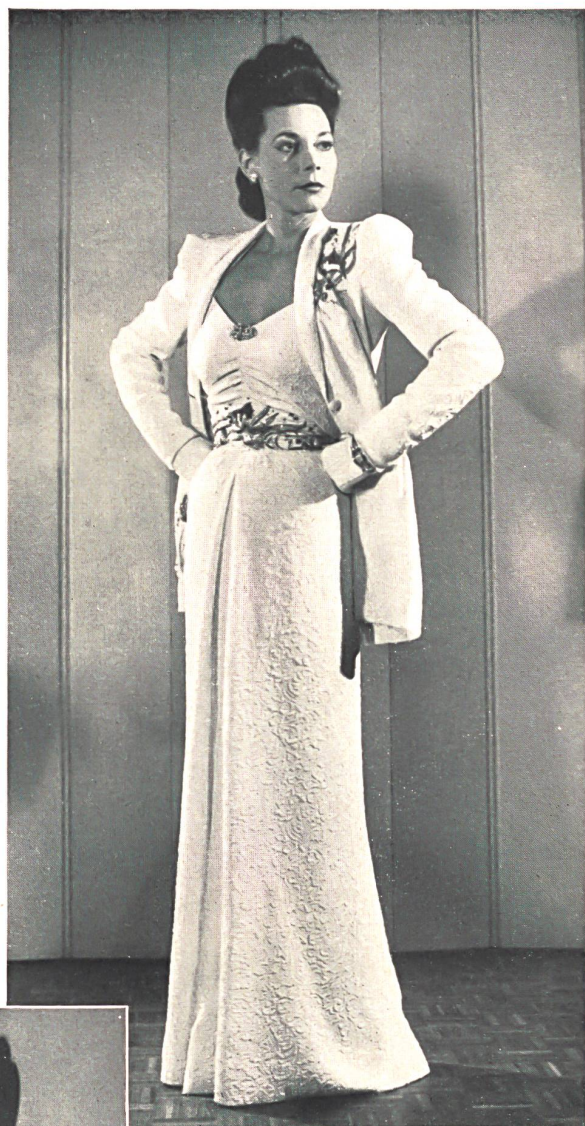
Mettler & Cie S. A., St-Gall.