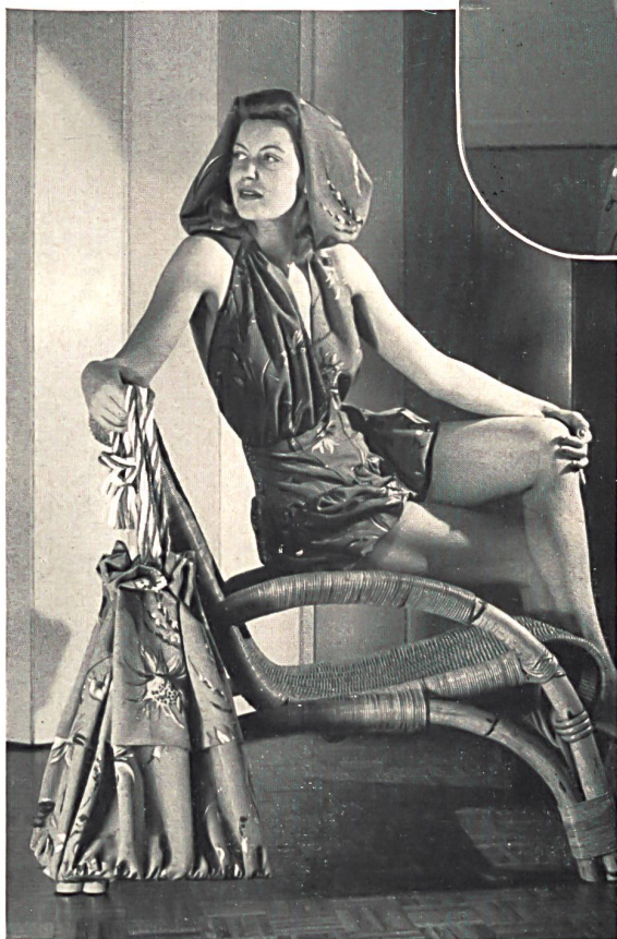
Rudolf Brauchbar & Cie, Zurich. Crêpe « Turango » en fibranne, imprimé. Crêpe « Turango », printed staple fibre. Crepe « Turango » de fibrana, estampado. Modèle R. Schickelmann.