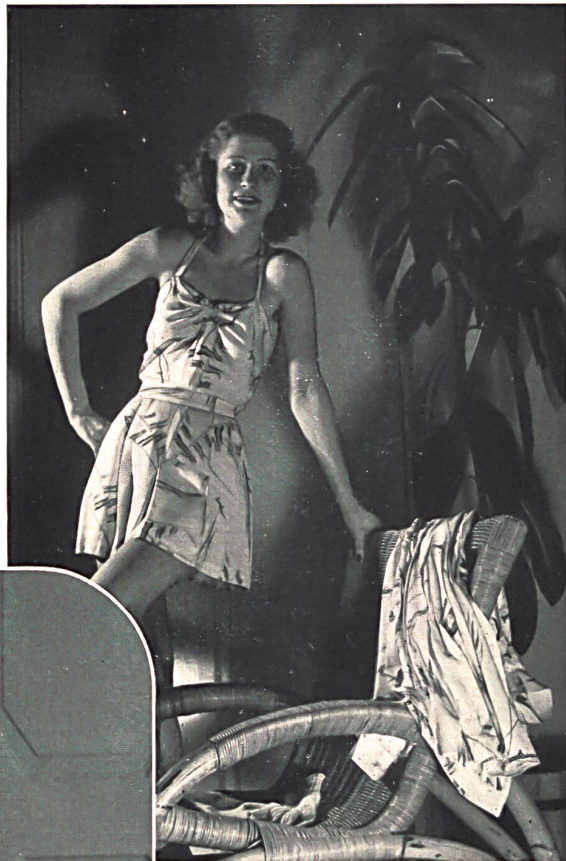
Emar, Tissage de soieries S. A., Zurich. Popeline imprimée en fibranne. Printed staple fibre poplin. Popelina estampada, de fibrana. Modèle Rey-Marchal.