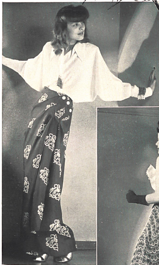
Tissages de soieries, ci-dev. Näf Frères S. A., Zurich.

Toile « Kiang-si » en fibranne, unie et imprimée.