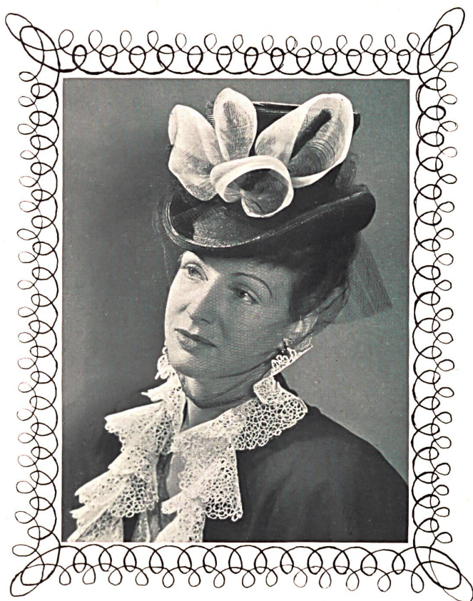
A. Næf & Cie, Flawil. Dentelles guipure. Guipure laces. Encajes guipur. Modèle I. et R. Polla.