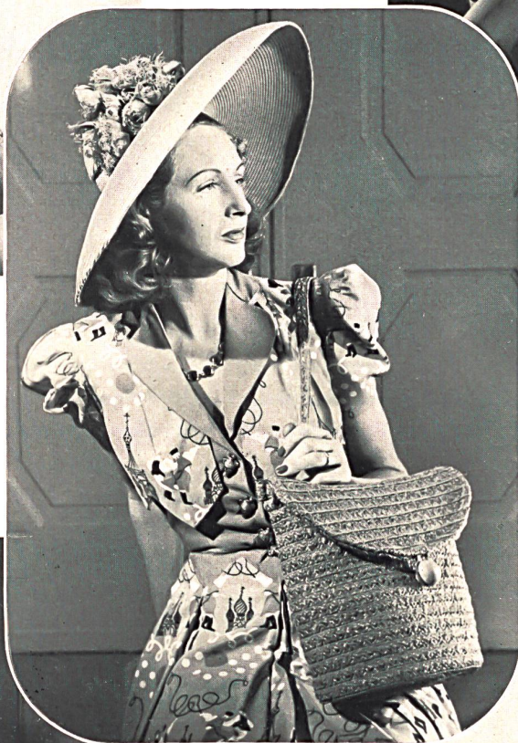
Stoffel & Cie, St-Gall. Fibranne imprimée « Cretesto ». « Cretesto » printed staple fibre. Fibrana estampada « Cretesto ». Otto Steinmann & Cie S. A., Wohlen. Tresses de paille. Strawbraids. Trenzas de paja. Modèles I. et R. Polla.