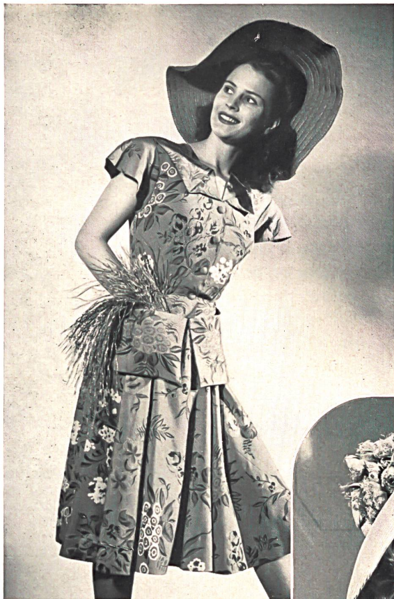
Rob. Schwarzenbach & Cie, Thalwil. Toile Douppion en fibranne, imprimée. Staple fibre douppion, printed. Tela Douppion de fibrana, estampada. Modèle Sauvage Couture.