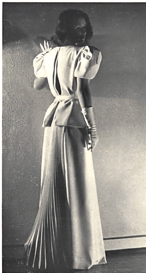
Stehli & Cie, Zurich. Crêpe « Marquita » pure soie. Crêpe « Marquita », pure silk. Crepe « Marquita » pura seda. Modèle Rose Mankel.