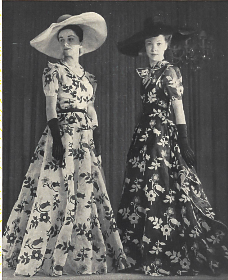
Bischoff & Muller S. A., St-Gall. « Fleurs crochétées », organdi brodé. « Crocheted Flowers », embroidered organdie. « Fleurs crochétées », organdi bordado. Modèle Andrée Wiegandt.