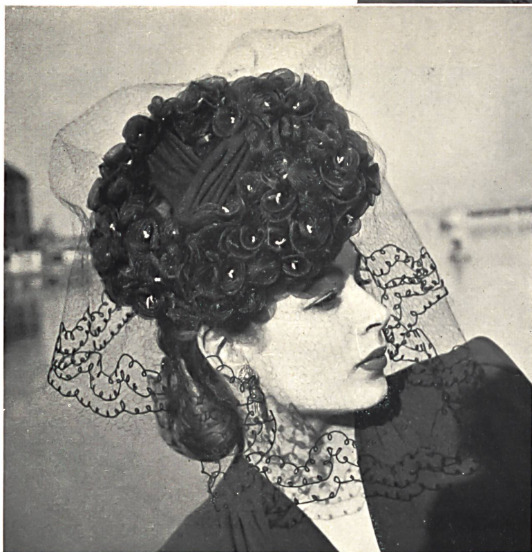
Reichenbach & Cie, St-Gall. Fibranne « Recofibra » imprimée. « Recofibra », printed staple fibre. Fibrana « Recofibra », estampado. Dreifuss Frères S. A., Wohlen. Tresses de paille. Strawbraids. Trenzas de paja. Modèles Sauvage Couture.