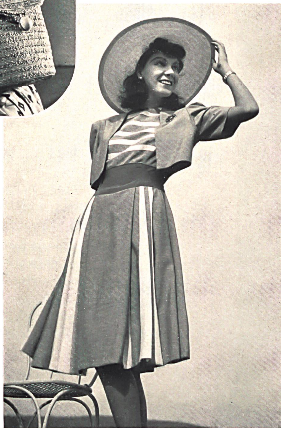
Stoffel & Cie, St-Gall. Fibranne « Primafil » tissée couleur. « Primafil » colour-woven staple fibre. Fibrana « Primafil », tejida en color. Modèle Gabo Javel.