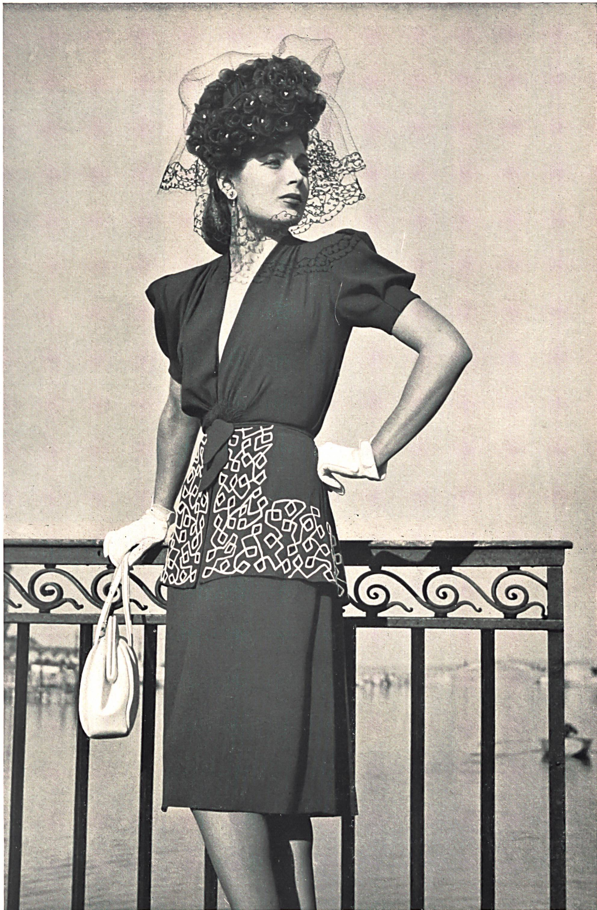
Tissages de soieries, ci-dev. Näf Frères S. A., Zurich. Crêpe « Evelyne » en rayonne. « Evelyne » rayon crêpe. Crepe « Evelyne » de rayón. Modèle Léon Fischer.