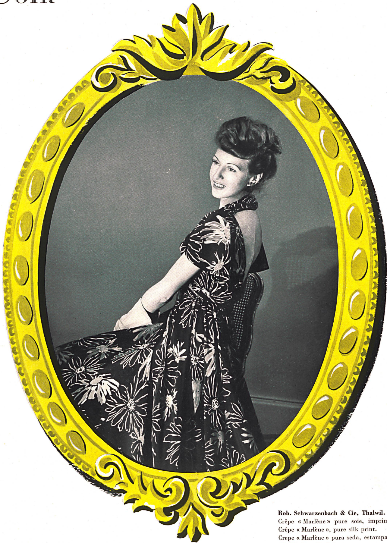
Rob. Schwarzenbach & Cie, Thalwil. Crêpe « Marlène » pure soie, imprimé. Crêpe « Marlène », pure silk print. Crepe « Marlène » pura seda, estampado. Modèle I. et R. Polla.