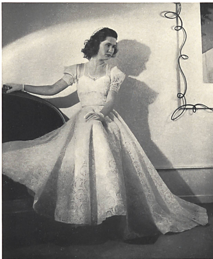
Reichenbach & Cie, St-Gall. Organdi brodé. Embroidered organdie. Organdi bordado. Modèle Rey-Marchal.