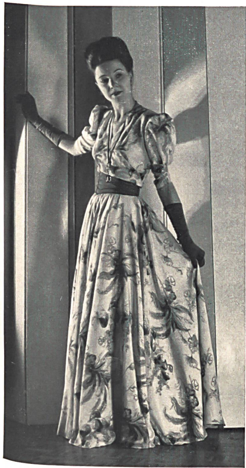
Fabrique de soieries, ci-dev. Edwin Næf S. A., Zurich. « Nymphe » pure soie imprimée. « Nymph », pure silk print. « Nymphe », pura seda estampada