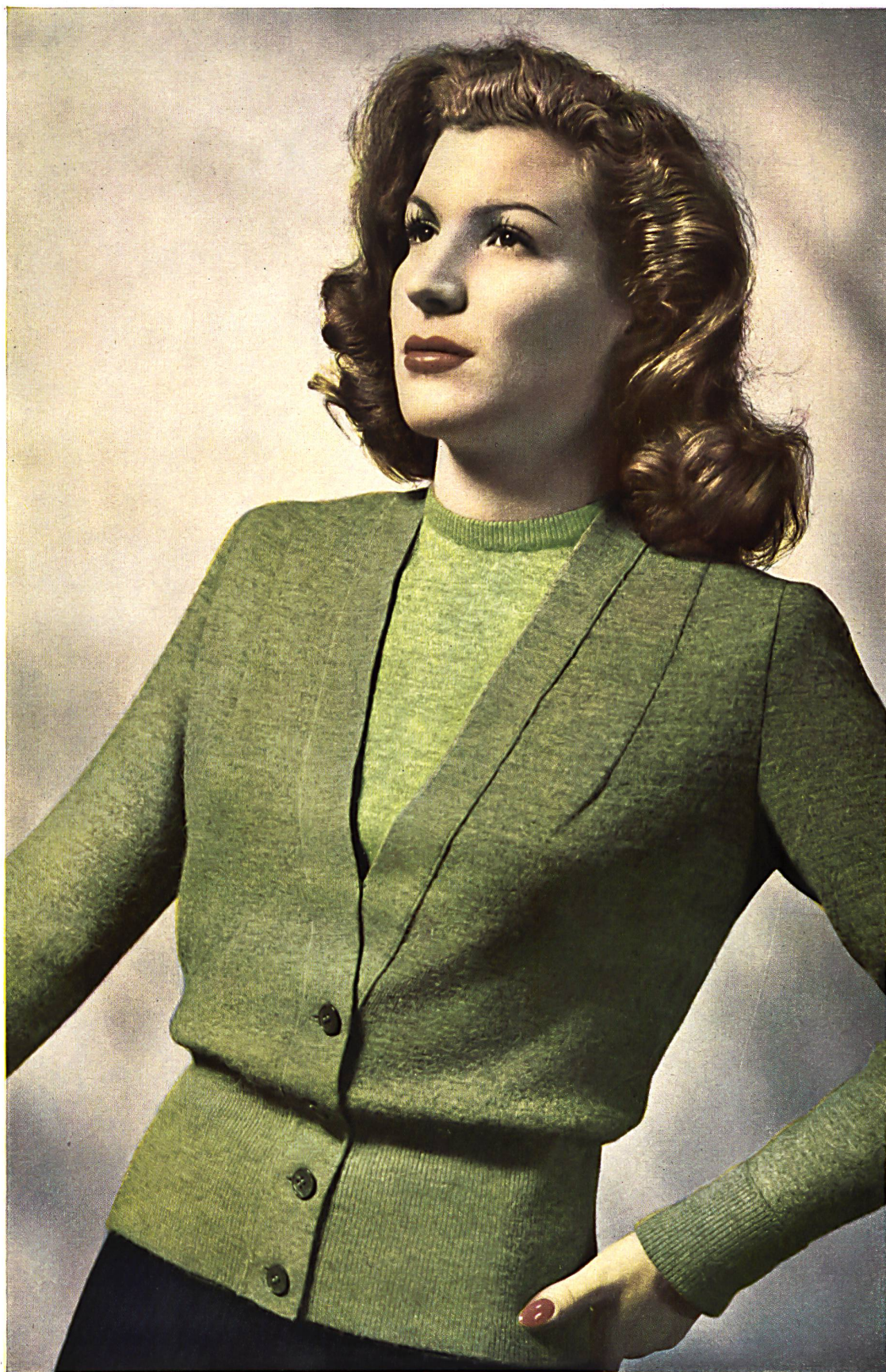
Ruepp & Cie S. A., Sarmenstorf. Ensemble américain « ALPINIT » « ALPINIT » Twin Sweater.