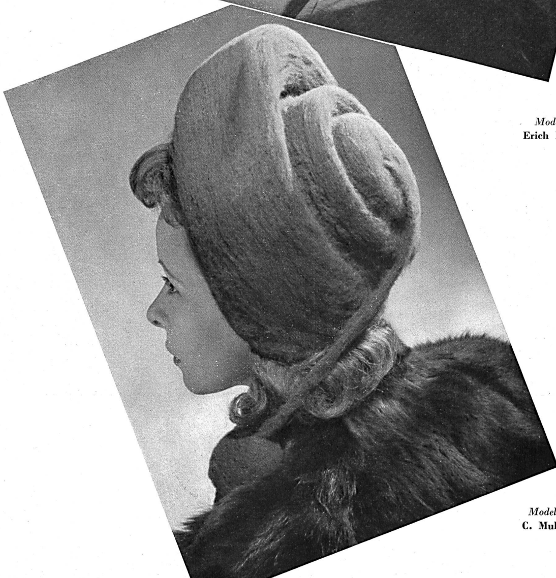
Modell Modèle C. Muller S.A., Zurich.