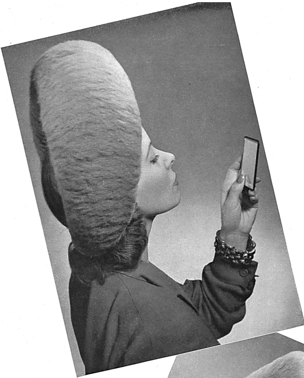
Modell Modèle Bema.

zeigen vier Modellhüte aus « FIBRANGOR ». Das neue Material, bereits für die Wintersaison 1944/45 vorbereitet, eignet sich vorzüglich für Atelierhüte, hat einen sehr schönen Griff und seidenweichen Glanz.