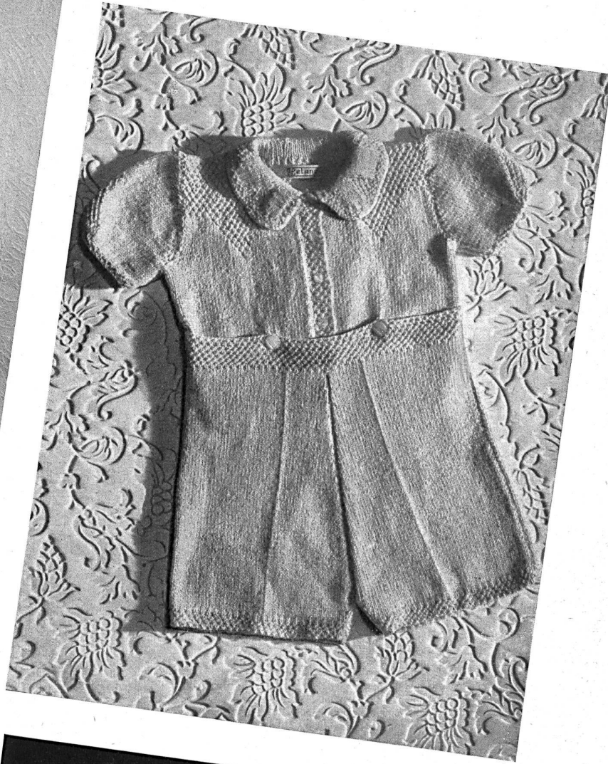
Geiser A.-G., Huttwil. Gestrickte Kinderkleider aus «HELANCA»-Garn, neuer Ersatz für Wolle. Vêtements pour enfants, tricotés en fil «HELANCA», matière nouvelle remplaçant la laine.