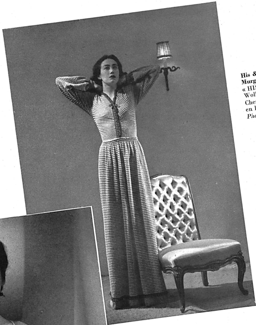
His & Co. A.-G., Murgenthal. « HISCO » Nachthemd aus Wollmischung. Chemise de nuit « HISCO » en laine mixte.