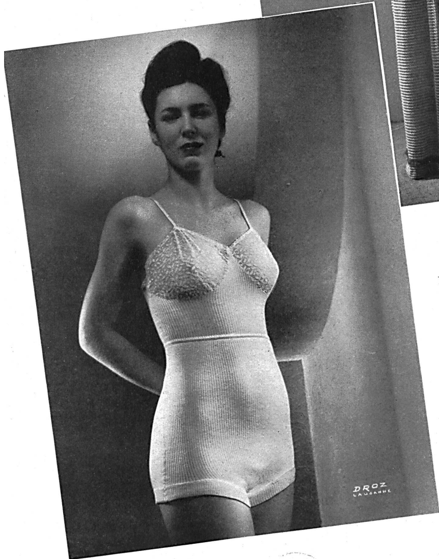
Ruegger & Co., Zofingen. Gestrickte Unterkleider, Bettjacken. Sous-vêtements tricotés, Liseuses.