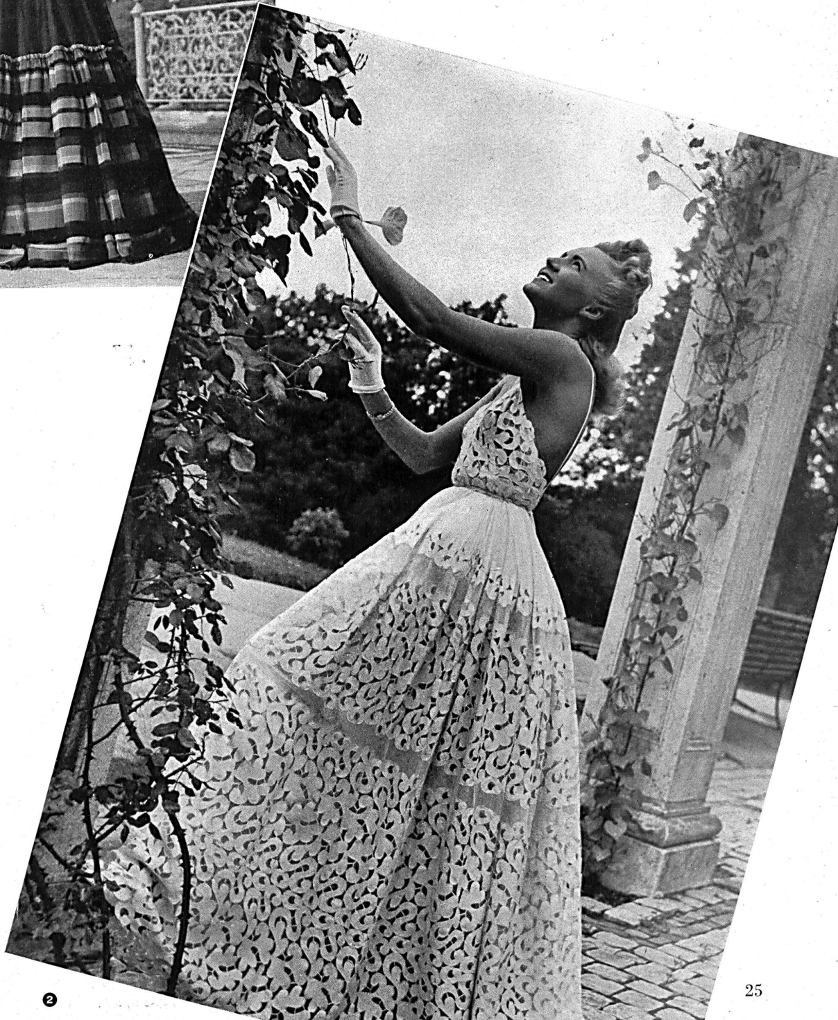
2 Modell Modèle Léon Fischer Satin cuir : Heer & Co. A.-G., Thalwil. Applizierte Stickerei : Applications de broderies : Walter Schrank & Co., St. Gallen. Weisser Kunstseidentüll : Tulle blanc en rayonne : Schweizerische Gesellschaft für Tüllindustrie A. - G., Müchwilen.