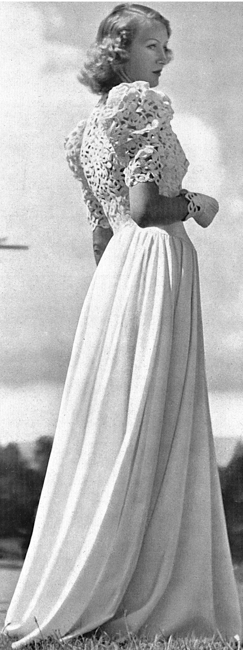
Modell Lehmann Modèle Kleid aus Kunstseide/Zellwolle « Cordula »: Bolero aus Phantasie-Galon: Robe en « Cordula », rayonne et fibranne: Boléro en galon haute fantaisie: Heer & Co. A.-G. Thalwil. C. Forster-Willi & Co., St. Gallen.