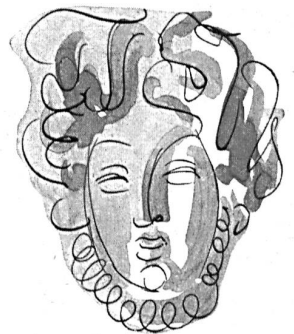
Modell Modèle Sauvage Couture

« Crêpe faille » rot aus Kunstseide mit Zellwolle :