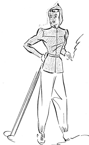
Modèles de E. Kneubuhler, Fabrique de vêtements, Zofingue