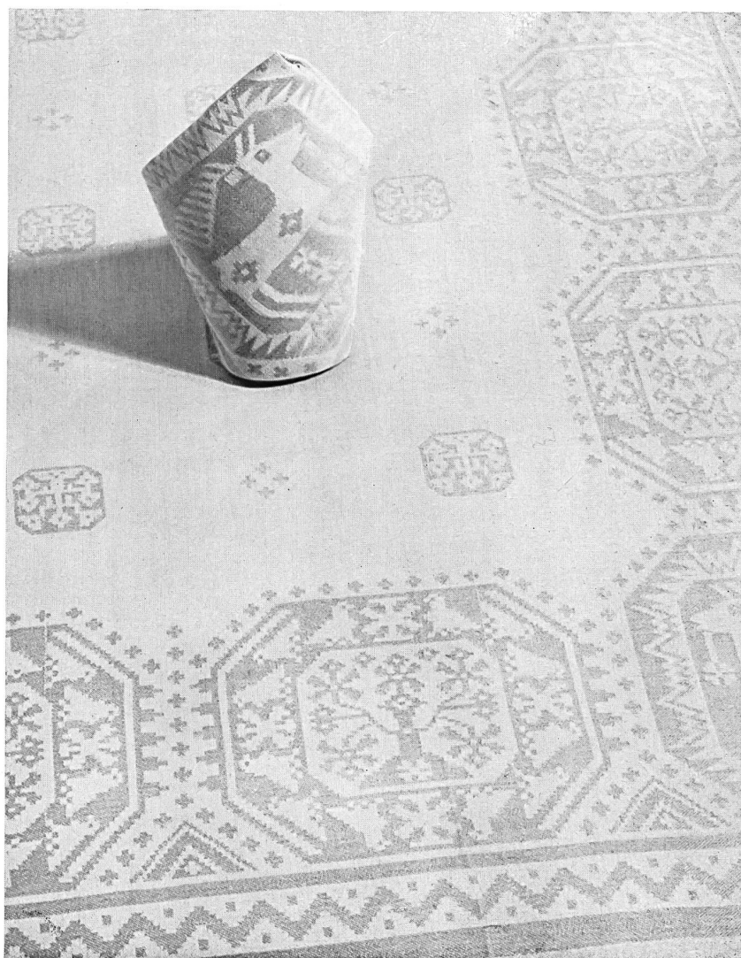
Nappages genre « Finnois » du Tissage de Toiles de Langenthal S. A., Langenthal.