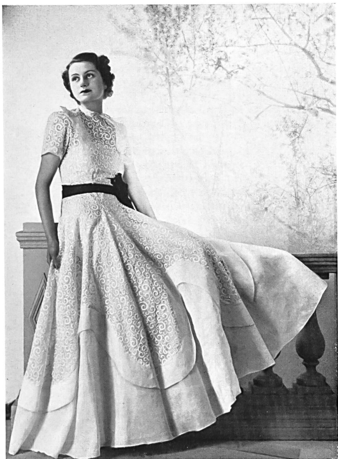
Modèle Agnès Drecoll. Photo Rigassi.

Chez Heim « Jeunes filles », on remarque une toilette qui est séduisante au possible ; elle est en linon brodé de fines lignes ondulées formant jours. L'aspect en est jeune et élégant. Cette robe d'une seule pièce est ajustée à la taille par une