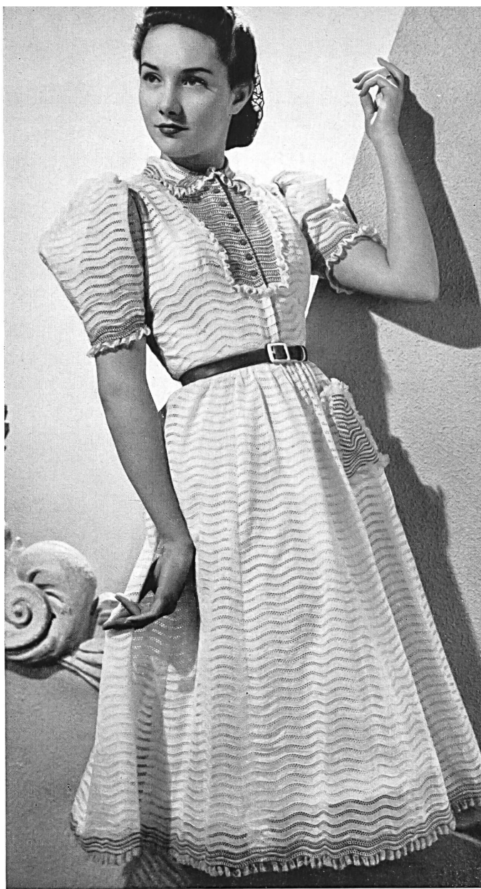
Robe d'après-midi en linon brodé de St-Gall. Modèle Heim « Jeunes filles ». Tissus Union S. A., St-Gall - Photo Dorvyne.

étroite ceinture de cuir rouge. La jupe est ample et courte formant des godets ; le corsage, froncé dans le haut et à la taille, est montant et terminé à l'encolure par un petit col rabattu souligné de points rouges brodés et d'un petit volant froncé de Valenciennes. Cette même garniture se retrouve tout autour et au bas de la jupe et sur la petite poche posée sur le côté gauche de la jupe. Cette simple et délicate garniture complète un ensemble très réussi.