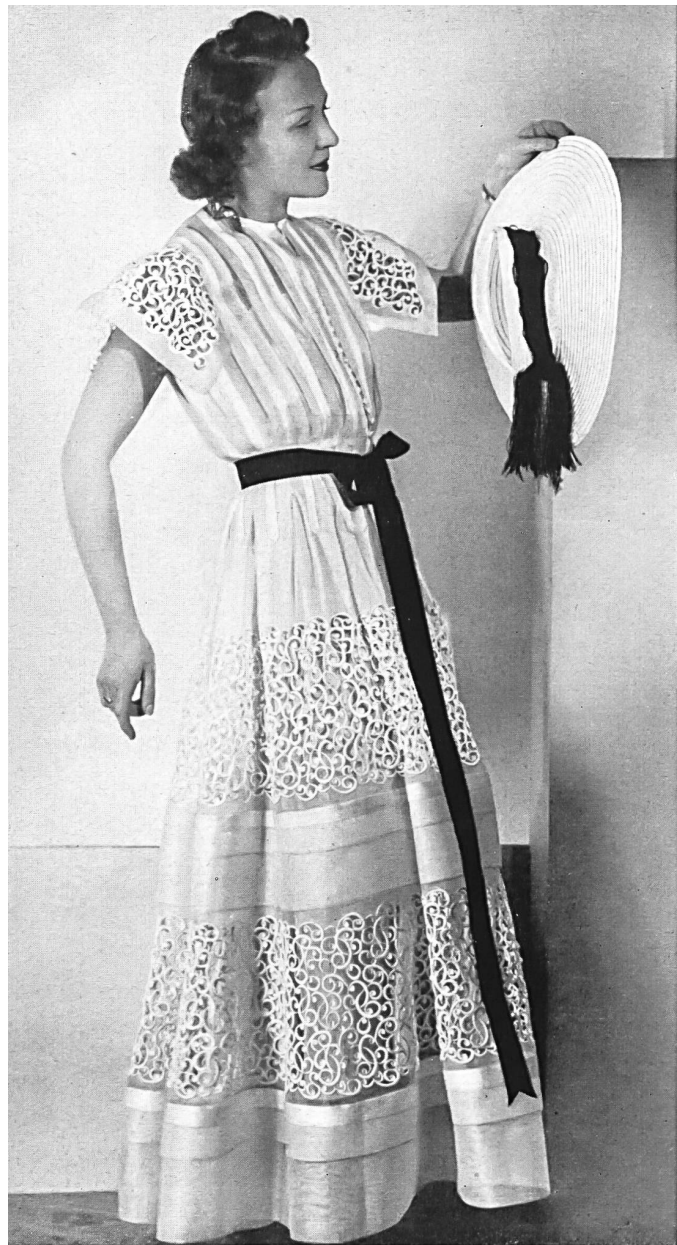
Modèle Bruyère.

Il ne faudrait pas croire que les couturiers sont tombés dans le style « guerre » ou « uniforme », non, car dans le costume tailleur, revenu en vogue, il y a toujours une note de féminité obtenue par les détails d'une blouse de linon brodé ou d'un col et de manchettes de fine broderie. Il faut signaler cette alliance heureuse de la fabrication savante et artistique des industries de St-Gall, qui ont créé des merveilles de linon, organdi brodé, venise, tulle brodé, broderies anglaises et du goût parisien qui sait si bien l'adapter aux modèles printaniers et en tirer le maximum de charme et d'élégance pour la parure féminine.