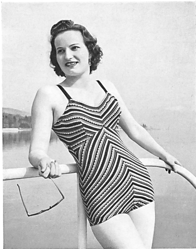
Costume de bain de la maison S.A. ci-dev. W. Achtnich & Co, Winterthour

Sous-vêtements de tous genres, en soie, en laine, en laine et soie et en fil, alliant souplesse et légèreté à une solidité à toute épreuve continuent de rallier tous les suffrages.