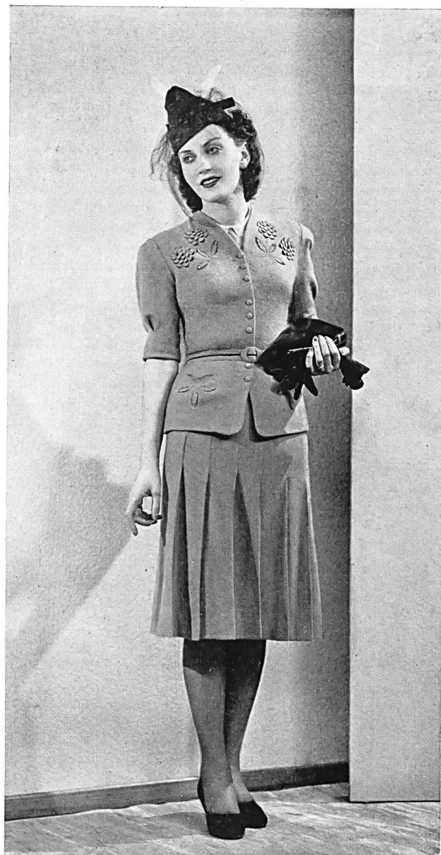
Deux-pièces de la maison Yvel Jersey Manufacture, Zurich

ensembles de bébés, les jumpers et les blouses sportives pour dames.