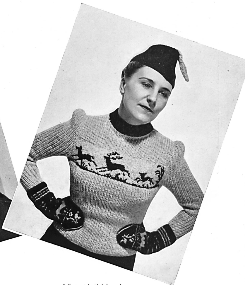
Pullover tricoté à la main de la maison J. Holtz, Lucerne.