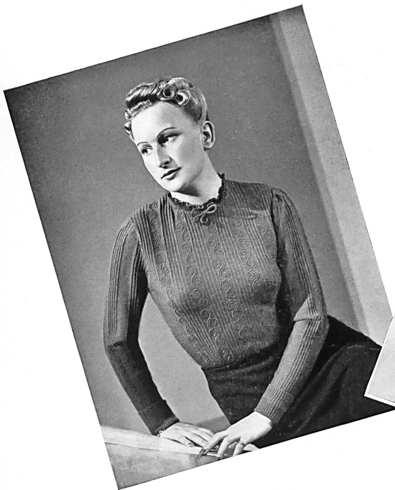
Pullover de la maison J. F. Rohrer-Bolliger, Romanshorn.