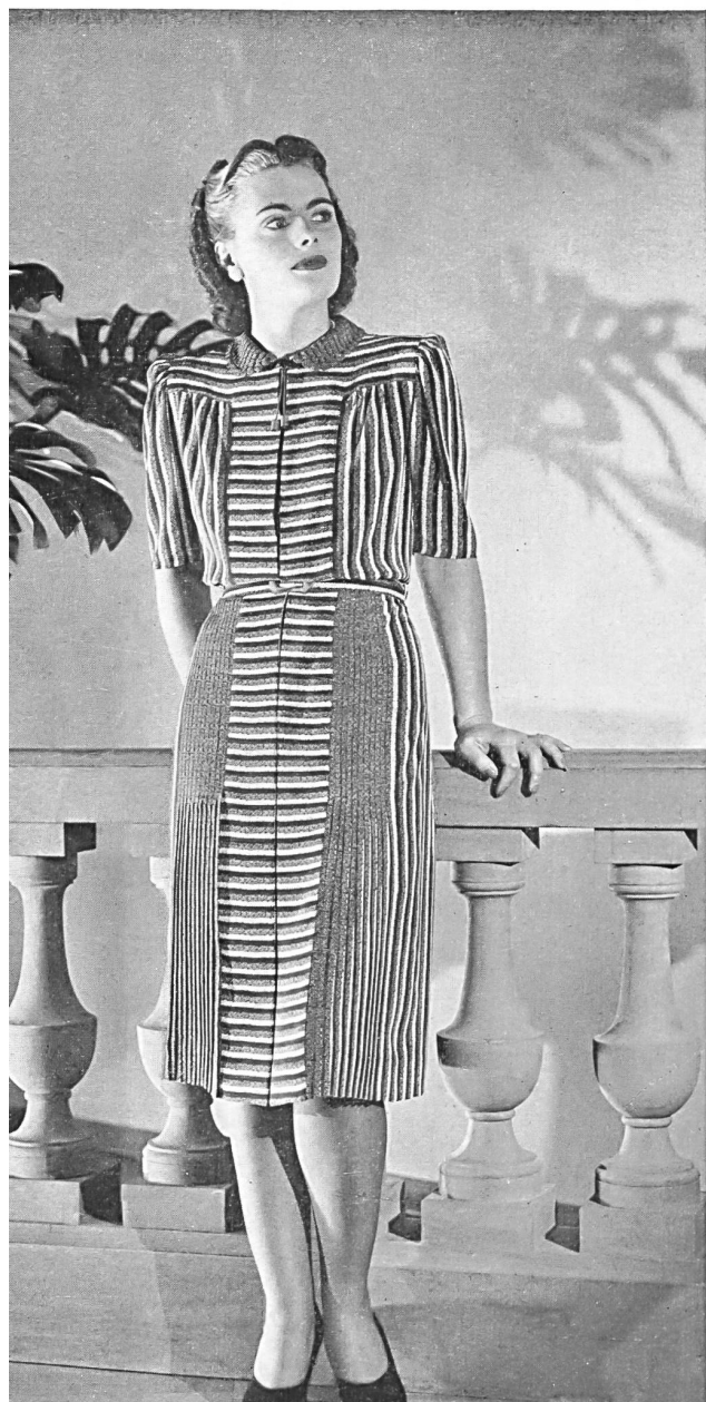
Robe de soie de C. Baumann, Zurich.

La tâche infiniment délicate de choisir avec goût et d'appliquer pratiquement les tendances diverses inspirées par les grands maîtres de la Haute Couture incombe à quelques ateliers spécialisés de la confection zuricoise.