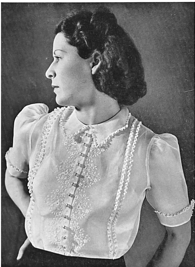
Blouse d'organdi brodé de Haury & Cie, St-Gall.

qui auront tous les suffrages. Cependant les robes de soie noire resteront toujours appréciées pour leur distinction et leur style parfaits.