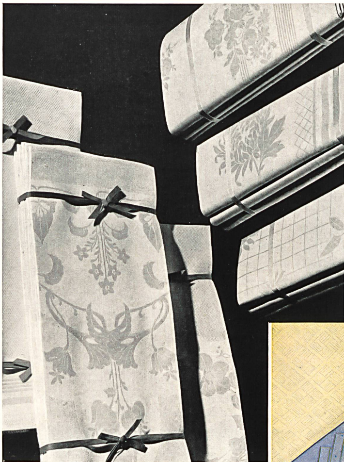
Nappages de la maison Worb & Scheitlin S.A., Berthoud.