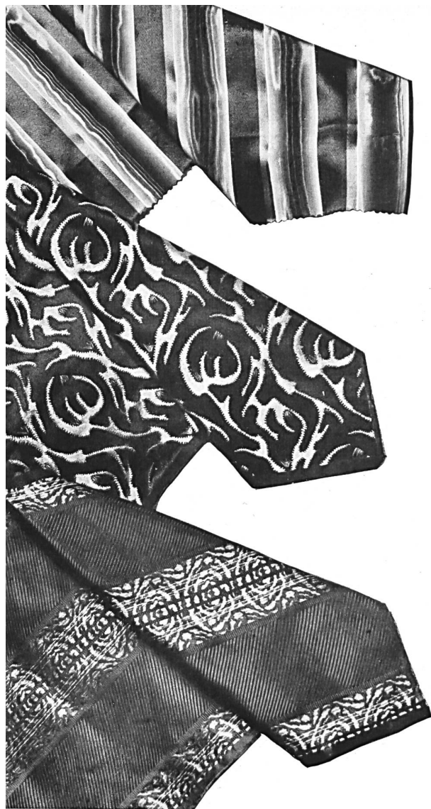
Tissus pour cravates de la maison Siber & Wehrli S.A., Zurich.