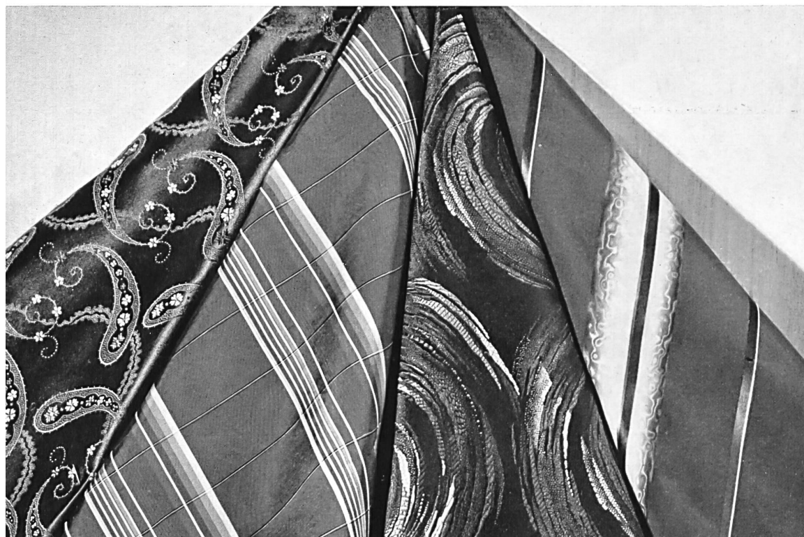
Tissus pour cravates fournis par l'Association des fabricants suisses de tissus de soie, Zurich.

Les industriels suisses de la soie, s'inspirant des maîtres de la couture renouvellent inlassablement leurs créations et s'adaptent merveilleusement aux exigences si changeantes et si autoritaires de la mode. Malgré la concurrence des grands pays la Suisse, dans ce domaine, s'impose, grâce à la perfection de ses articles et de leur valeur commerciale.