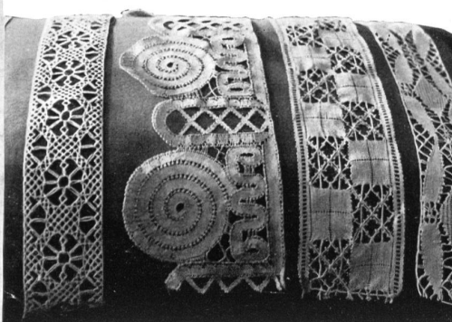
Coussin avec dentelle aux fuseaux et entre-deux.