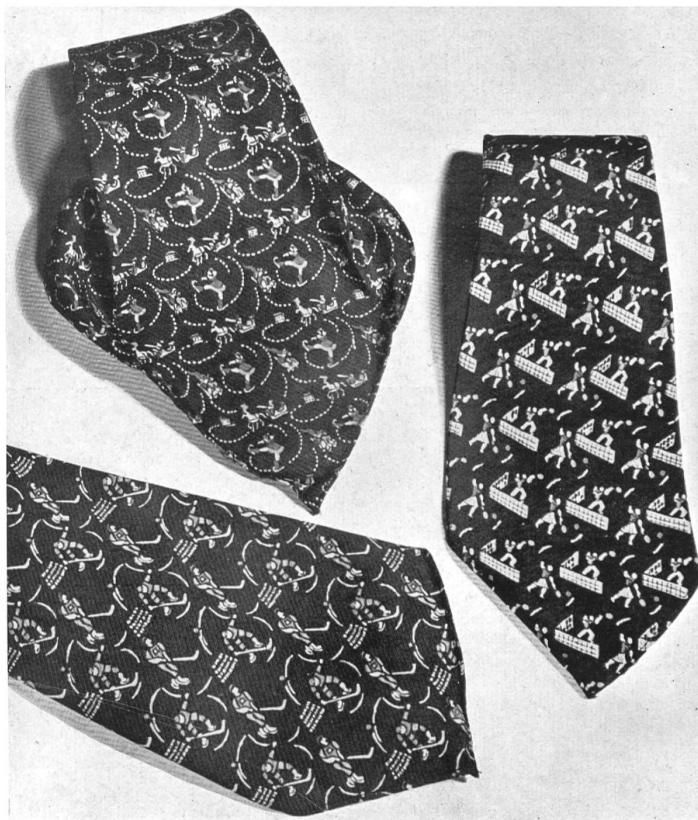
Cravates de soie avec motifs sportifs. Création de E. Vonwiller, Zurich.