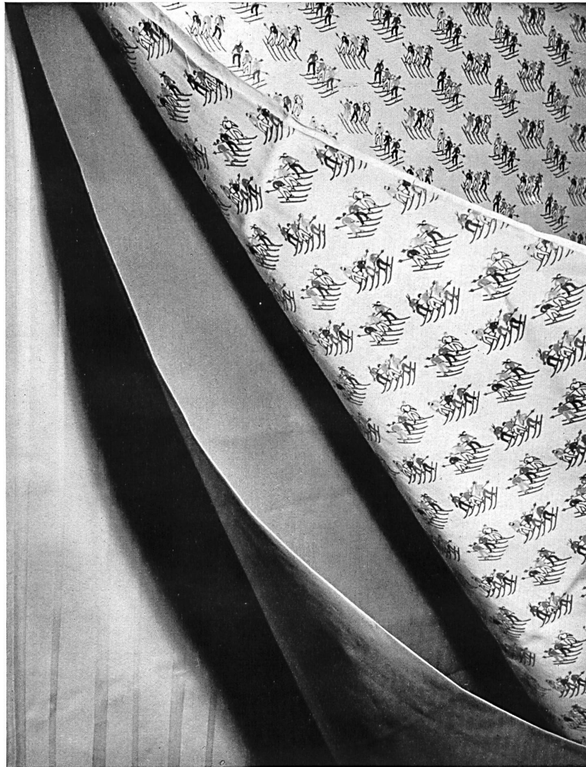
Popelines imprimées et imprégnées de Winzeler, Ott & Cie S. A., Weinfelden.

Pour la confection des blouses de ski, par exemple, les popelines tendent à remplacer complètement les étoffes de laine plus lourdes. Ce sont des tissus serrés et lisses offrant un maximum d'imper-