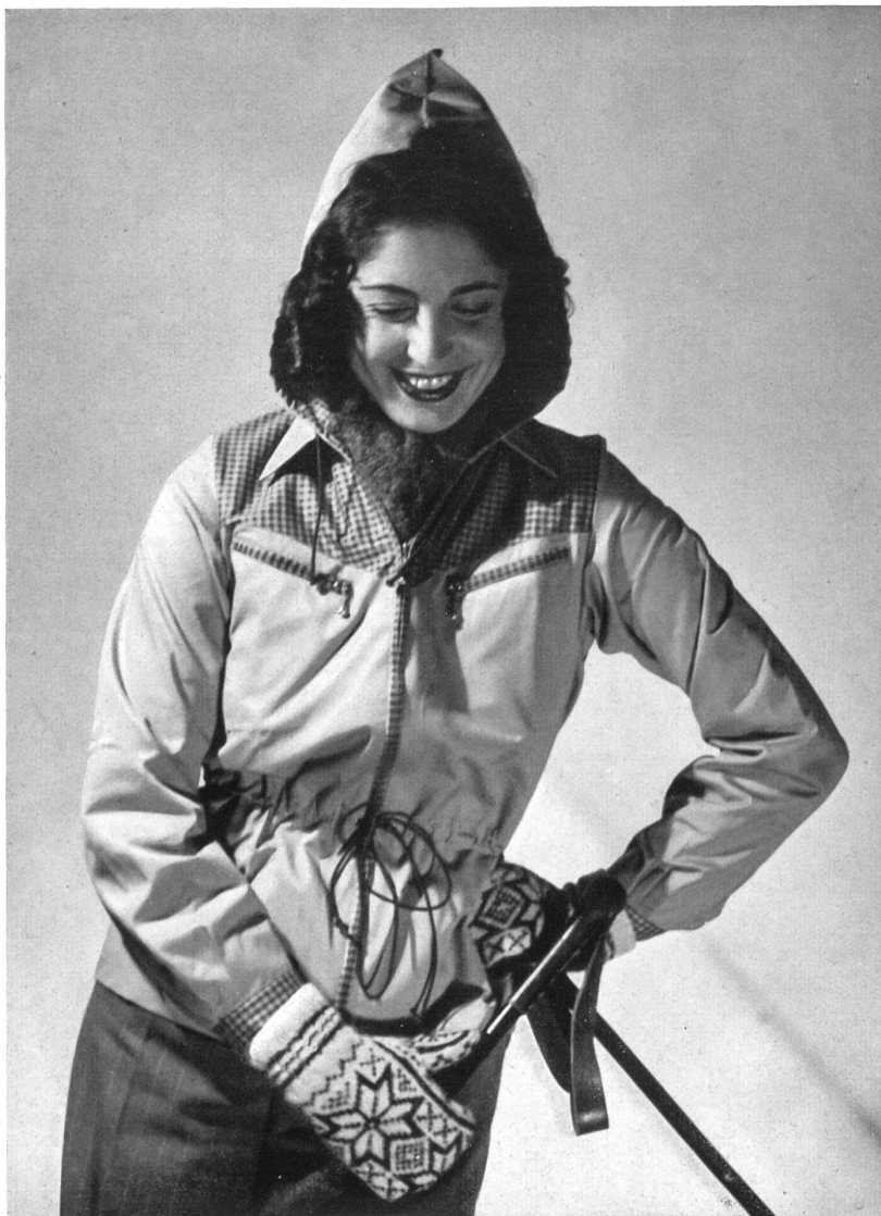
Blouse FIS-fantaisie « Protector » de la S. A. Gust. Metzger, Bâle.

Les pantalons de ski, à fermeture éclair, sont en gabardine imperméable. Le modèle « Sauteur » (Vorlager), serré à la cheville, est le préféré de la skieuse expérimentée, tandis que la débutante portera son choix sur le « plus-four » qui donne plus