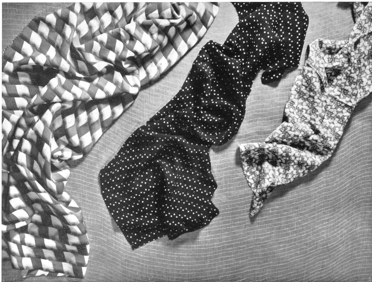
Tissus rayonne de Haas & Cie, Zurich.

La meilleure preuve de perfection de ces articles, de leur valeur commerciale et de leur adaptation aux exigences de la mode, est le fait que leur exportation est en augmentation constante, malgré les difficultés actuelles du commerce extérieur. Dans la dure bataille pour les marchés étrangers et malgré la concurrence redoutable des grands pays, les produits suisses réussissent à s'imposer, faisant ainsi une démonstration éclatante de leur qualité.