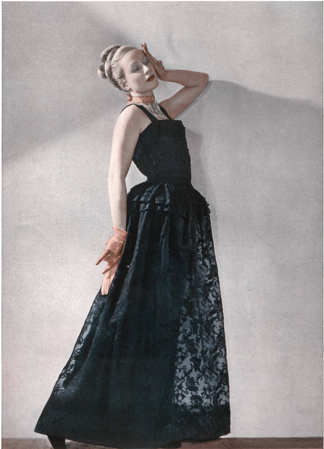
Robe de guipure de Schiaparelli, Paris.