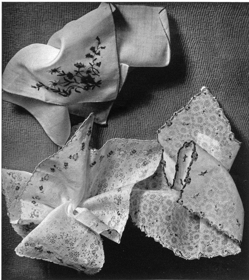
Mouchoirs brodés de Ed. Sturzenegger S. A., St-Gall.

E N collaboration étroite avec les couturiers les plus en vue, les industriels de St-Gall vont de l'avant, créent sans cesse, devancent la mode et sont devenus un élément actif extrêmement important dans l'art de la couture.