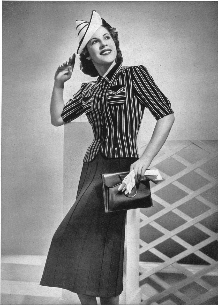
Gillover et Jupe „ALPINIT“ de Ruepp & Cie. S. A., Sarmenstorf.

Les ensembles et tailleurs exécutés avec ces tissus mettent leur note amusante et fraîche sur toutes les rives ensoleillées, dans les paysages riants et, en général, partout où se manifestent la joie et l'exubérance de la jeunesse.