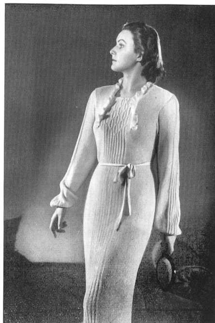
Modèle des Tricotages Zimmerli & Cie. S. A., Aarbourg.

Pour cet usage les étoffes employées sont souples, belles et lourdes ; leur résistance et leur matière infroissable les rendent pratiques et absolument indispensables.