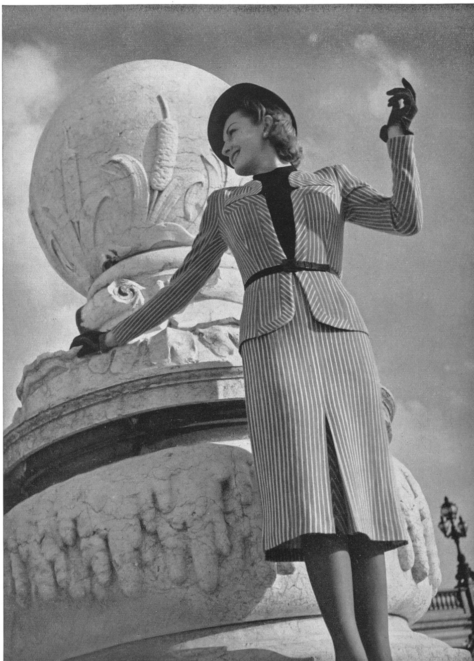
Élégant trois-pièces à rayures, garni de biais. Réalisé par HANRO dans son tricot infroissable.

C APRICIEUSE, la mode actuelle dicte des lois charmantes avec une verve et un optimisme réjouissants. Elle n'a jamais été si recherchée, inspirée et en même temps plus près des réalités, soucieuse d'être à la portée de tous.