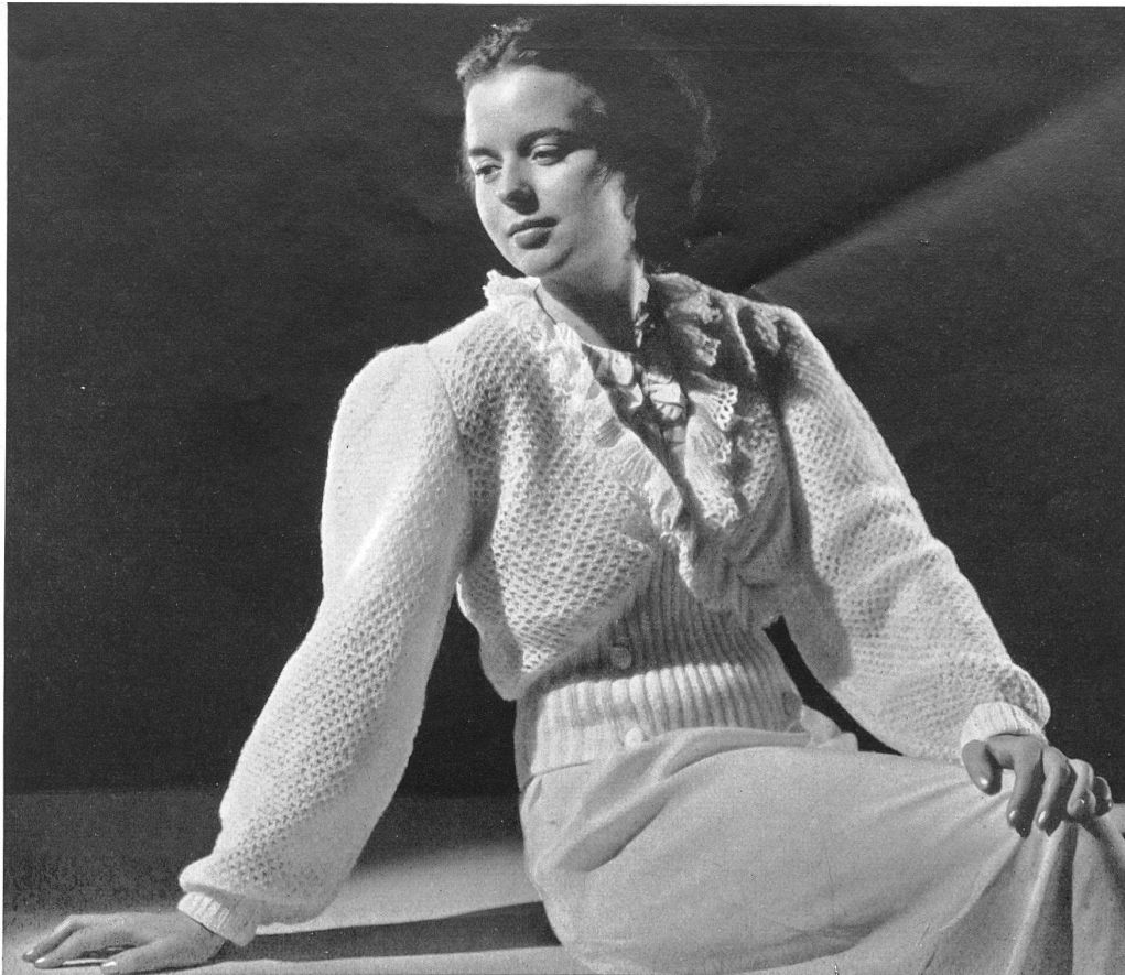
Liseuse tricot main de Peter Merz & Cie., Arlesheim.

Des jupes finement plissées s'accompagnent de vestes ajustées, rayées ou unies, les robes évasées s'agrémentent de boléros très courts sous lesquels se nouent de hautes ceintures drapées.