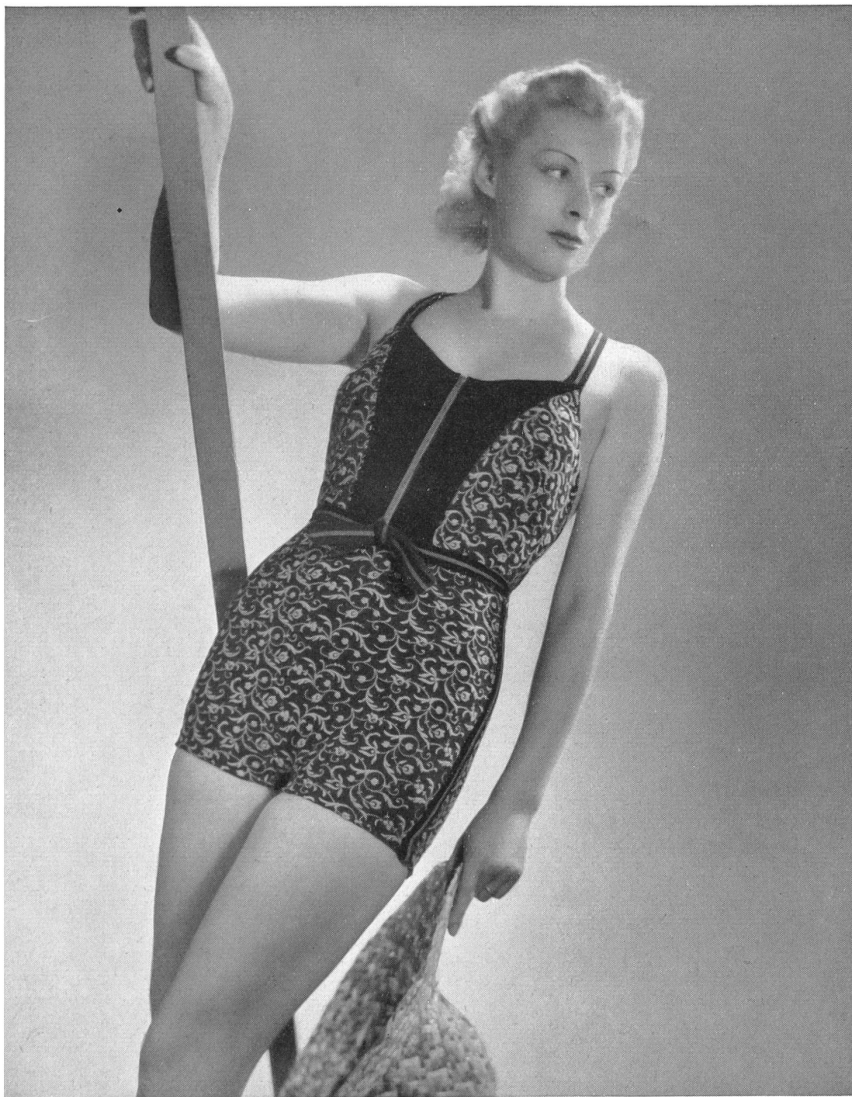
Modèle „NABHOLZ-PERFECTA “ des Tricotages mécaniques Nabholz S. A., Schoenenwerd.

Des capes enveloppantes et souples se doublent de couleur vive s'harmonisant avec l'ensemble. Ce détail leur donne une note originale et très personnelle.