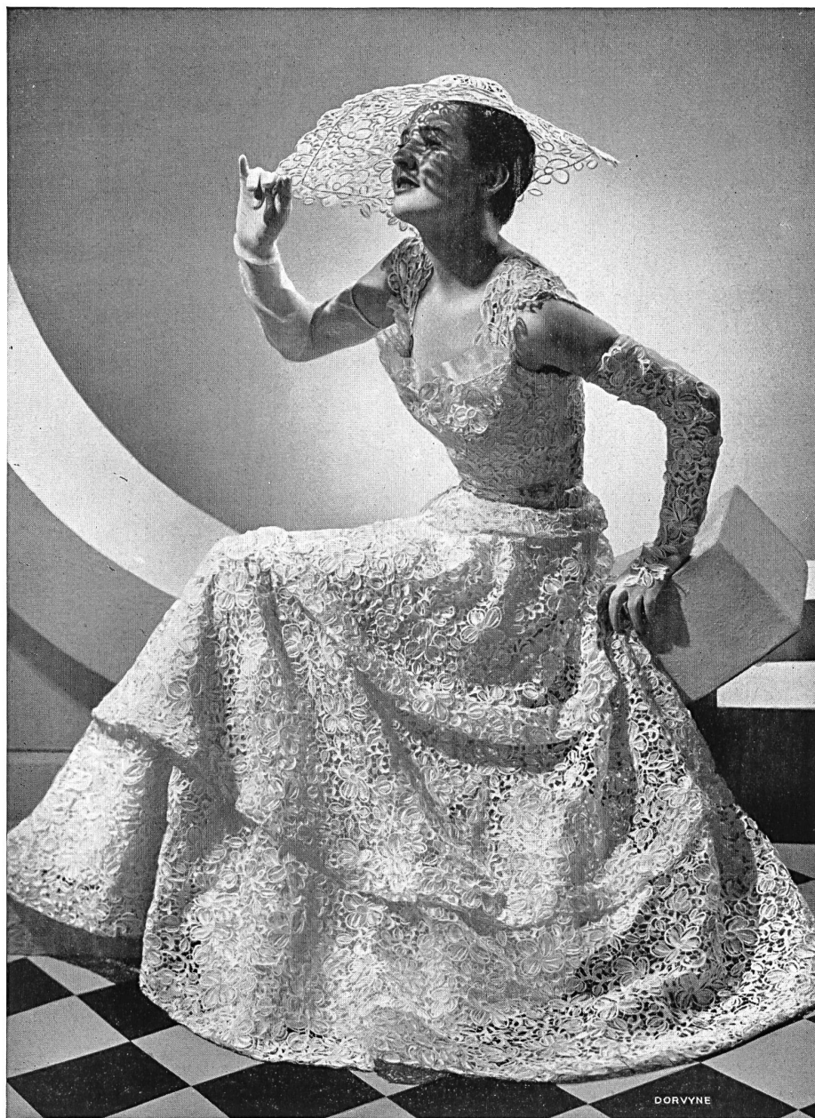
Broderies de St-Gall. Modèle de Schiaparelli, Paris. Robe de dentelle de Venise repoussée