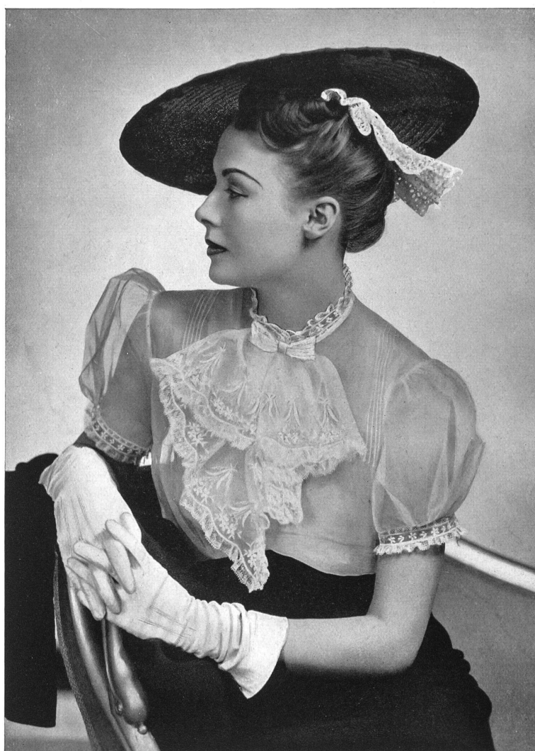
La broderie suisse dans la Haute-Couture

La robe qui figure sur la couverture est un modèle de Robert Piguet, Paris, qui montre la tendance de la mode pour les jupons avec broderies de St-Gall.