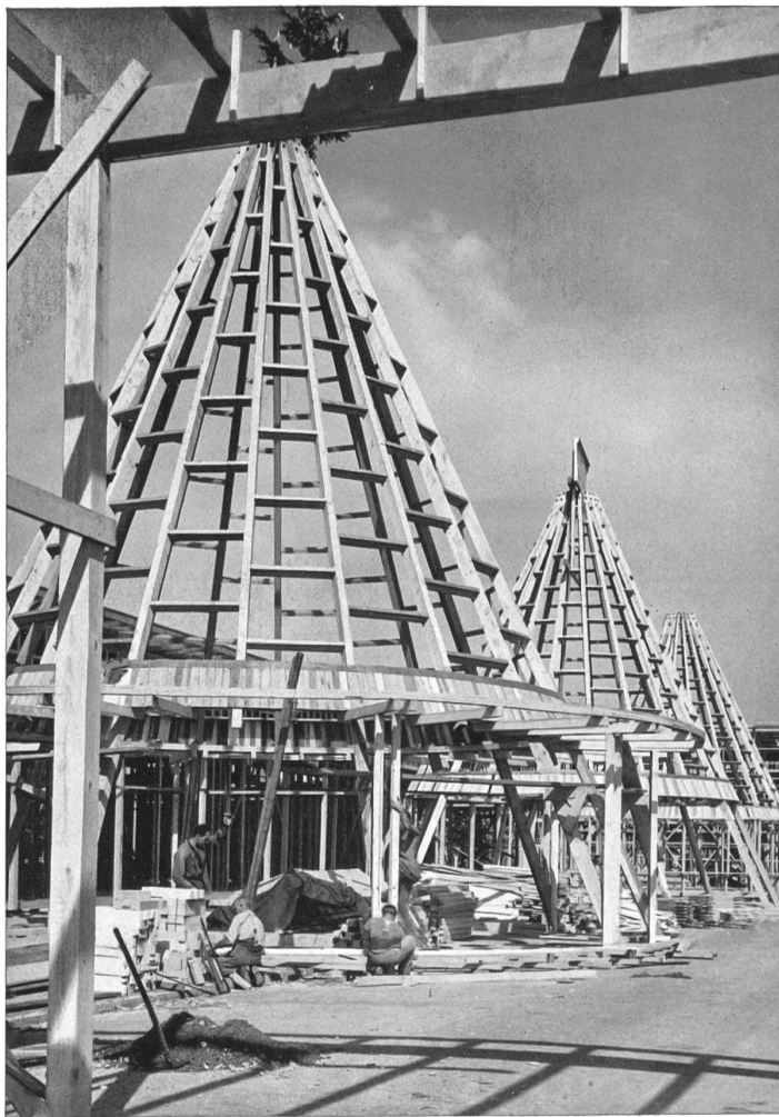
Les trois petites tourelles de l'entrée du pavillon des textiles

Ce pavillon de l'industrie textile sera l'expression de l'esprit qui règne à l'Exposition nationale 1939: il sera vivant, sobre, et le visiteur pourra y puiser une foule d'enseignements.