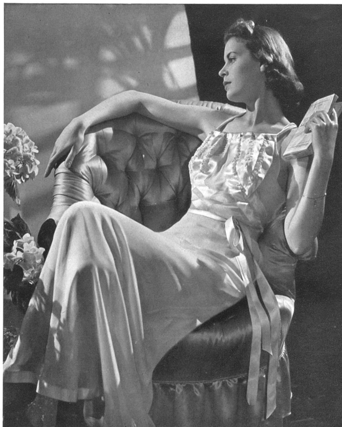
Dubrulle Chemise de nuit forme empire en crêpe rose garnie de rubans de satin rose.

Dans la lingerie, le ruban devient un complément indispensable, son luxe soyeux est le point final mis sur ces petites merveilles de finesse et de transparence que créent les patientes lingères.