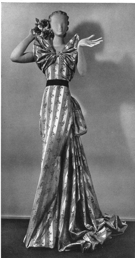
Damas 2 lats de la collection Grieder & Cie, soieries, Zurich.