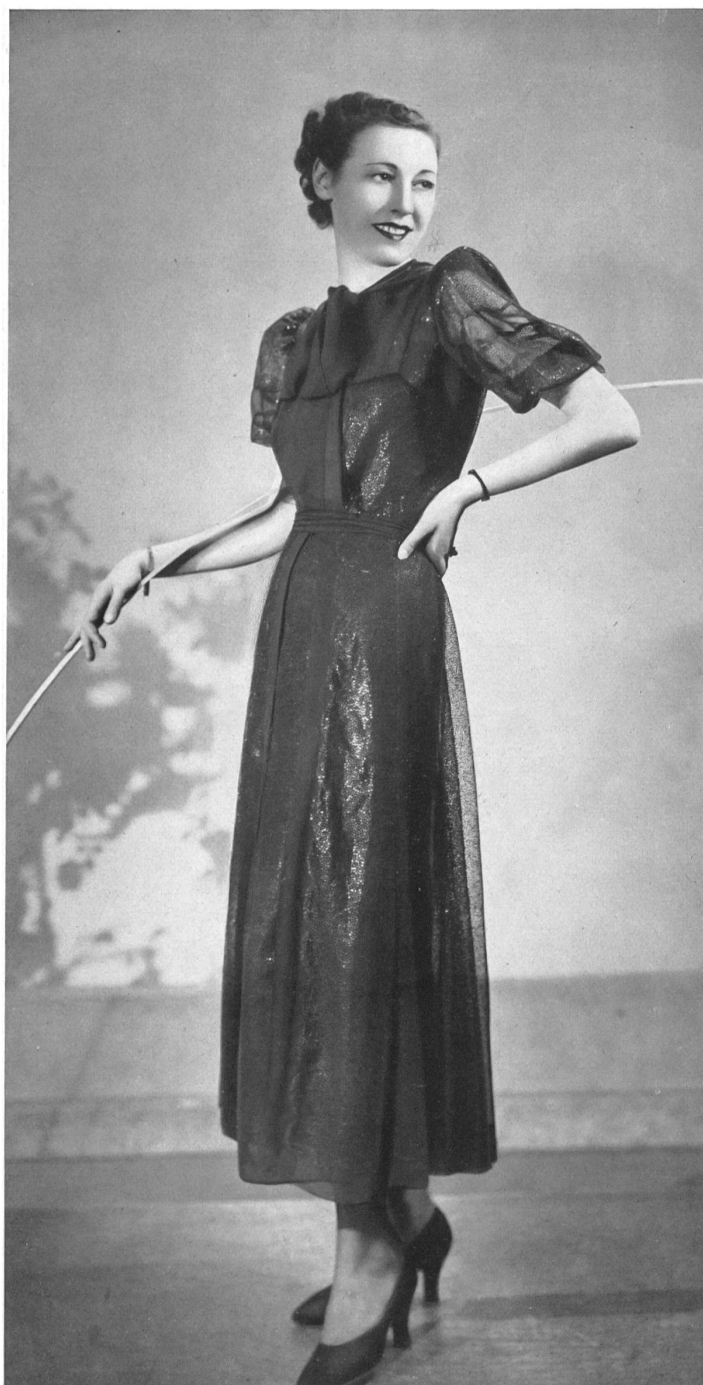
Robe d'Agnès Drecoll. Guipure cirée bleu marine, d'Union S. A., St-Gall.

Les dentelles plus fines et légères se traitent, elles, un peu comme le tulle. Mètres et mètres forment la vaste cloche en forme aux multiples godets faisant valoir la taille fine, serrée dans d'étroites ceintures brillantes.