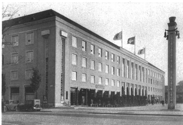
L'entrée principale de la Foire Suisse d'Echantillons à Bâle.

L'industrie textile suisse gravite naturellement dans l'orbite de la mode parisienne ; son objectif est de satisfaire les exigences de sa clientèle et d'adapter sa production à la vogue du moment. Mais on constate aussi que, dans certaines spécialités, l'industrie textile suisse exerce une influence marquée par la qualité de ses produits et la fantaisie ingénieuse qui préside à la création de ses modèles. C'est le cas pour les tricotages, dont la réputation est solidement établie, ainsi que pour les broderies de Saint-Gall qui ont reconquis la grande vogue et sont aujourd'hui utilisées pour des applications très variées, grâce au talent des dessinateurs et au fini de l'exécution qui procède d'une tradition très ancienne. Quant aux tricotages, la pratique sans cesse accrue des sports en a généralisé l'usage et, dans ce domaine aussi, une esthétique nouvelle s'affirme peu à peu ; il en est résulté de nombreuses créations appropriées à leurs divers usages, en sorte qu'aujourd'hui l'industrie suisse des textiles fournit aussi tous les ouvrages en tricot.