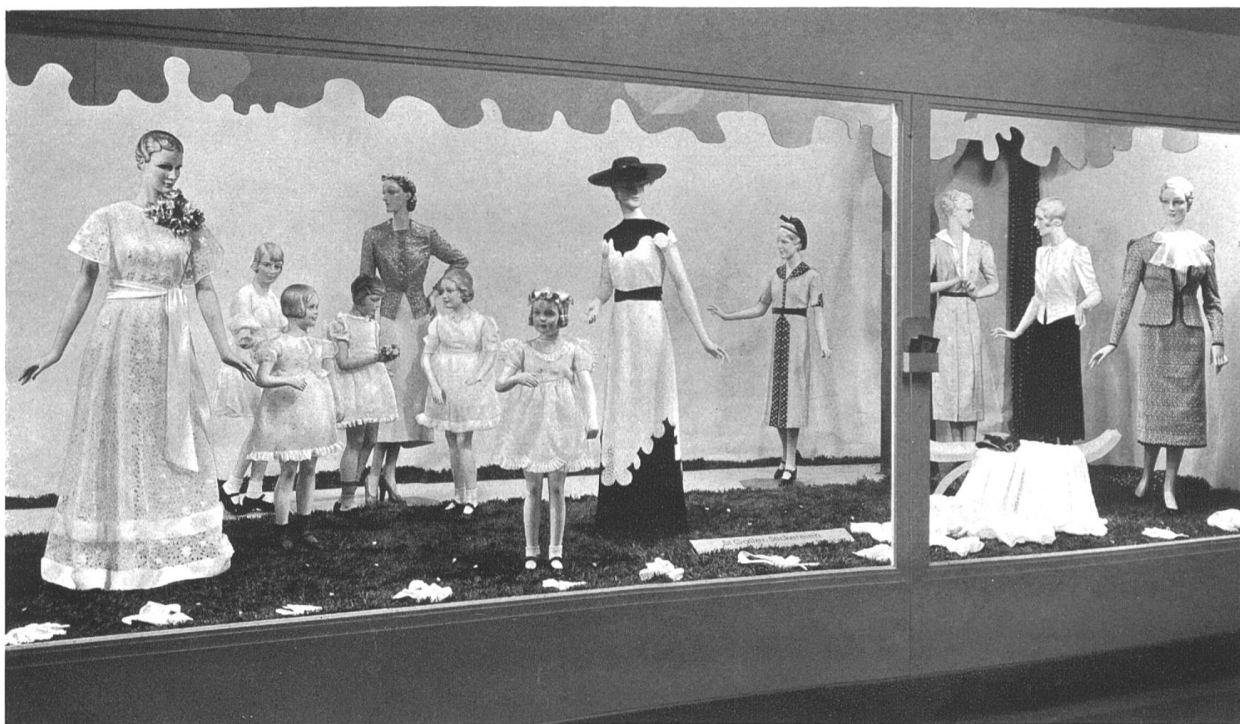
Une vitrine réservée à la broderie suisse.

s'est efforcée depuis toujours de donner un relief particulier au Groupe des Textiles , pour lequel le public manifeste à juste titre un vif intérêt. L'heureux éclectisme des présentations, l'attrait des nouveaux stands, l'activité qui y règne, enfin l'empressement avec lequel sont accueillis visiteurs et visiteuses, créent au Groupe des Textiles et au Salon de la Mode une atmosphère d'aimable optimisme.