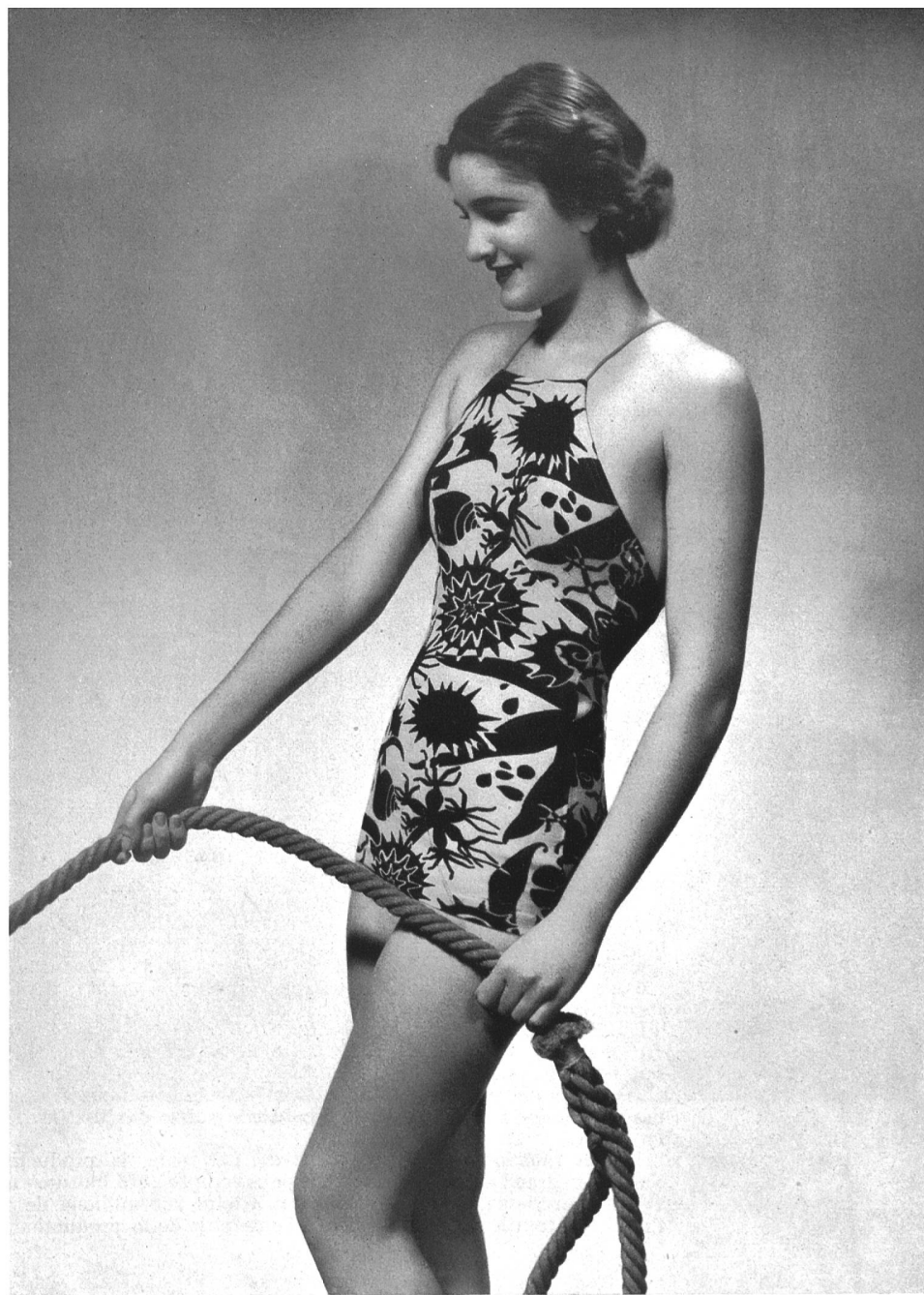
Modèle « Nabholz-Perfecta » de Nabholz S. A., Schö- nenwerd.

Pour l'hiver, nous avons toujours ces agréables sous-vêtements en tricot, chauds et cependant légers. La chemise, le pantalon, ou bien ces deux réunis en une pièce, révèlent cette année une certaine recherche dans les détails ; comme on le voit sur la photo ci-contre, l'empiècement est presque toujours en forme de soutien-gorge ; le point de fantaisie, imitant la dentelle, a rendu plus coquette cette parure pourtant sommaire ; la taille est cintrée par un point de côté. La chemise de nuit en tricot est l'objet de plus de recherches ; on ne lui demande pas, comme au sous-vêtement, d'être plate et simple. Alors les fabricants s'ingénient à les rendre de plus en plus tentantes : des volants, des fronces, des points qui varient avec chaque modèle, des formes très habillées, voilà ce qu'on nous offre à présent.