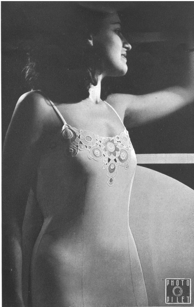
Modèle « Opaline » de A. Naegeli S. A., Winterthur.

layette en tricot, qui laisse aux enfants toute liberté de mouvements, tout en les habillant chaudement, jusqu'à la charmante robe de petite fille, simple, nette, qu'un petit col de broderie de laine rehausse d'un ton vif.