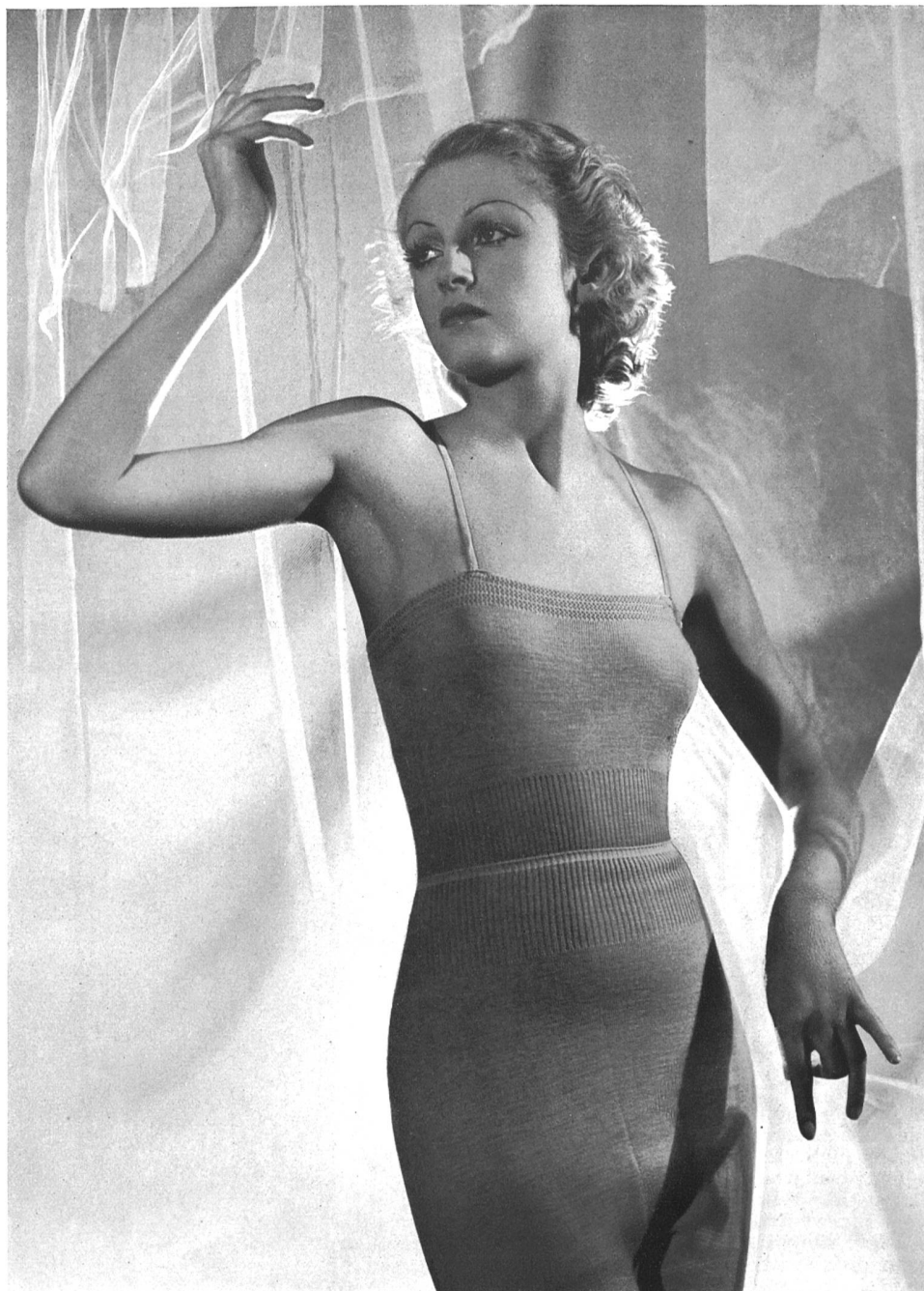
Modèle « Hisco » de His & C ie S.A., Mur- genthal.

Le tricot règne sur la mode. Alors qu'hier il n'était destiné qu'aux modèles de sport, qu'on ne lui demandait que d'être pratique, il entre aujourd'hui dans la haute couture dans des proportions surprenantes. Les filatures et les retorderies ont rivalisé d'ingéniosité dans la création des nouveaux fils à tricoter : bouclés, câblés, auxquels viennent s'ajouter les laines mélangées à la soie, aux poils d'angora, de chèvre et de cygne. La laine mêlée de certains fils métalliques est très demandée pour les tricots de fantaisie. Ce que l'on découvre, c'est la ferme intention des fabricants suisses d'encourager, par ces nouveautés, une mode aussi intelligente. En effet, si vous recourez au costume de tricot, ce dont vous n'aurez qu'à vous louer, il suffit de jeter un coup d'œil sur les dernières créations pour constater que les couturiers se sont lancés sur cette précieuse matière.