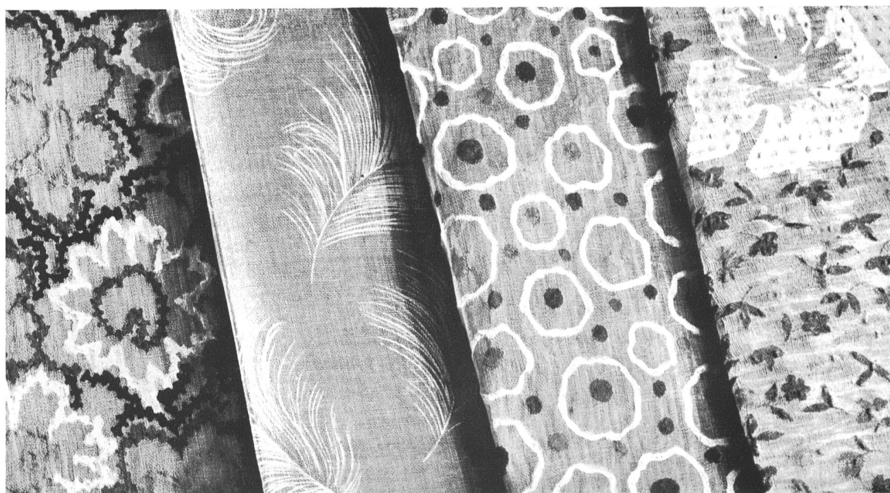
Tissus de coton « Fisba » de Fischbacher & C ie , St-Gall.

constitué la plupart des tenues de plage et des robes d'été, des vastes manteaux, pyjamas, shorts, bains de soleil, turbans, robes de campagne. Les différents tissages du piqué en font un tissu plein de fantaisie: tantôt il est rayé, quadrillé, tantôt pointillé ou chevronné. Quant aux cretonnes aux vifs coloris, les couturiers ont utilisé certaines d'entre elles pour des manteaux du soir, et c'était d'un effet surprenant. Tulles, organdis, mousselines, tissus ajourés de broderies anglaises, c'est vous qui apportez toute cette poésie aux délicates soirées d'été. Les fabricants vous ont dotés des plus jolis agréments en vous tissant, en vous brodant, en vous imprimant. Nous avons, grâce à vous, une collection complète qui s'offre à notre désir.