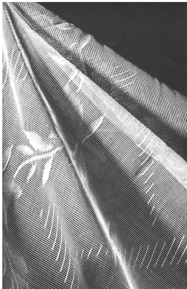
Tissu pour rideaux, marque Emand, d'Emile Anderegg S.A., St-Gall.

constitué la plupart des tenues de plage et des robes d'été, des vastes manteaux, pyjamas, shorts, bains de soleil, turbans, robes de campagne. Les différents tissages du piqué en font un tissu plein de fantaisie; tantôt il est rayé, quadrillé, tantôt pointillé ou chevronné. Quant aux cretonnes aux vifs coloris, les couturiers ont utilisé certaines d'entre elles pour des manteaux du soir, et c'était d'un effet surprenant. Tulles, organdis, mousselines, tissus ajourés de broderies anglaises, c'est vous qui apportez toute cette poésie aux délicates soirées d'été. Les fabricants vous ont dotés des plus jolis agréments en vous tissant, en vous brodant, en vous imprimant. Nous avons, grâce à vous, une collection complète qui s'offre à notre désir.