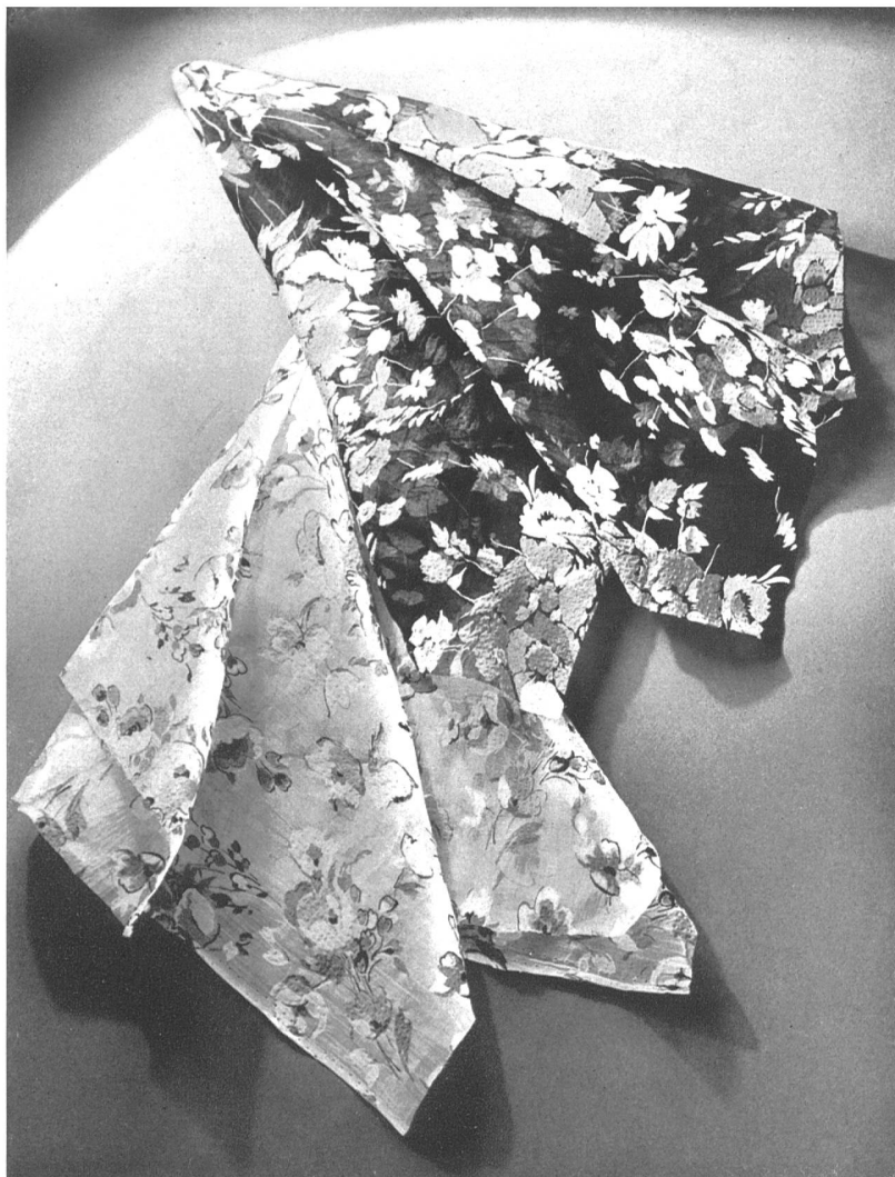
Dernières créations de Taco S. A., Zurich.

La mode a recours aux tissus de coton en matière de décoration. Peut-on renouveler son intérieur sans dépenses excessives ? Oui, car les étoffes de coton offrent pour cela maintes combinaisons. Les percales, le reps, le satin et les mousselines, par leur gamme de coloris clairs ou foncés, par leurs dessins genre ancien ou moderne, s'adaptent à tous les styles. Un choix judicieux parmi ces tissus habillera une pièce avec art et aura l'avantage de ne pas coûter trop cher. C'est dans ce but que les fabricants suisses ont dirigé leurs efforts, et la matière de qualité qu'ils fournissent reste à la portée de tous.