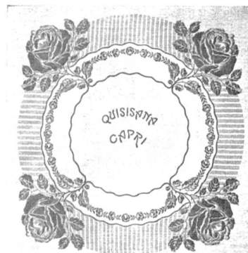
Lingerie d'hôtel avec inscriptions tissées. Modèles de Schmid & Cie. Tissage de toi- les, Berthoud.