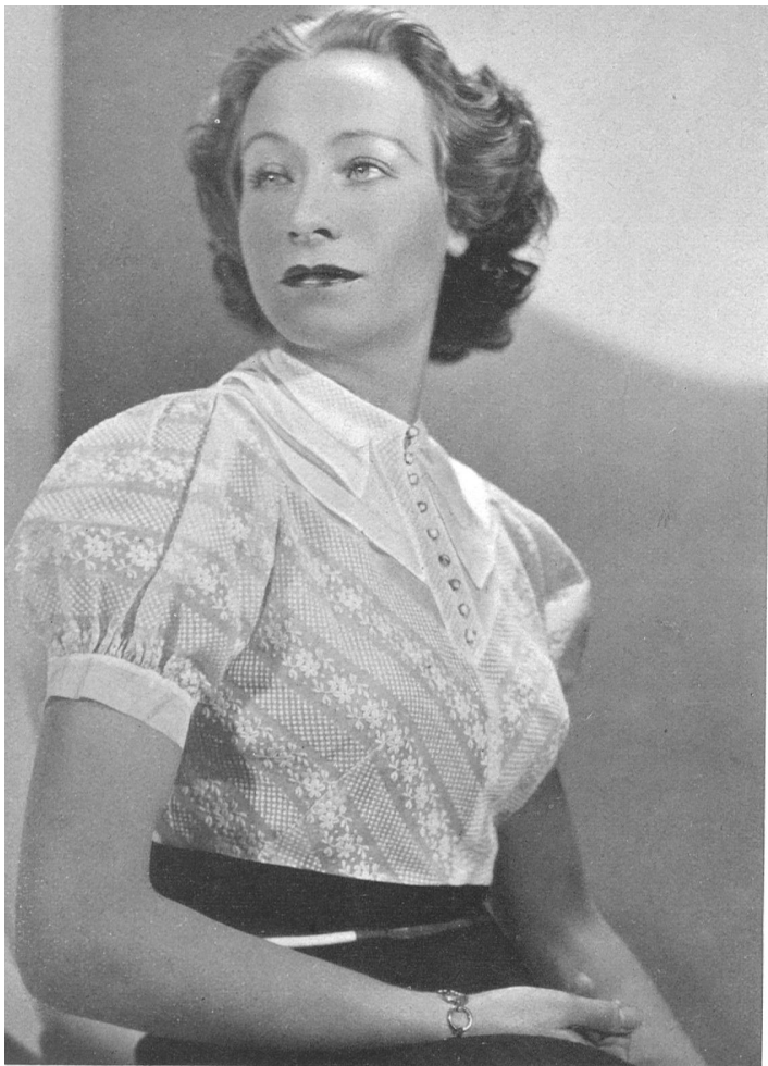
Blouse de linon brodé accompagnant un tailleur. Jane, Paris.

Les broderies étincelantes qui enrichissent seulement les robes du soir sont maintenant utilisées pour les robes plus simples, sur lesquelles les paillettes jettent des scintillements d'étoiles. Beaucoup de broderies métalliques, non seulement or, mais cuivre et acier.