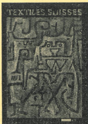
UNSER TITELBLATT Siehe Seite 117