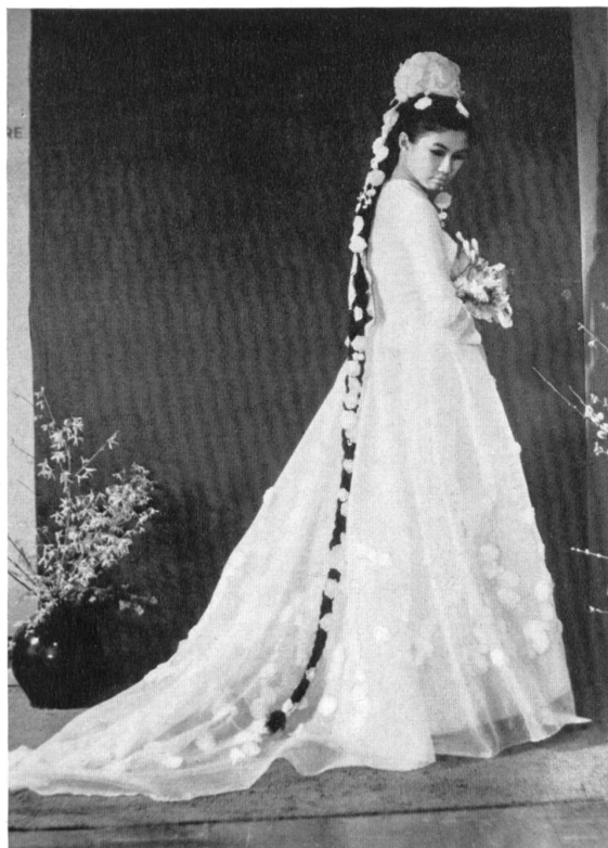
Hochzeitskleid, Modefachschule Kingston (Surrey): Der bodenlange Zopf ist mit Spitzenapplikationen verziert