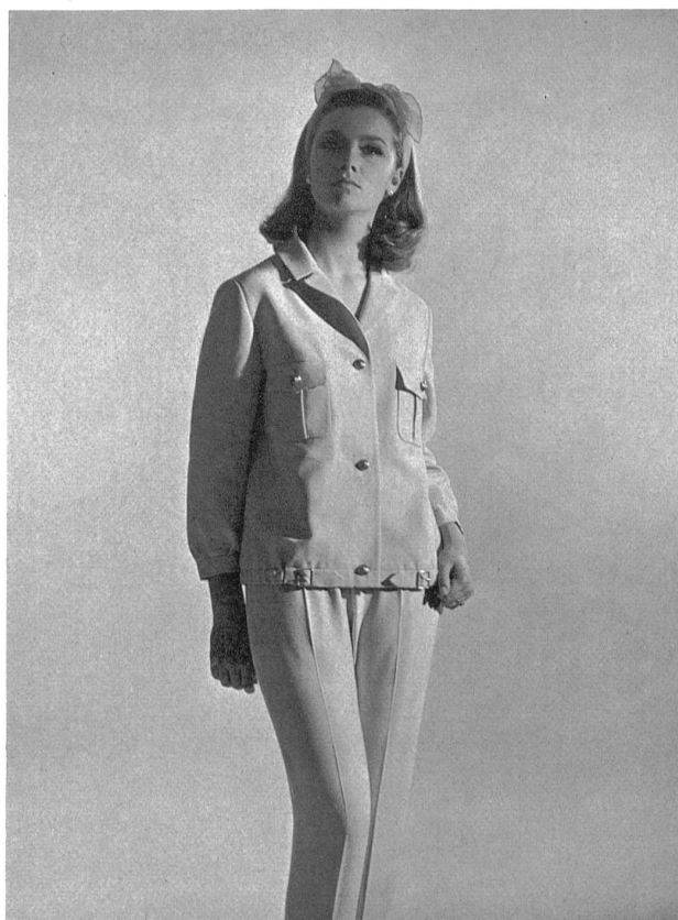
Deux-pièces de sport en « Hélanca », 100 % « Térylène » Modèle: Jacob Weil & Co., Zurich

Kürzlich fand in Zürich eine « Terylene- » Gewebe-Schau aus allen EFTA-Ländern statt, an der sich auch vierzig Schweizer Fabrikanten beteiligten. Besondere Aufmerksamkeit erregte die Neuentwicklung von Terylene « Sedusa », das leicht zu pflegende, feine Gewebe mit Batist-Charakter und zahlreichen, neuen Stickmotiven. Ebenfalls aus reiner Terylene sind die elastischen Gewebe zu erwähnen und der Jersey aus dem neuen, texturierten Garn, « Crimplene » genannt. Unter den Mischgeweben machen wir auf Nouveautés aufmerksam, die sich dank neuer Veredelungsverfahren durch einen weichen, wolligen Griff auszeichnen. Die Farben und Muster sind von grosser Vielfalt, Wolle mit « Terylene » auch buntgewoben. Für Regenbekleidung gibt es verschiedene Mischgewebe, « Terylene » mit Wolle, Baumwolle oder Zellwolle, imprägniert und oft laminiert, auch einen neuen « Terylene »-Baumwollsatin.