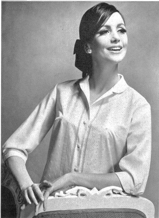
Blouses brodées en pur « Térylène », « Sedusa Schappe Quality » Modèle: Metzler S.A., Saint-Gall

Der Erfolg der Chemiefasern führte vielerorts dazu, die Stoff-Nouveautés unter dem Gesichtspunkt der verarbeiteten Faser vorzustellen. So kamen Werbungen und vor allem die von den Konfektionären sehr geschätzten Gewebe-Ausstellungen zustande, denn sie geben die Möglichkeit, unter den Produkten der verschiedenen Weber die Stoffe bestimmter Faserkombinationen auszuwählen, die den Bedürfnissen der Konfektion am besten entsprechen.