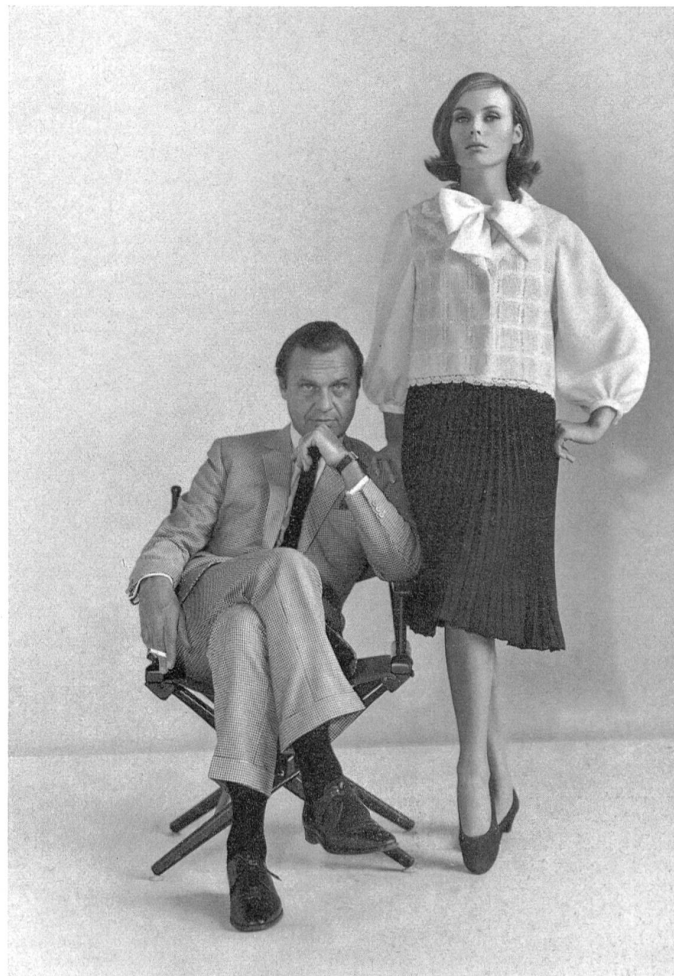
Swiss Fabric and Embroidery Center, New York