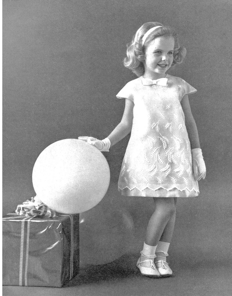
« NELO », J. G. NEF & CO. S.A., HÉRISAU Organdi blanc brodé White embroidered organdie Modèle de Youngland