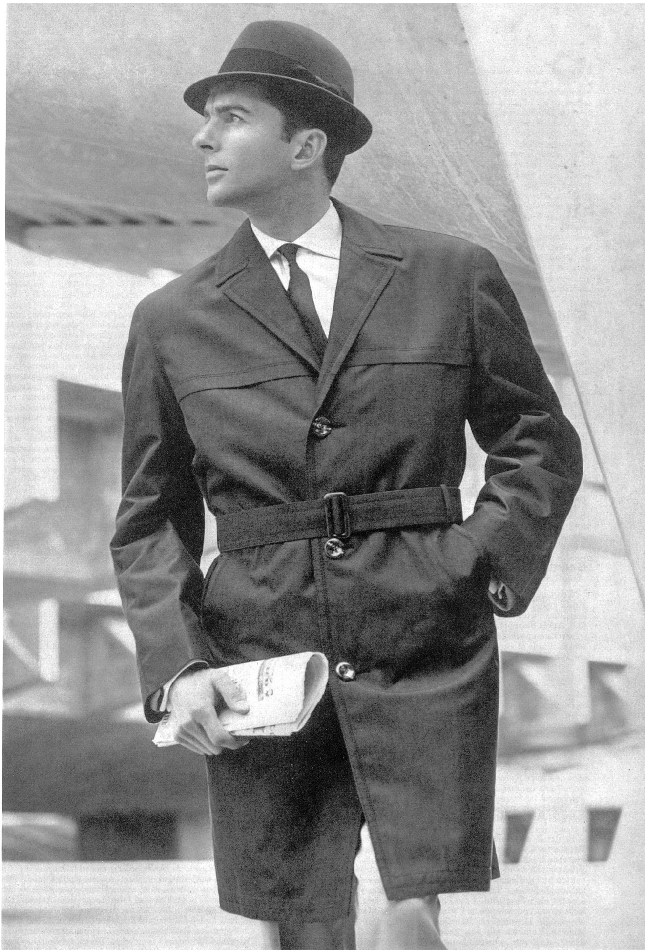
HAUSAMMANN TEXTILES S.A., WINTERTHUR Tissu de coton changeant Shot cotton fabric Tejido de algodón tornasolado Baumwoll-Changeant Gewebe Modèle « Strellson », Friedr. Straehl & Co. S.A., Kreuzlingen