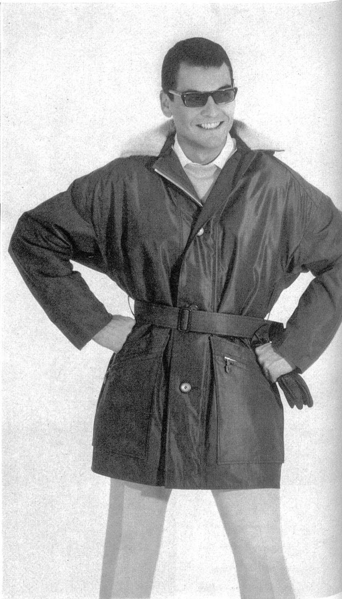
HAUSAMMANN TEXTILES S.A., WINTERTHUR Popeline changeante Shot poplin Popelina tornasolada Modèle « McGregor of Switzerland », Les Fils Fehlmann & Cie S.A., Schöftland