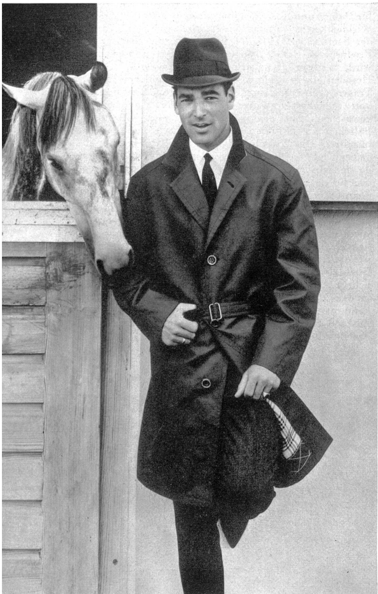
HAUSAMMANN TEXTILES S.A., WINTERTHUR Gabardine changeante double retors Double-twist shot gabardine Gabardina tornasolada, hecha con hilos retorcidos Changeant Vollzwirngabardine Modèle « PKZ », Burger-Kehl & Cie S. A., Zurich