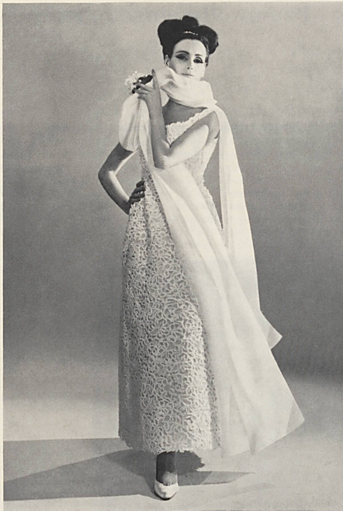
Guipure blanche de Saint-Gäll St. Gall white etched lace Encaje guipur blanco de San Galo Weisse St. Galler Guipure Modèle Macola S. A., Zurich

schwarz/weiss oder farbig auf Grossleinwand ermöglicht. Die Gäste konnten also simultan die Aufnahmen der TV in einem auf der Bühne installierten Studio und deren direkte, farbige, Wiedergabe auf der darüber angebrachten Grossleinwand sehen. Der Einsatz des «Eidophor» brachte auch die interessante Möglichkeit, dem ganzen Saal die verarbeiteten Gewebe und Stickereien nach Belieben in vergrößerter Struktur und im Einzelnen vor Augen zu führen.