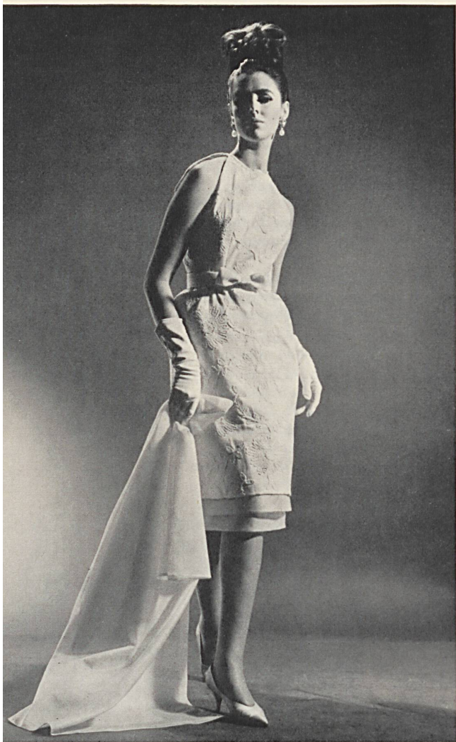
Shantung de coton brodé suisse Embroidered Swiss cotton Shantung Shantung de algodón bordado suizo Bestickter Schweizer Baumwoll-Shantung Modèle Jeanpalmério, Zurich