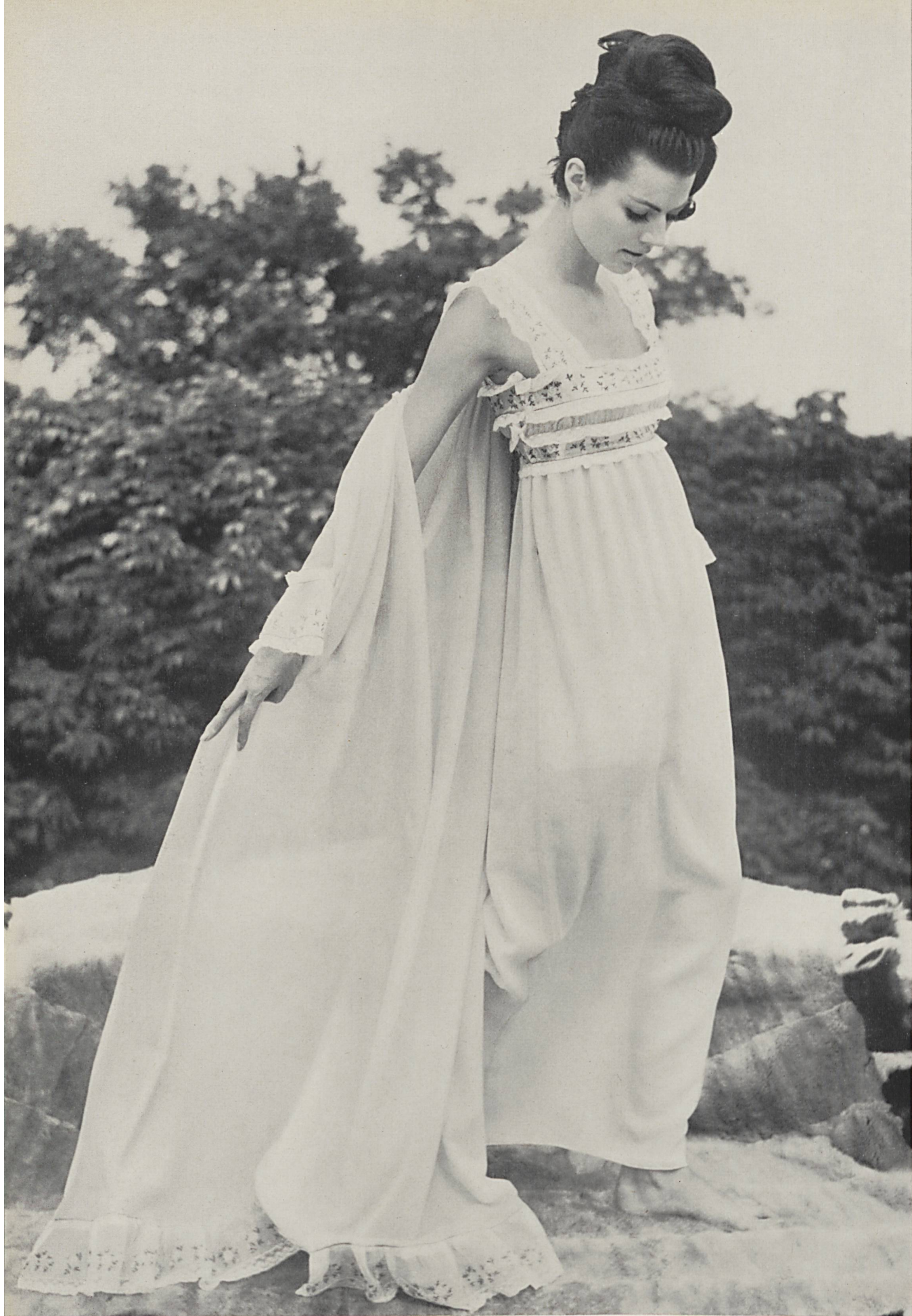
CHRISTIAN DIOR (Boutique) Bandes d'organdi brodées couleur avec dentelles de A. Naef & Cie S. A., Flawil (Saint-Gall)