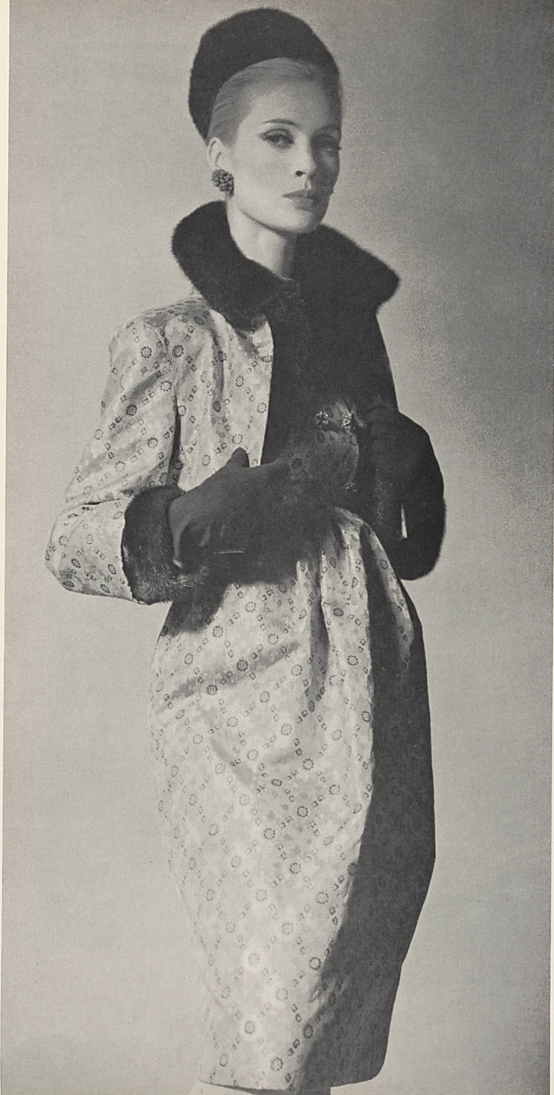
CHRISTIAN DIOR Soie brochée «Emir» de L. Abraham & Cie, Soieries S.A., Zurich