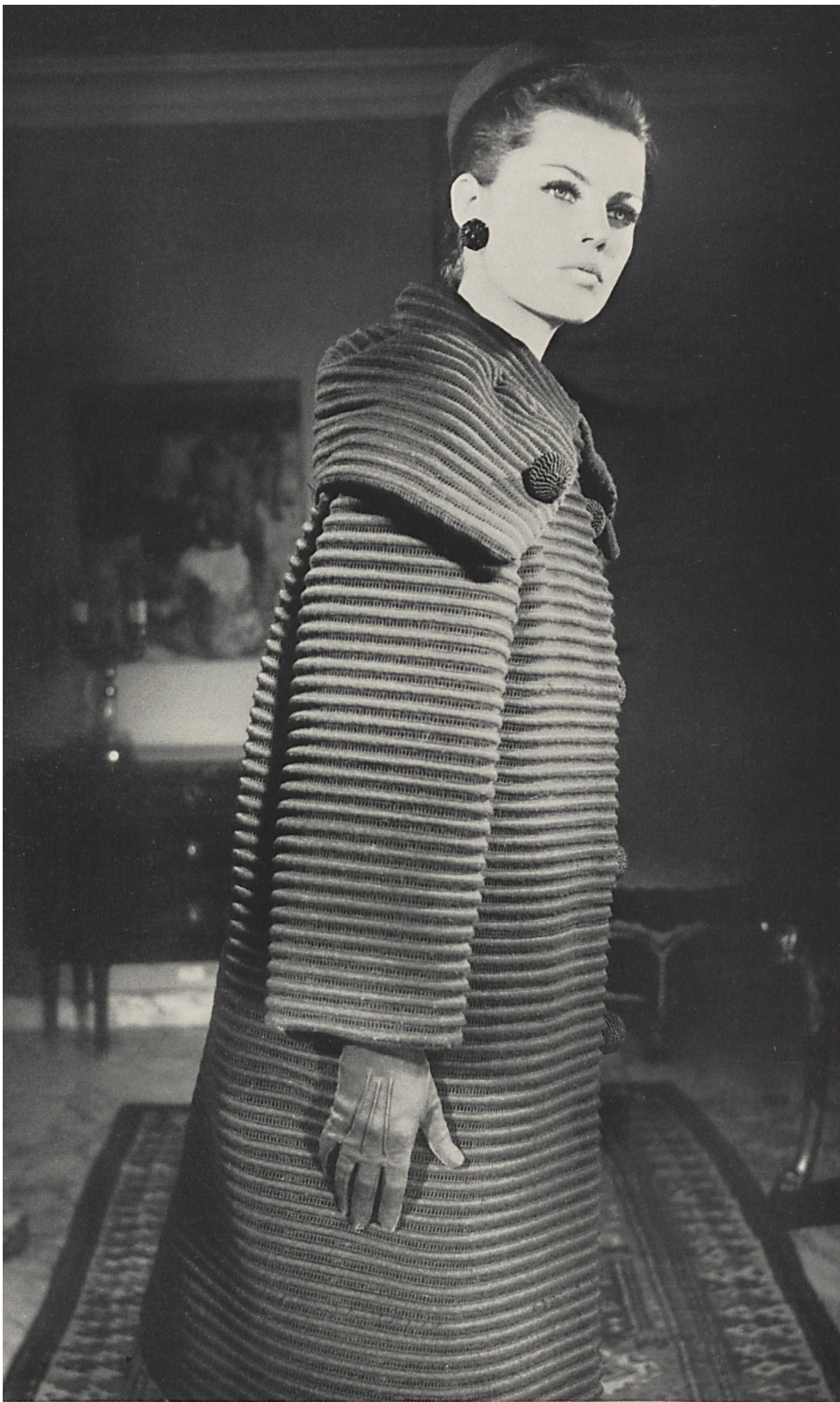
CHRISTIAN DIOR Laize brodée noire pure laine avec effets de jours de Rau S.A., Saint-Gall