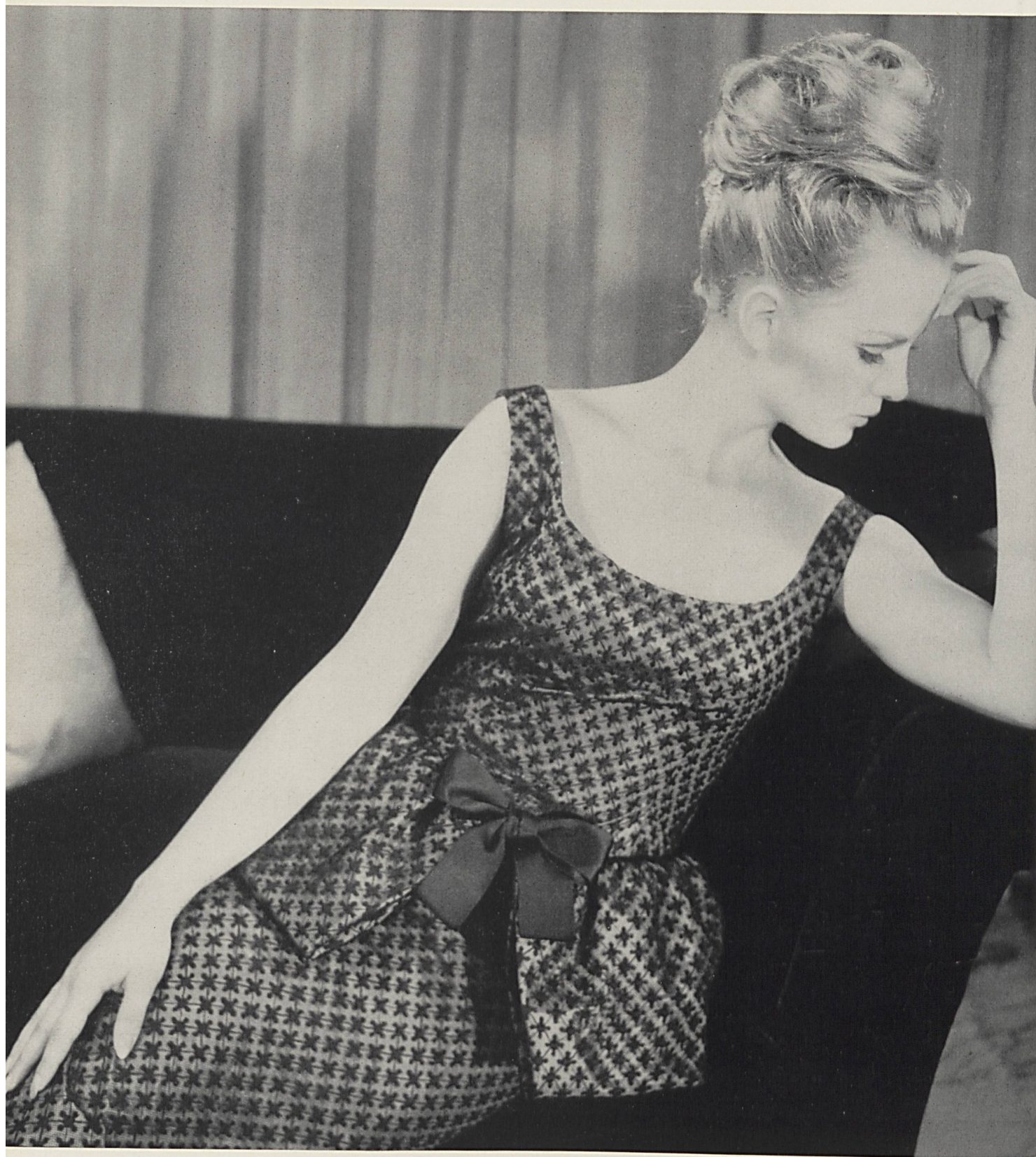
PHILIPPE VENET Tulle de nylon brodé coton de Forster Willi & Co., Saint-Gall Grossiste à Paris : Robert Burg & Cie