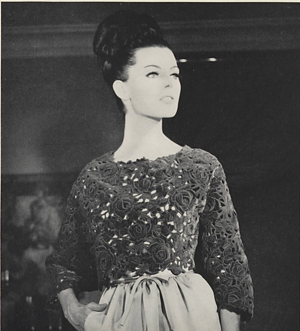
PIERRE CARDIN Dentelle de velours découpée en couleur avec effets de superposition de Union S. A., Saint-Gall Grossiste à Paris : Robert Burg & Cie