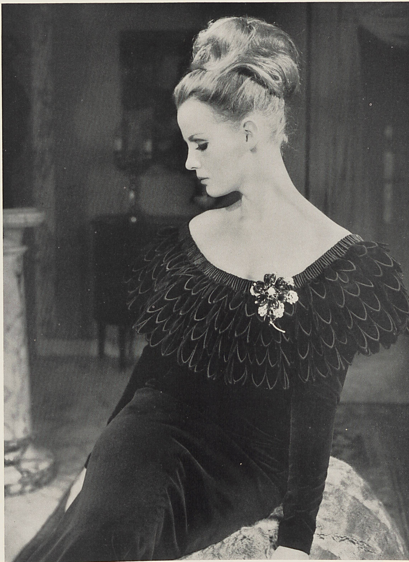
NINA RICCI Franges de velours étagées de A. Naef & Cie S.A., Flawil / Saint-Gall Grossiste à Paris: Robert Burg & Cie