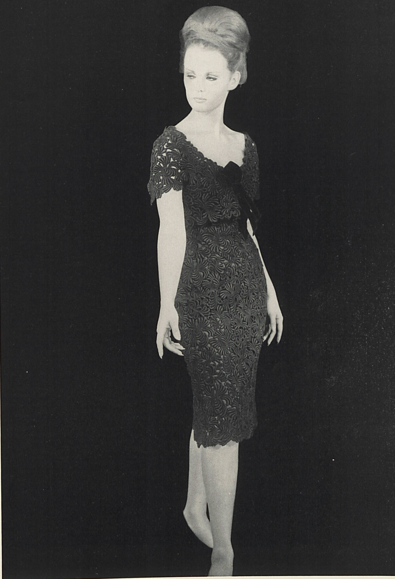
PIERRE BALMAIN Guipure de couleur de Union S. A., Saint-Gall