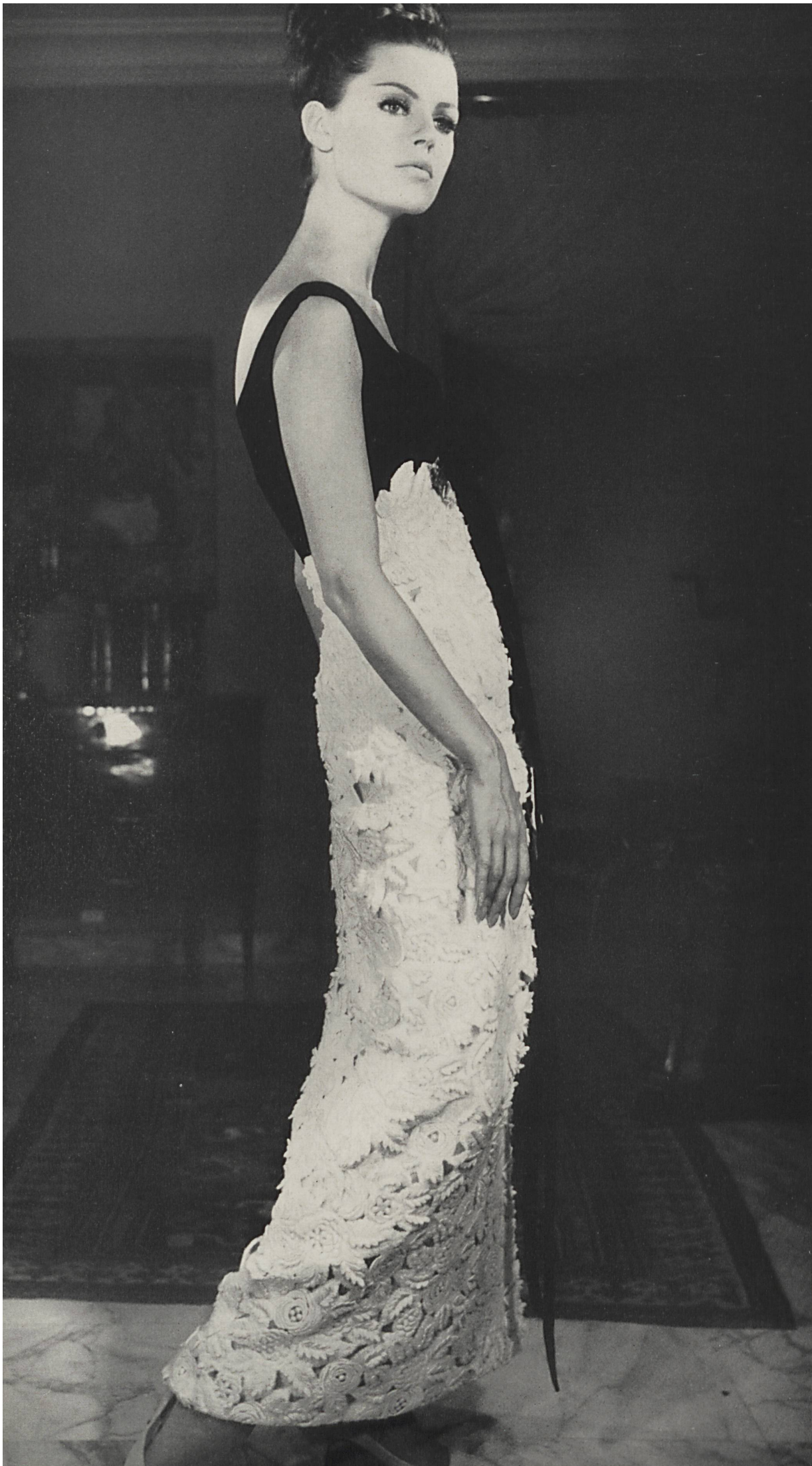
GUY LAROCHE Guipure de laine sur fond de laine, broderie superposée de Jacob Rohner S. A. Rebstein (Saint-Gall) Grossiste à Paris : Robert Burg & Cie