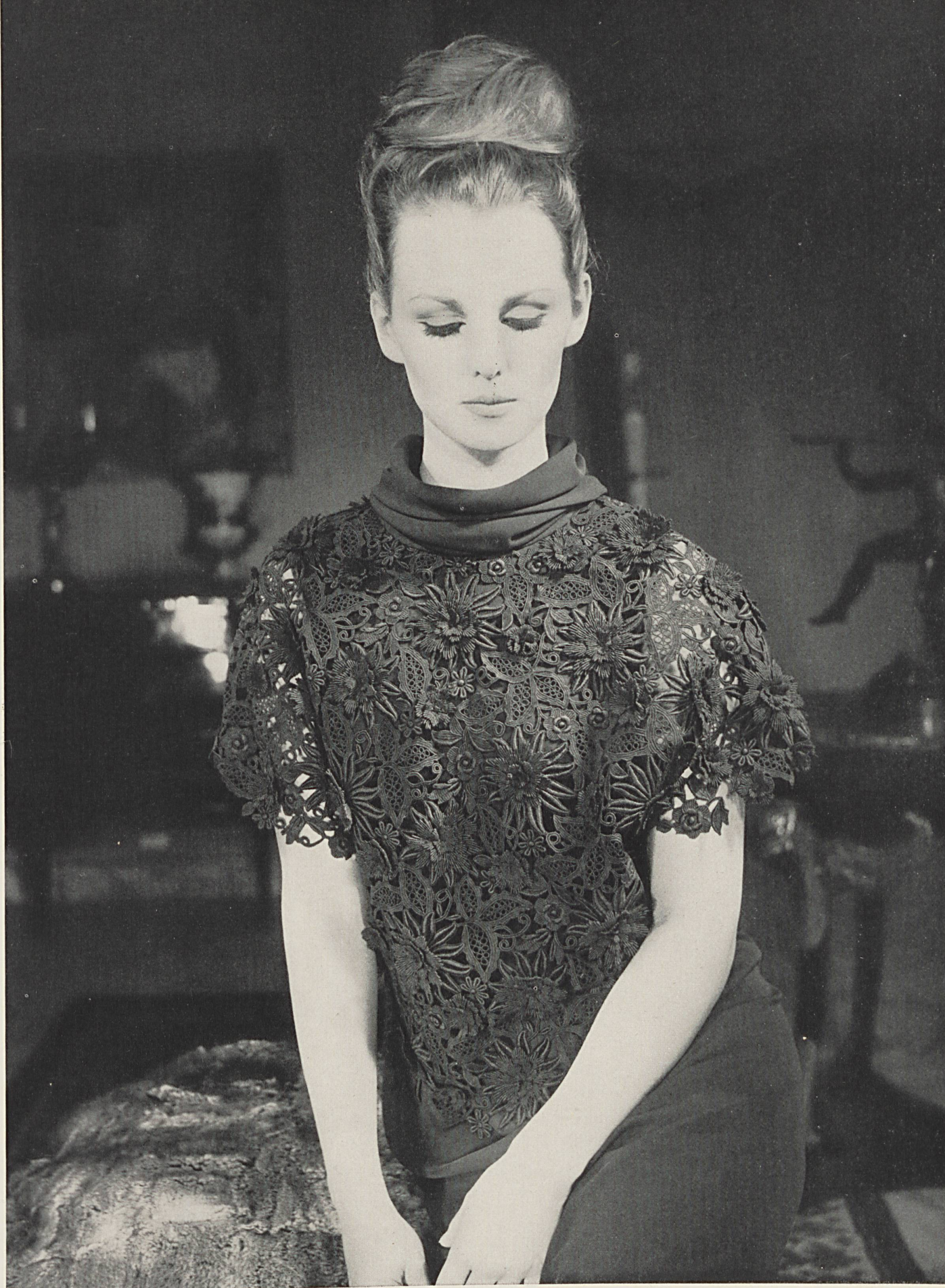
PIERRE CARDIN Dentelle de guipure avec motifs appliqués de Forster Willi & Co., Saint-Gall Grossiste à Paris: Robert Burg & Cie