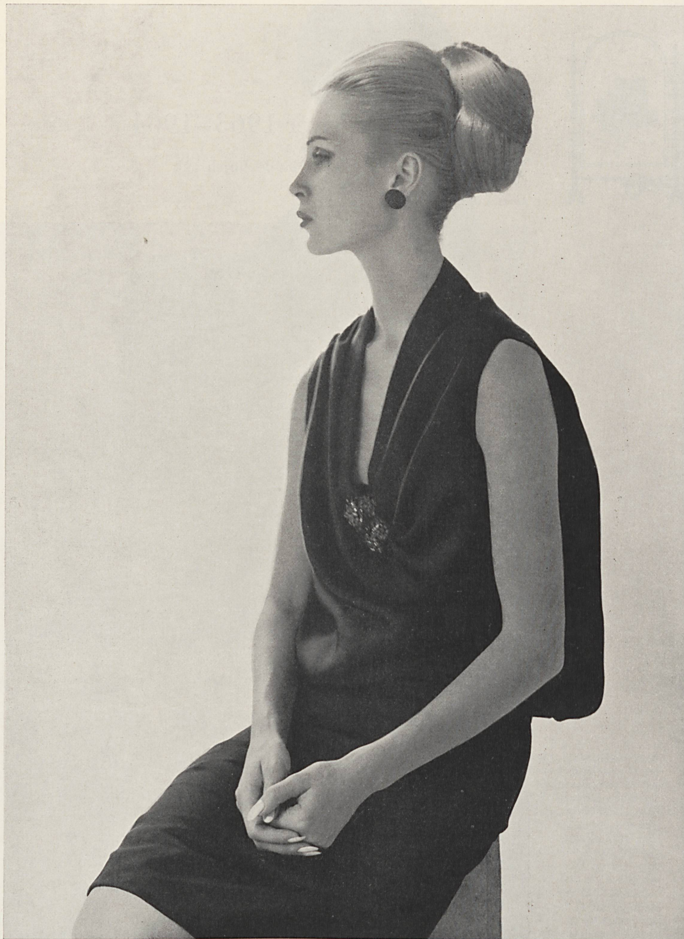
CHRISTIAN DIOR «Satin grenadine» de L. Abraham & Cie, Soieries S.A., Zurich