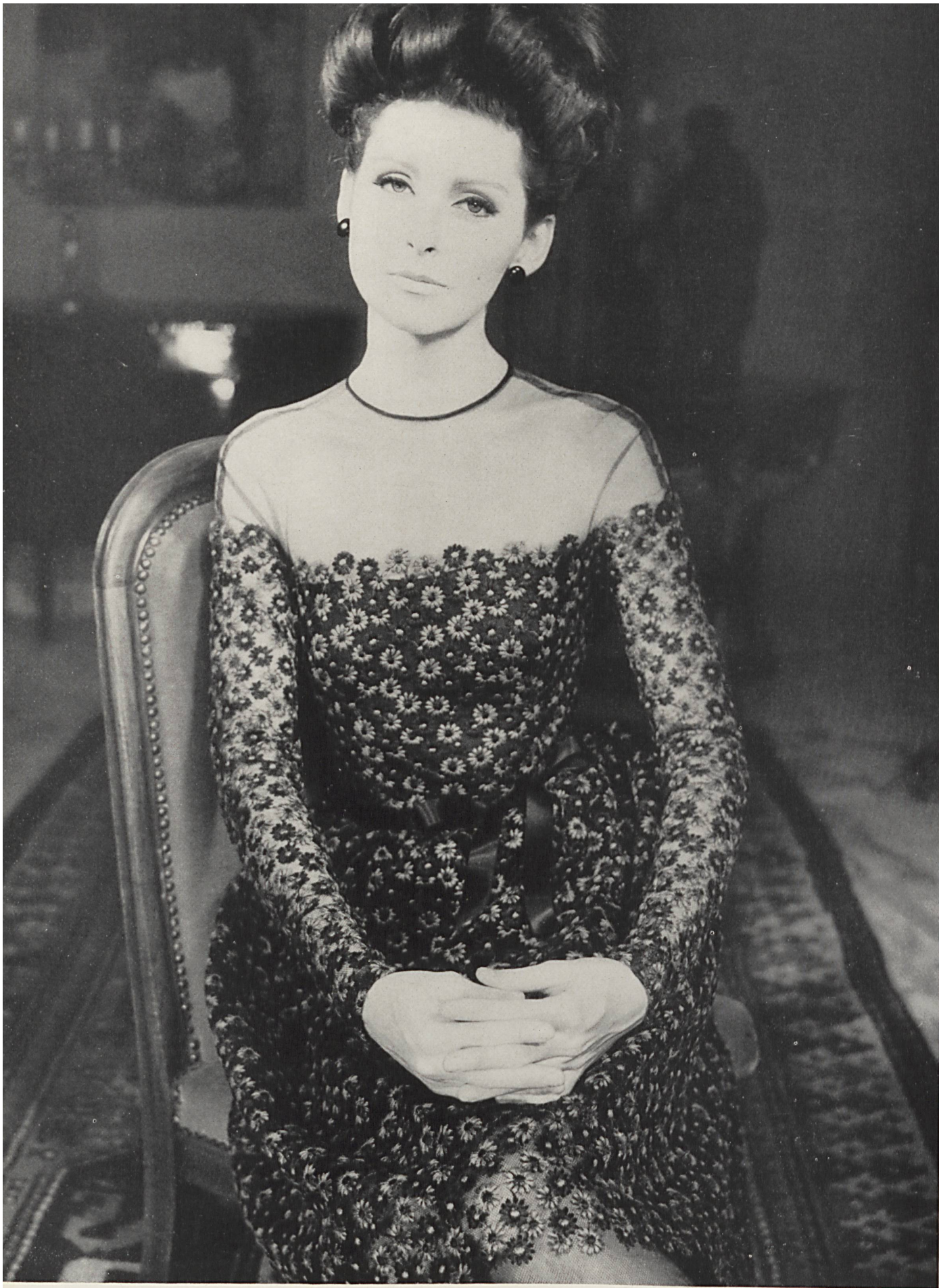
GUY LAROCHE Tulle de Nylon brodé coton de Forster Willi & Cie, Saint-Gall Grossiste à Paris: Robert Burg & Cie