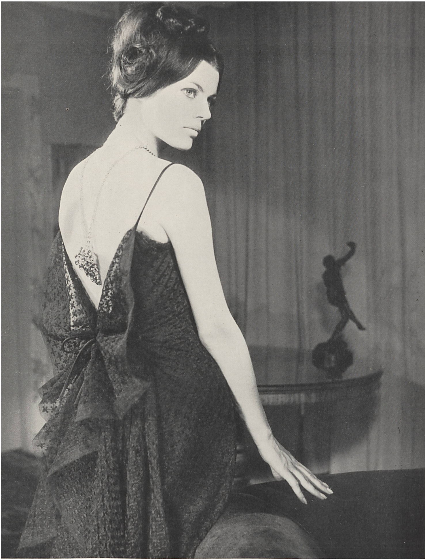
CARVEN Tulle de Nylon, coton brodé de Forster Willi & Co., Saint-Gall Grossiste à Paris: Robert Burg & Cie