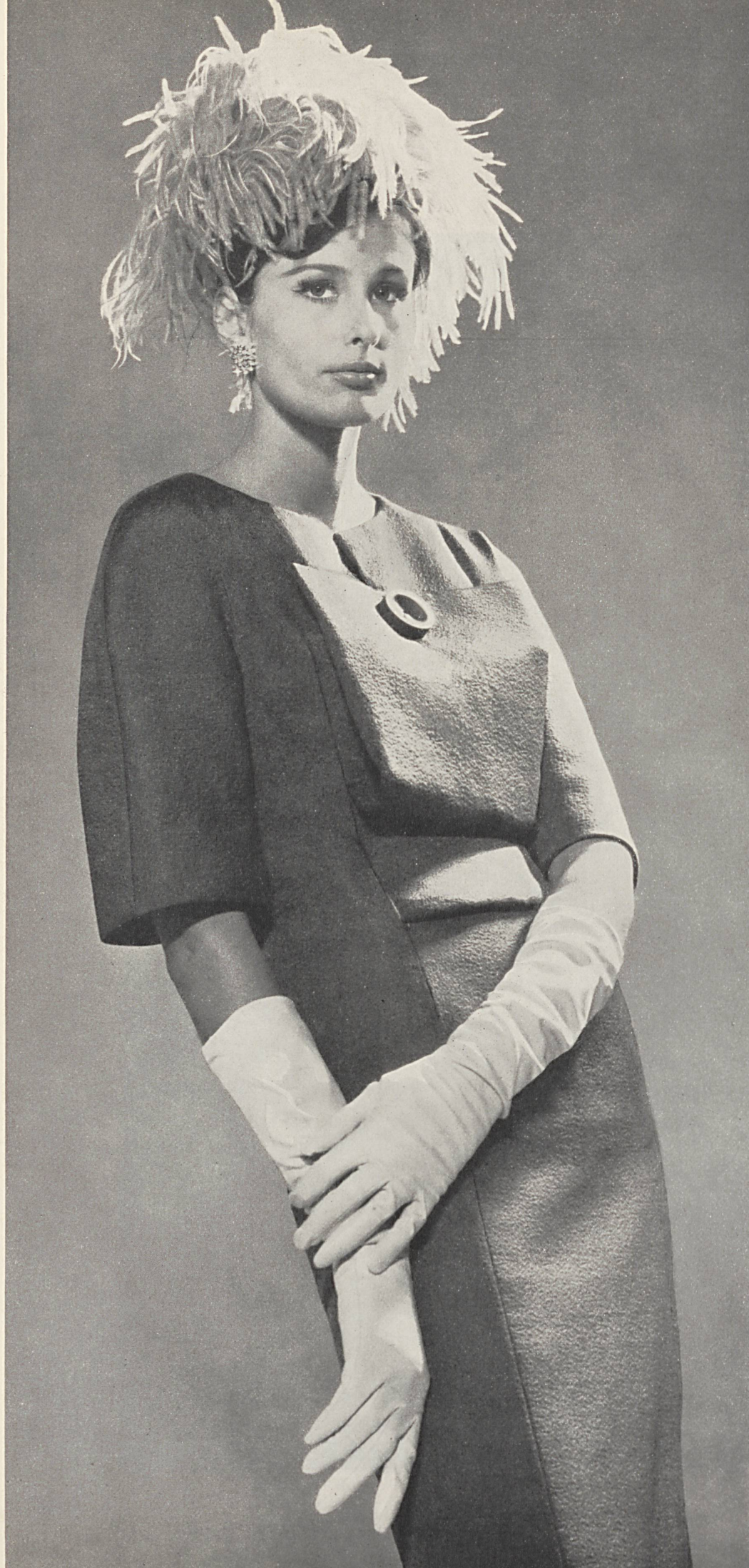
MAGGY ROUFF Satin givré en laine et acétate de Robt. Schwarzenbach & Co., Thalwil