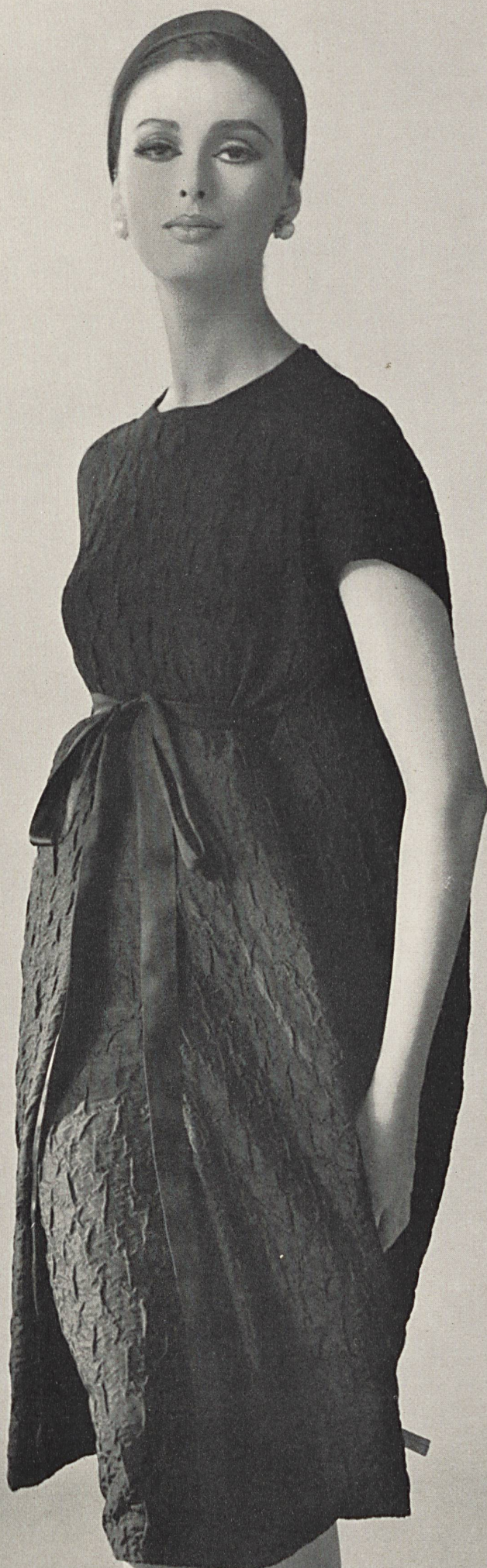
PIERRE BALMAIN Cloqué «Saria» de L. Abraham & Cie, Soieries S.A., Zurich