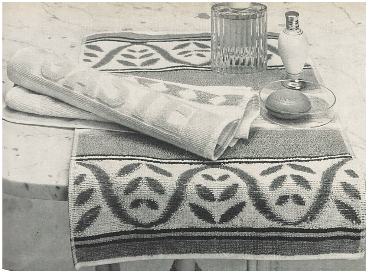
Jeu de linges-éponges en coton pour invités, avec inscription ad hoc en tissage jacquard Set of cotton guest towels, with Jacquard weave lettering Juego de toallas de felpa, de algodón, para los huéspedes, con inscripciones ad hoc en textura jacquard Baumwoll-Frottiertücher-Garnitur für die Gäste, mit entsprechender, eingewobener Jacquard-Aufschrift