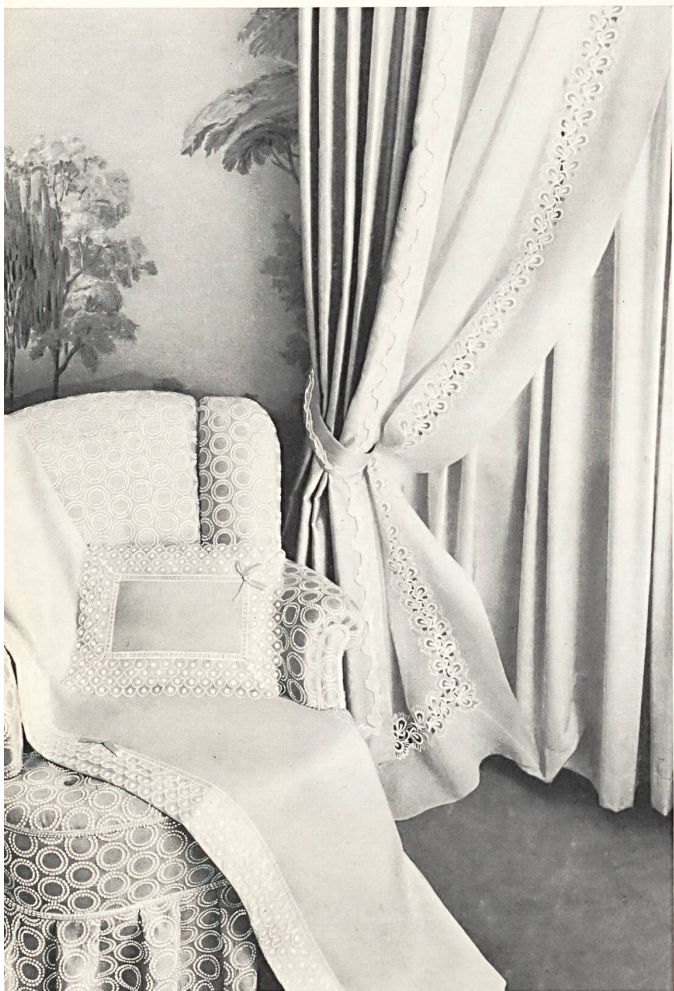
Drap de dessus, appuie-tête et rideaux avec galon brodé incrusté — Top sheet, antimacassar and curtains with embroidered braid insertions — Sábana de encima, almohada y cortinas, con galones bordados incrustados — Oberleintuch, Nackenkissen und Gardinen mit eingesetzten Stickereigalon