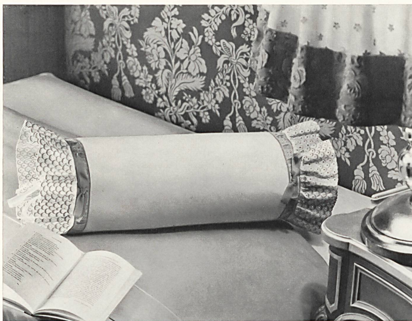
Appuie-tête avec broderie de couleur — Antimacassar with coloured embroidery — Almohadón con bordado en colores — Nackenkissen mit farbiger Stickerei