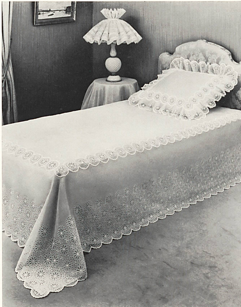
Dessus de lit et coussin d'apparat en broderie anglaise; abat-jour en organdi brodé — Bedspread and decorative cushion in eyelet embroidery; lampshade in embroidered organdie — Cubrecama y almohadón en punto inglés; pantalla de organdí bordada — Bettüberwurf und Zierkissen in Lochstickerei; Lampenschirm aus besticktem Organdi