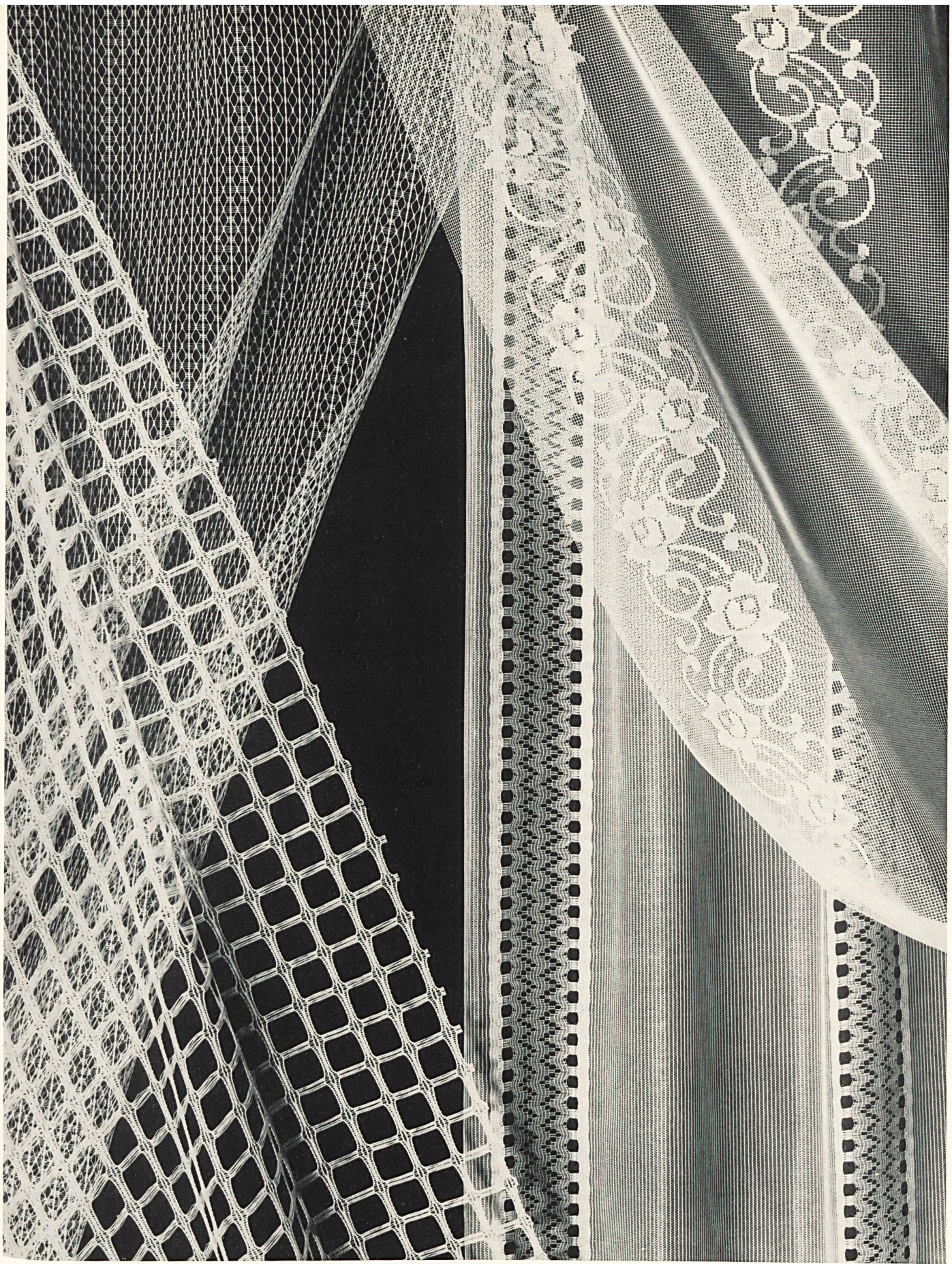
SOCIÉTÉ SUISSE DE L'INDUSTRIE TULLIÈRE S. A., MÜNCHWILEN Rideaux « Muratex » tricotés, 100 % synthétiques — Knitted « Muratex » curtains, 100 % synthetic — Cortinas « Muratex » de malla, 100 % de fibras sintéticas — Voll- synthetische Raschelgardinen Marke « Muratex »