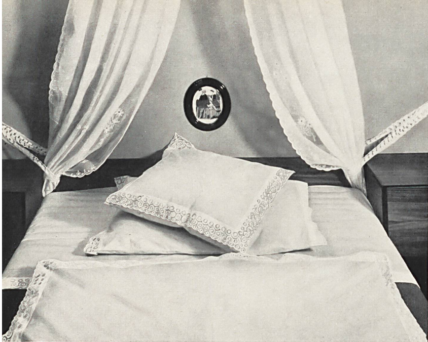
MAX SANDHERR A.G., BERNECK Rideaux en mousseline de coton brodée Curtains in embroidered cotton muslin Cortinas de muselina de algodón bordada Vorhang aus besticktem Baumwoll-Mousseline

Ravissants draps en percale ornés de bordures brodées; se font en nombreux coloris pastel Attractive percale sheets decorated with embroidered bands; available in many pastel shades Encantadores sábanas de percal, adornadas con cenefas bordadas: se las hace en muchos colores pastel Reizende Bettwäsche aus Percale mit Stickereibordüren verziert, in vielen Pasteltönen erhältlich