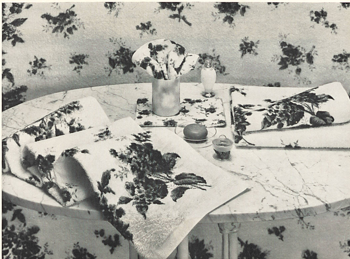
Un cadeau toujours apprécié ! Jeu complet de linges-éponges: tapis de bain, serviette, gant de toilette, serviette pour invités, etc. An ever popular gift ! A complete set of towels: bath-mat, towel, face-cloth globe, guest towel, etc. ¡ Un regalo siempre muy apreciado ! Juego completo de toallas de felpa: alfombra de baño, toalla, guante de baño, toallas para los huéspedes, etc. Ein netter Geschenkartikel ! Komplette Baumwoll-Frottiertücher-Garnitur mit Badematte, Handtuch, Gästetuch, Waschlappen und Waschhandschuh