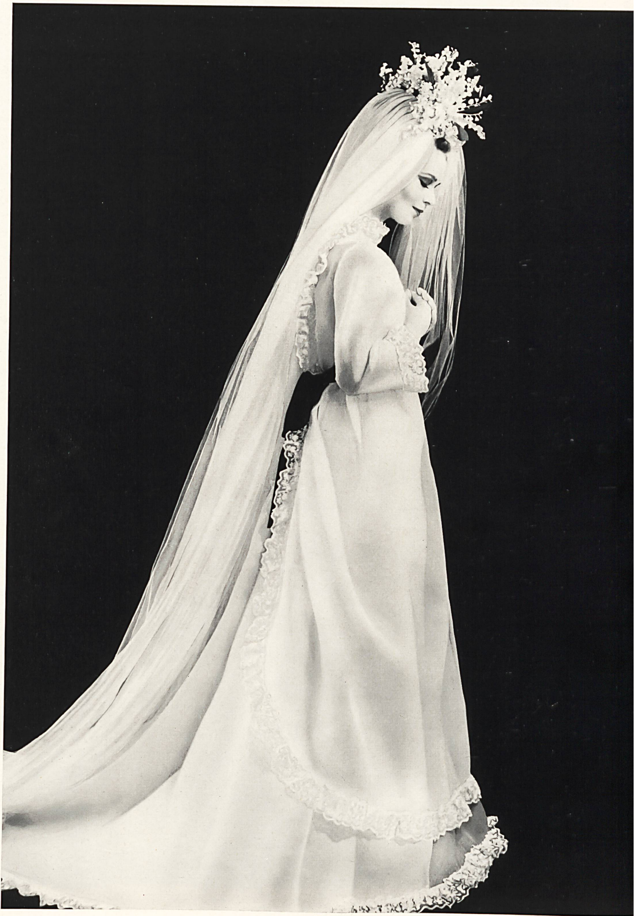
YVES SAINT-LAURENT Galons de broderie blanche et motifs superposés de Union S. A., Saint-Gall