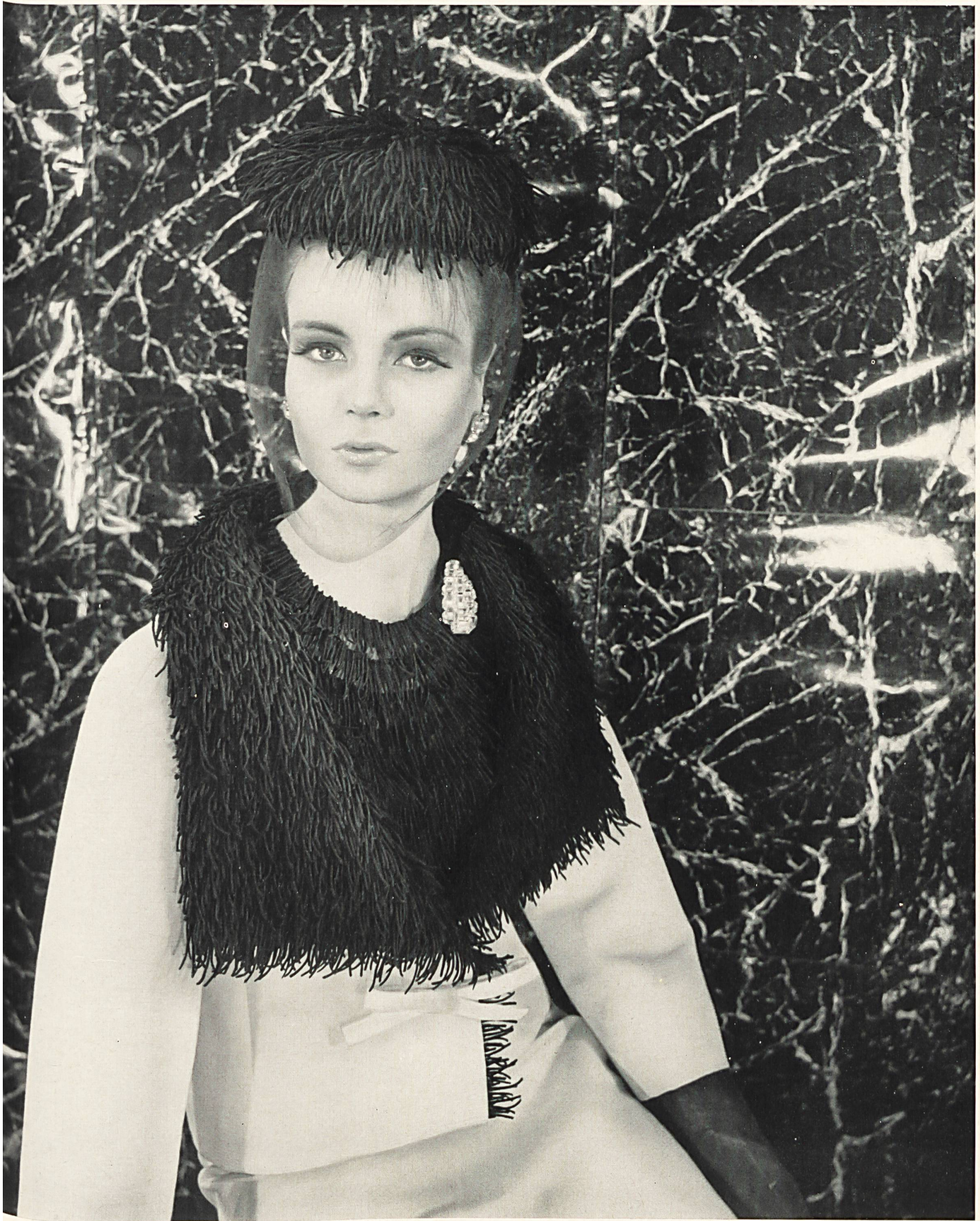
CHRISTIAN DIOR Franges de guipure de A. Naef & Cie S. A., Flawil / Saint-Gall