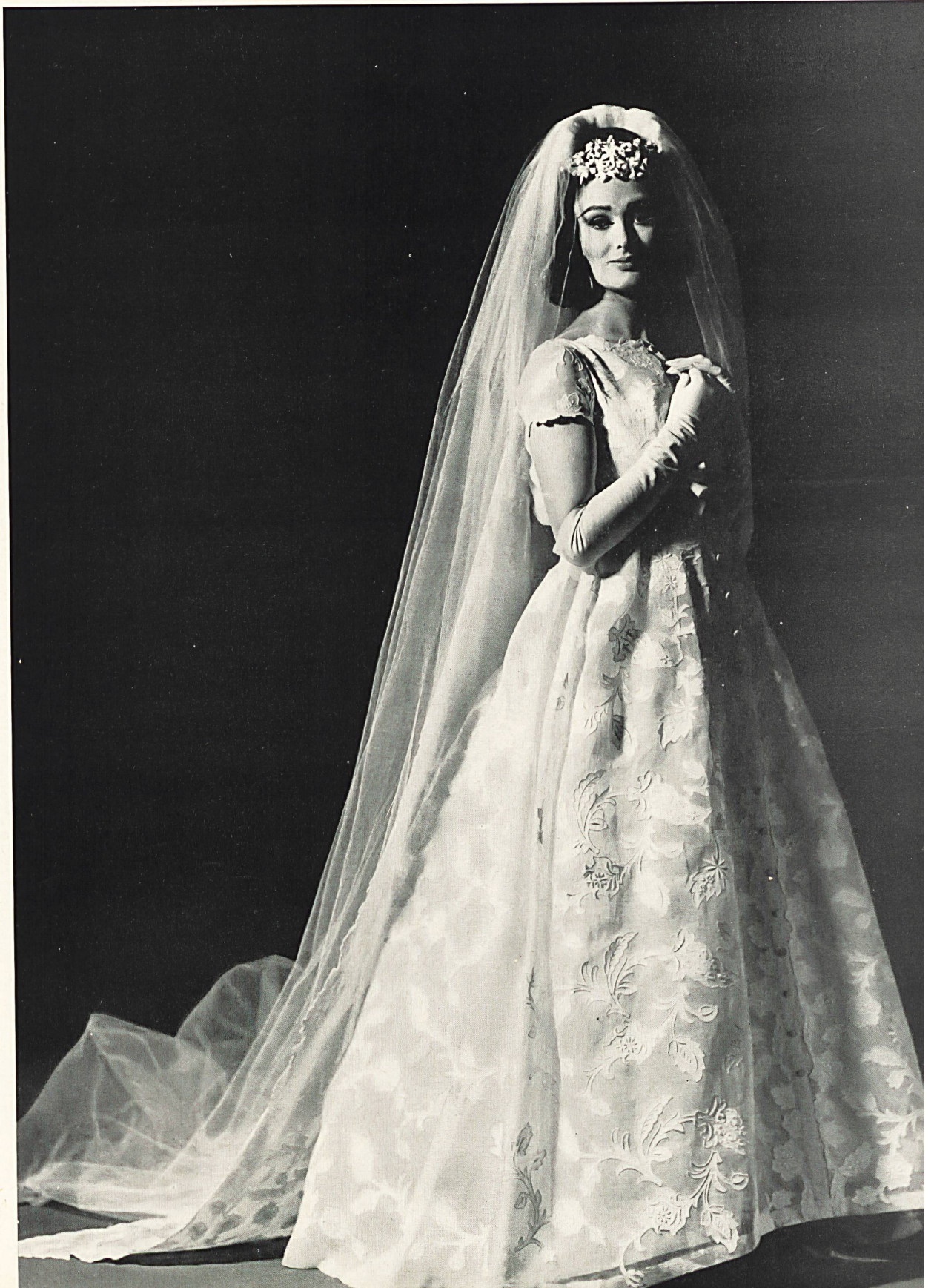
PIERRE BALMAIN Bordure d'organdi avec application de linola de Forster Willi & Co., Saint-Gall

MODÈLES EXCLUSIFS — REPRODUCTION INTERDITE