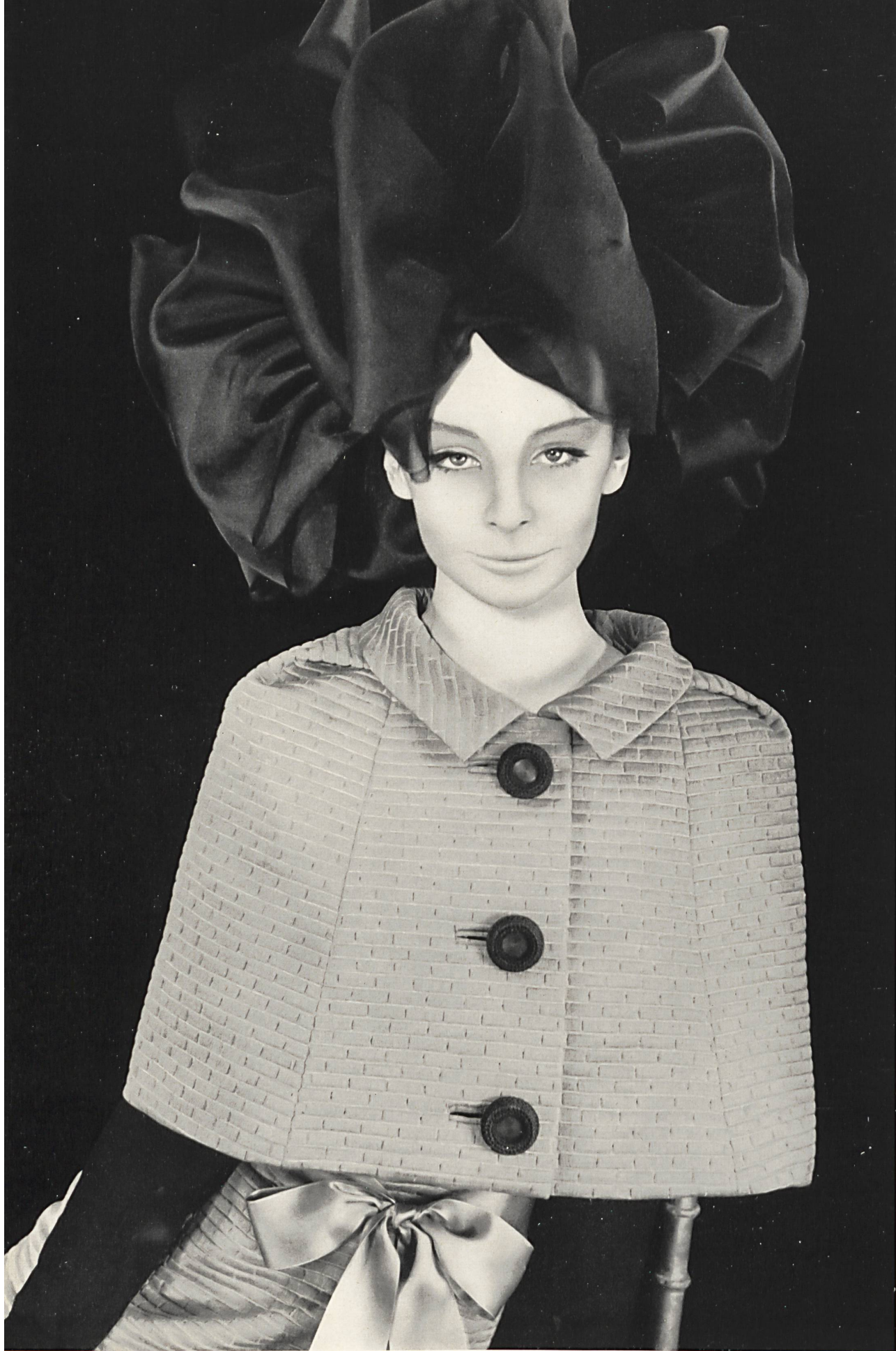
COURREGES Broderie épaisse en coton de Walter Schrank & Co. S. A., Saint-Gall Grossiste à Paris : Robert Burg & Cie