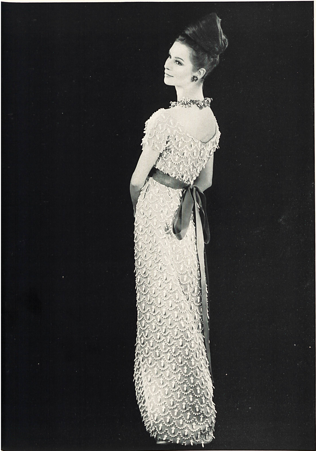
YVES SAINT-LAURENT Volant d'organdi avec guipure superposée de Forster Willi & Co., Saint-Gall