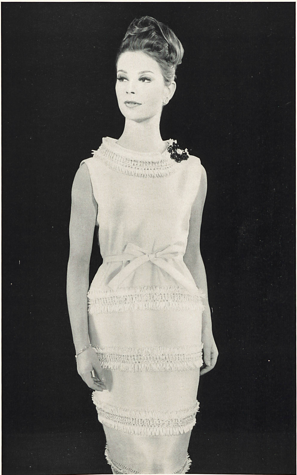
YVES SAINT-LAURENT Franges de broderie chimique de Rau S. A., Saint-Gall