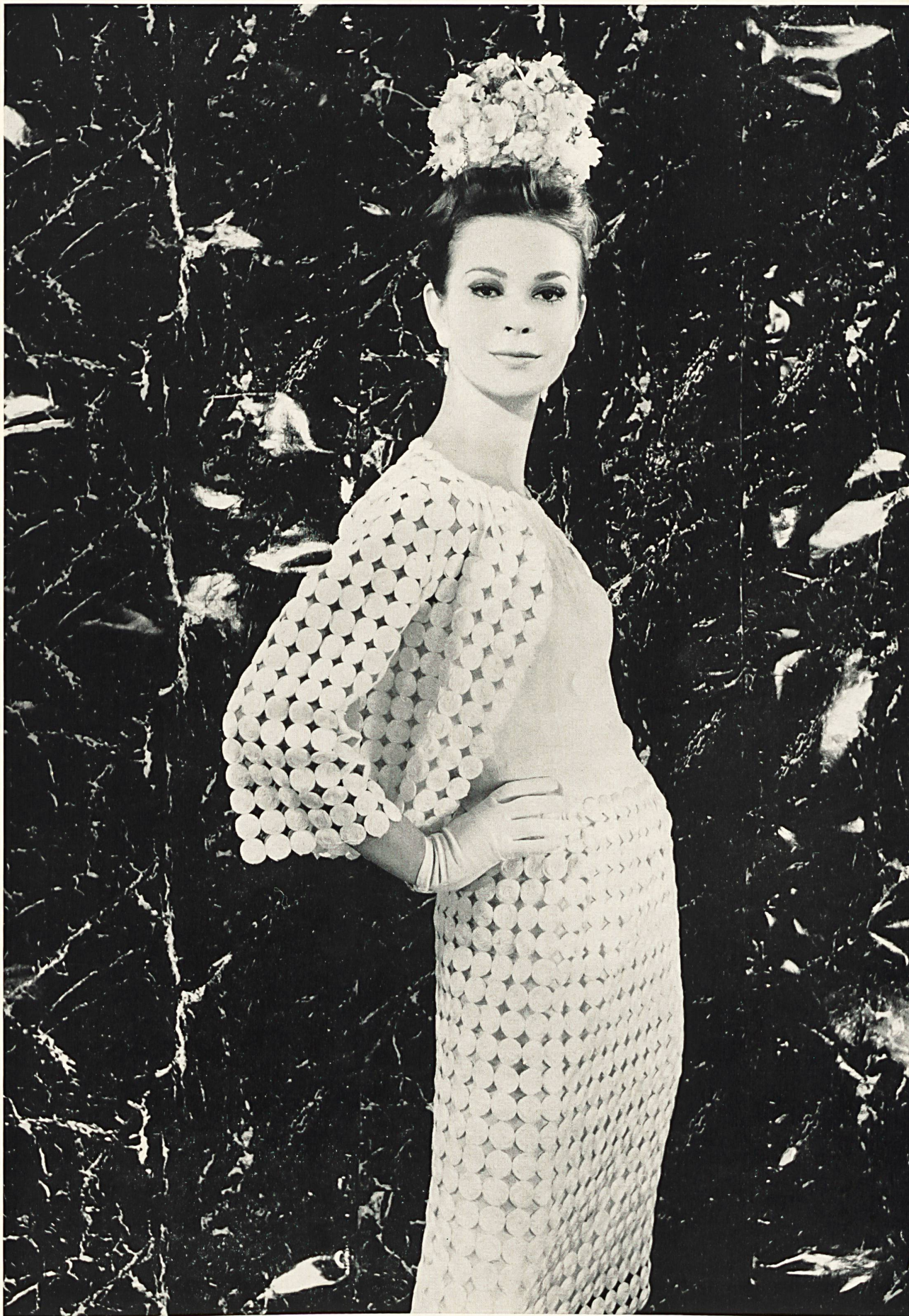
GUY LAROCHE Organdi transparent et dentelle de guipure classique en rondelles de Jacob Rohner S. A., Rebstein / Saint-Gall Grossiste à Paris : Robert Burg & Cie