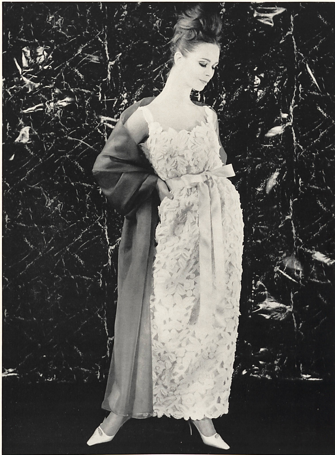
GUY LAROCHE Riche dentelle de guipure ficelle de Jacob Rohner S. A., Rebstein / Saint-Gall Grossiste à Paris : Robert Burg & Cie