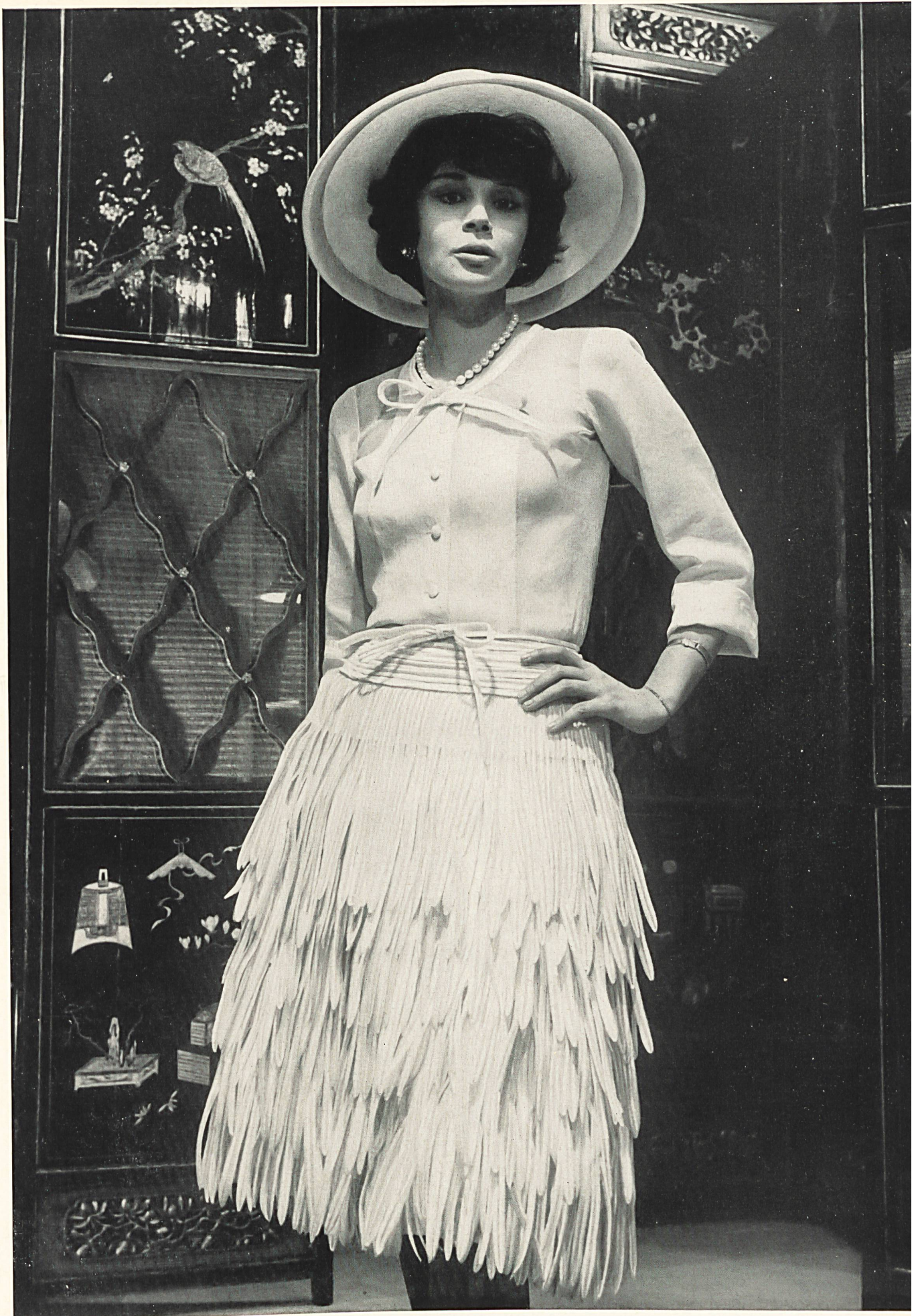
CHANEL Franges brodées de Forster Willi & Co., Saint-Gall Grossiste à Paris : Les Tisseurs B de M