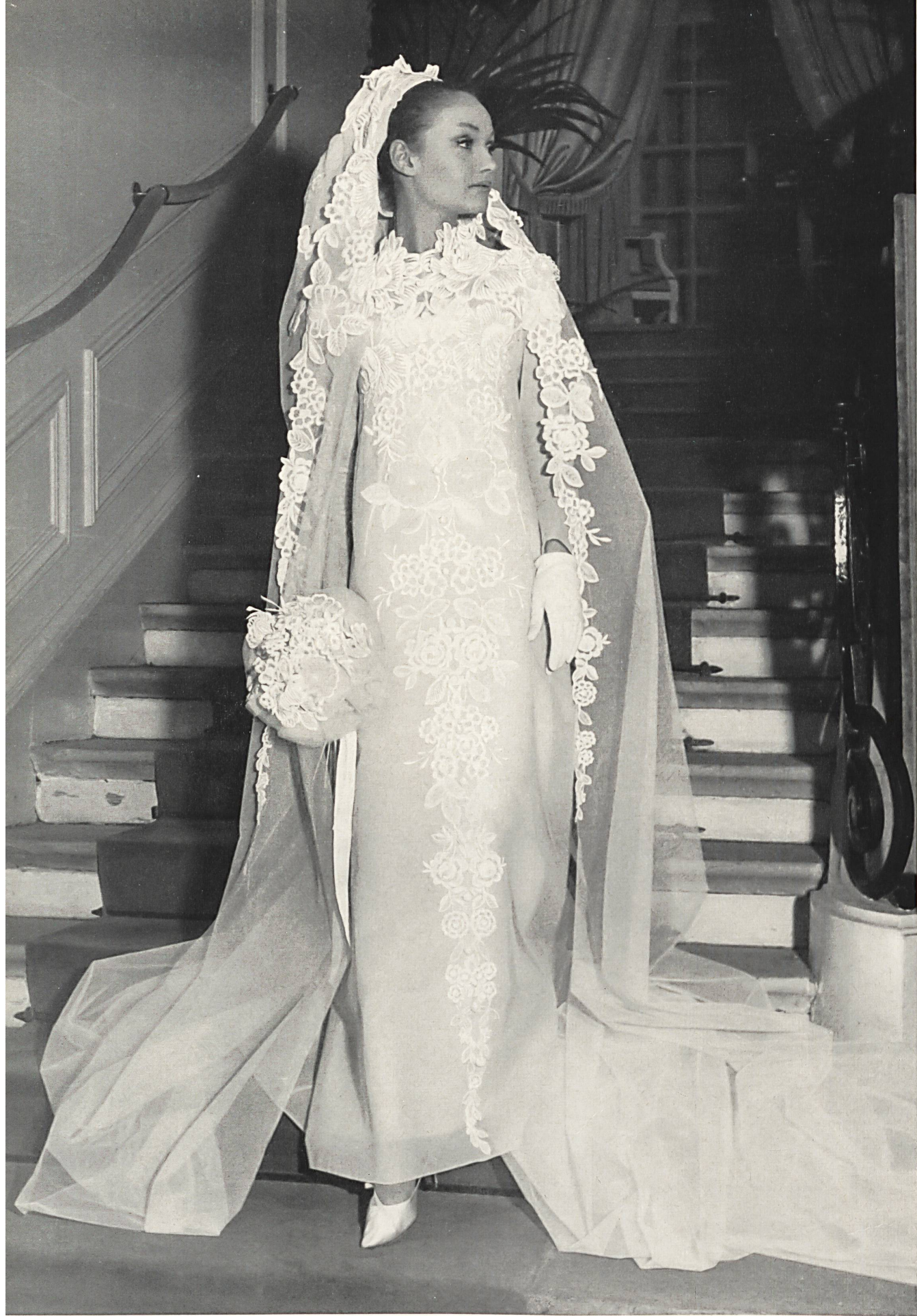
CHRISTIAN DIOR Tulle brodé avec fleurs détachées de A. Naef & Cie S. A., Flawil/Saint-Gall