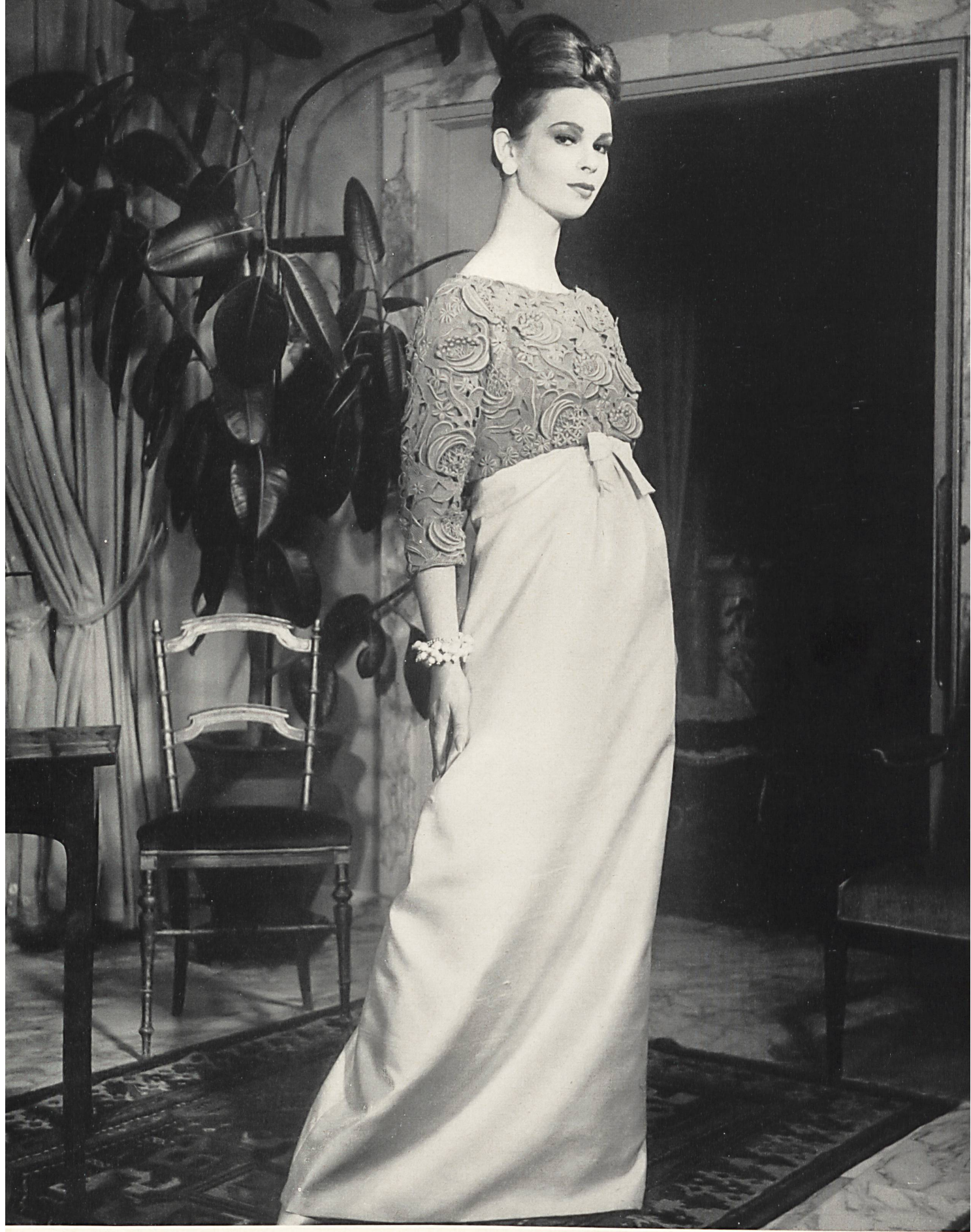
FERRERAS Dentelle de guipure riche de Forster Willi & Co., Saint-Gall Grossiste à Paris : Robert Burg & Cie