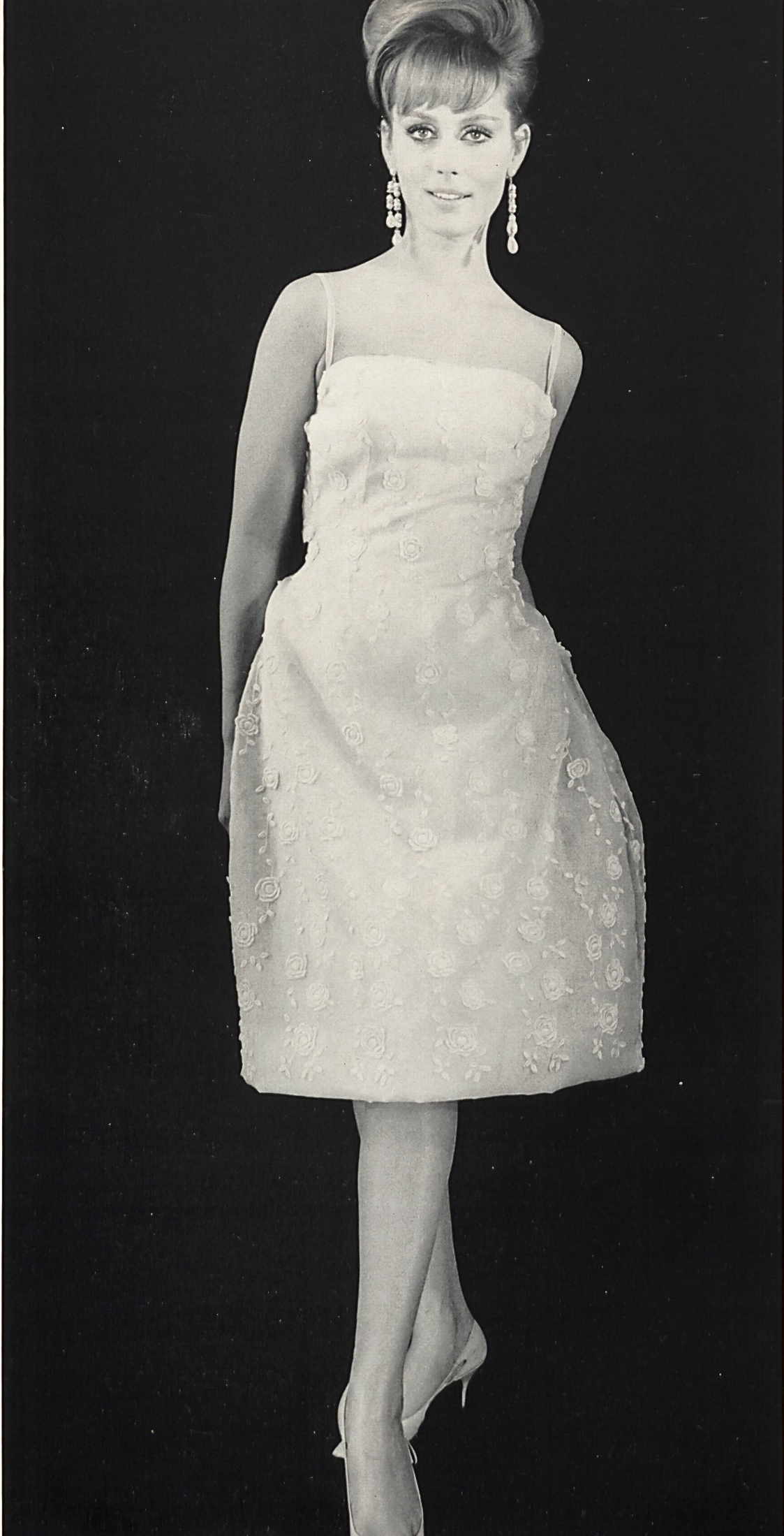
CARVEN Broderie superposée sur organdi de soie de Walter Stark, Saint-Gall Grossiste à Paris : Robert Burg & Cie