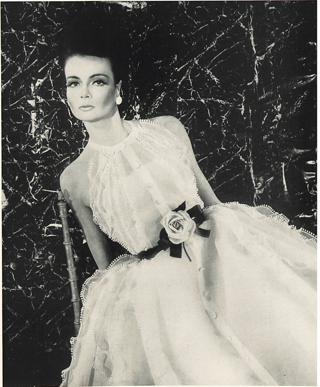
CHRISTIAN DIOR Galons de guipure et broderies sur organdi blanc de Union S. A., Saint-Gall