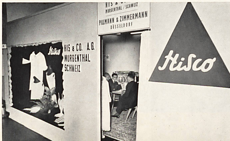
Vue du stand de la maison The stand of El vista del « stand » de la casa Der Stand der Firma HIS & CIE S. A., MURGENTHAL