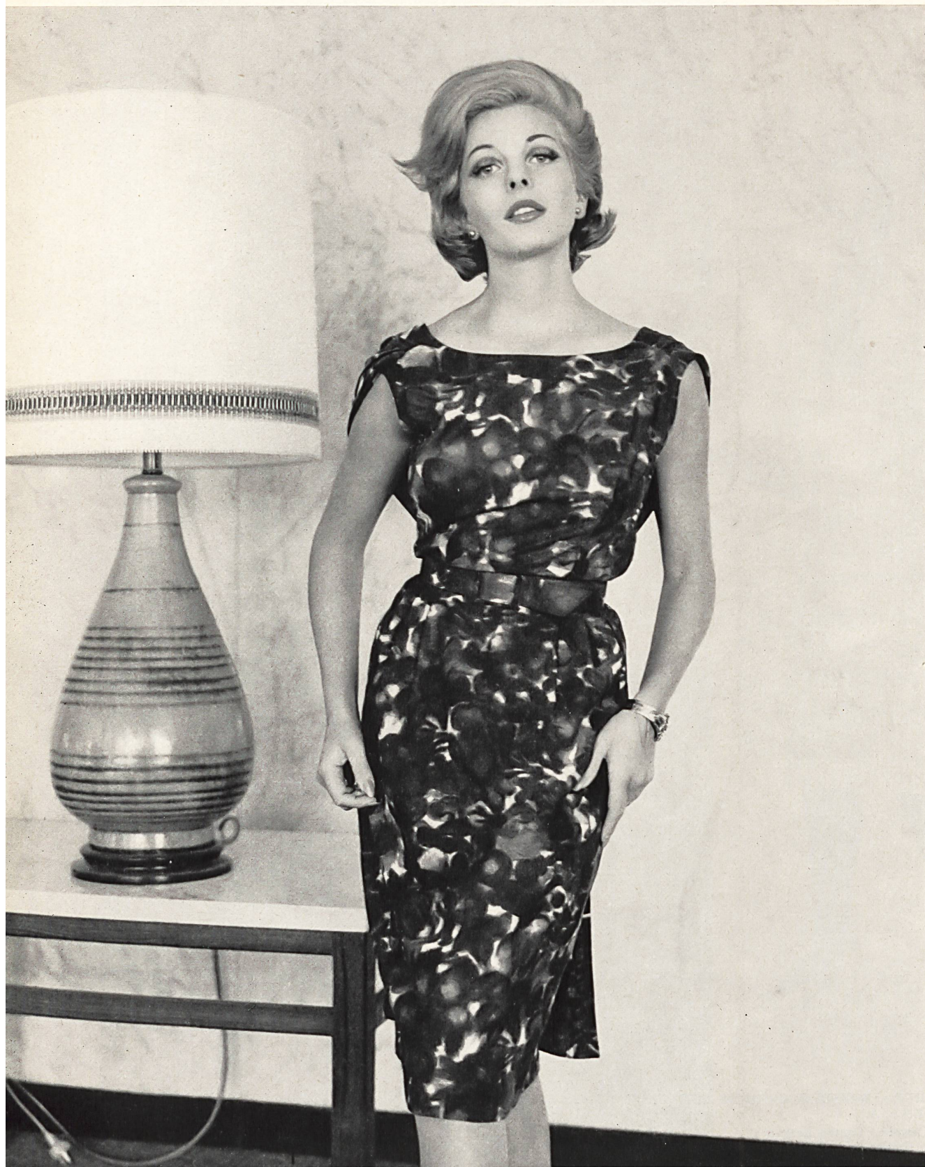
BÉGÉ S. A., ZURICH Tissu / Fabric « bégé-Atlantic » Modèle Sharene, Melbourne