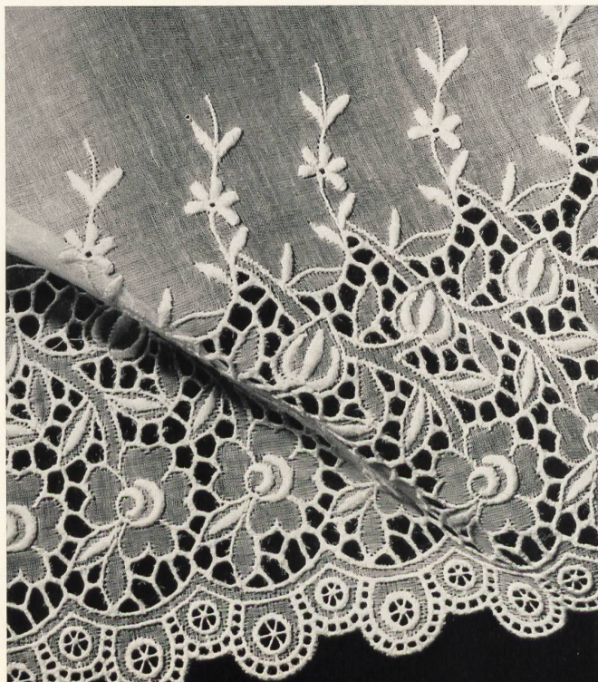
EISENHUT & CO., GAIS Organdi brodé Embroidered organdy Organdi bordado Bestickter Organdy Modèle Sam Landorf & Co., New York