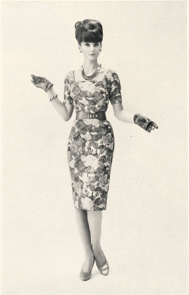
METTLER & CIE S.A., SAINT-GALL Brocart de coton Cotton brocade Modèle Wilson Folmar pour Edward Abbott Bijoux de / Jewellery by Cartier, New York