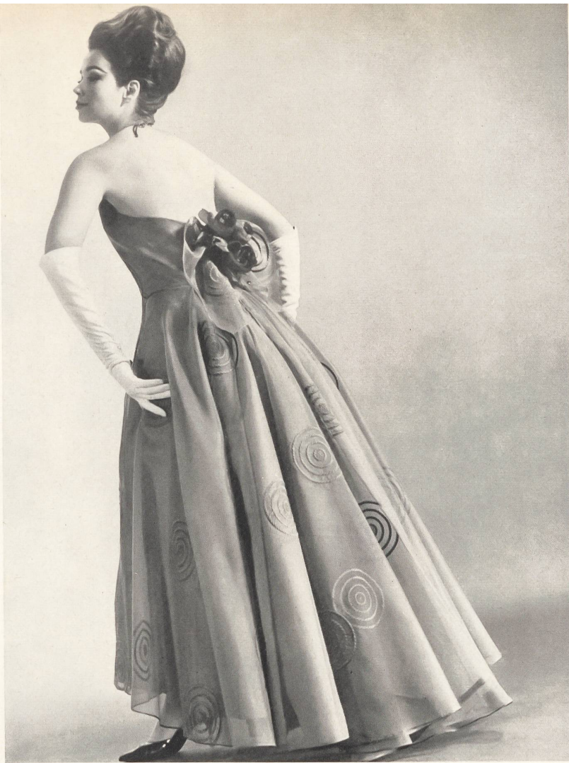
NEUBURGER & CO. S.A., SAINT-GALL Organdi de soie brodé Embroidered silk organdy Organdi de seda bordado Bestickter Seidenorgandy Modèle Rose Bertin, Zurich