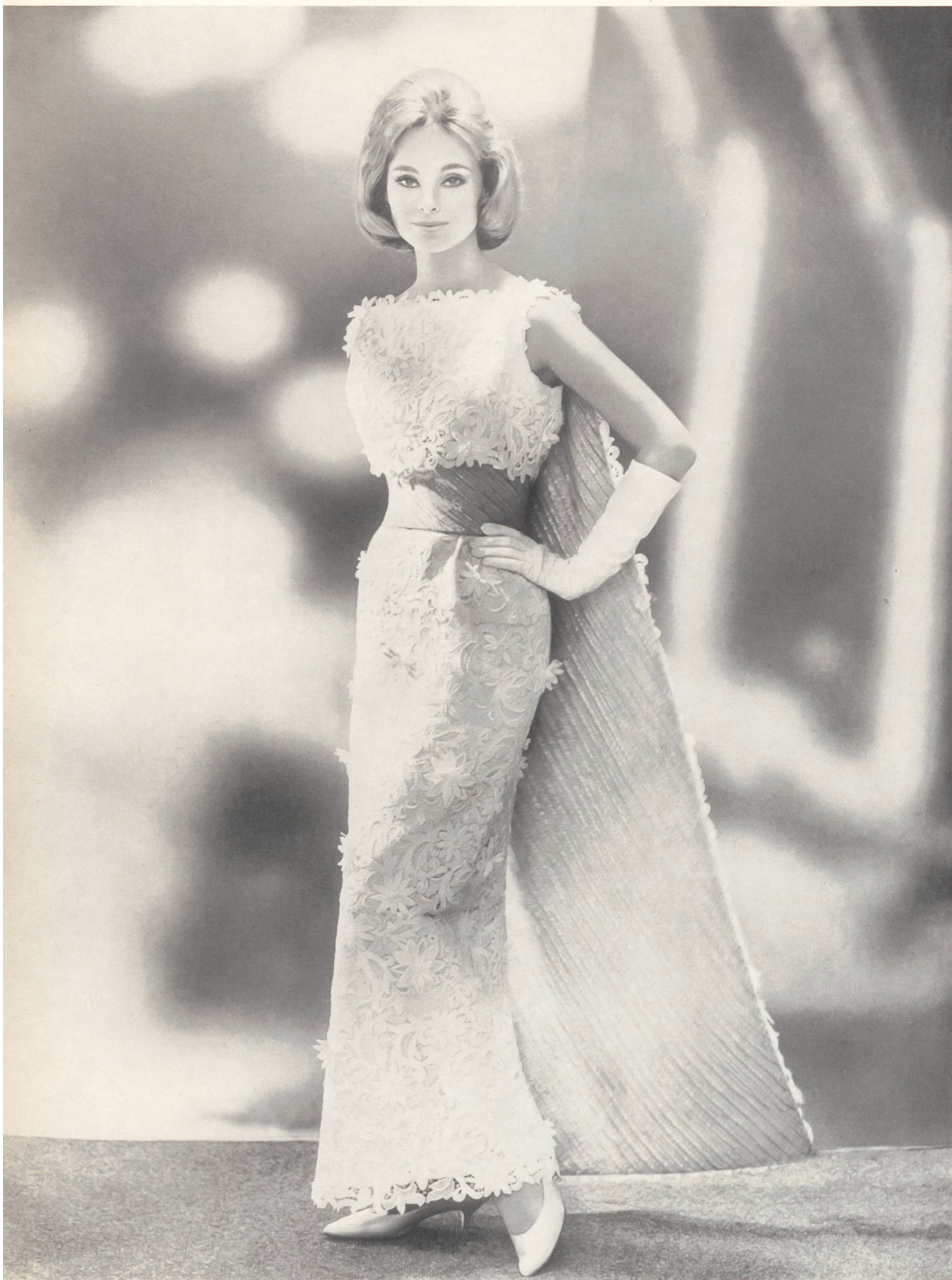
NEUBURGER & CO. S.A., SAINT-GALL Guipure avec applications Appliqué guipure lace Bordado de guipur con aplicaciones Guipurestickerei mit Applikationen Modèle Marianne Enz Couture, Saint-Gall