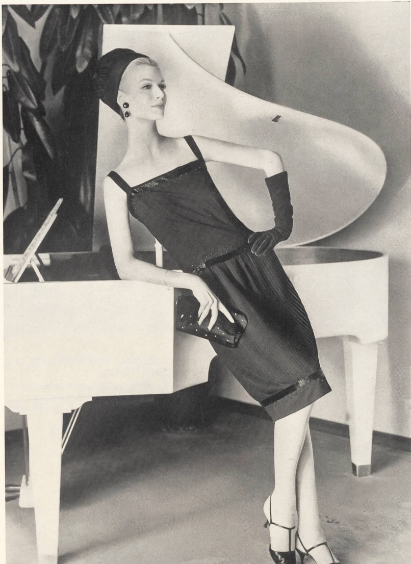
HEER & CIE S.A., THALWIL Crêpe « Derby » Modèle Willy Meyer S.A., Zurich