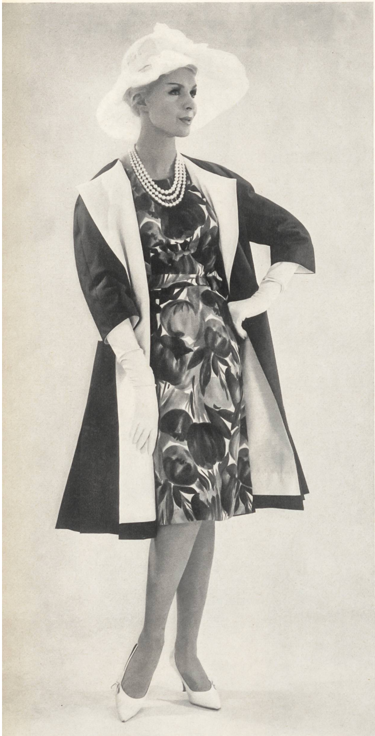
« RECO », REICHENBACH & CO., SAINT-GALL

Pure soie imprimée (robe) Pure printed silk (dress) Pura seda estampada (vestido) Reine Seide, bedruckt (Kleid) Modèle Amy Couture, Bâle