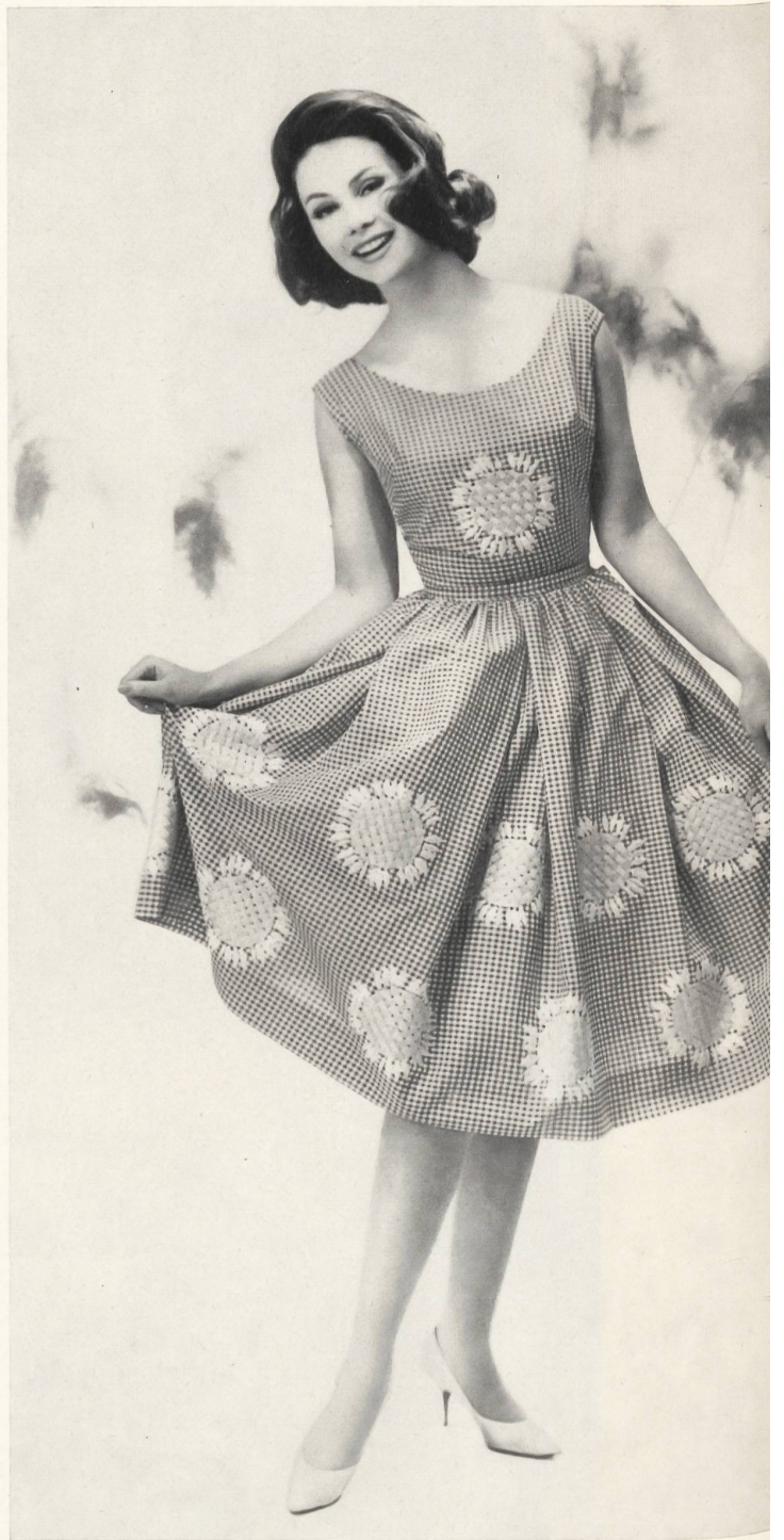
« RECO », REICHENBACH & CO., SAINT-GALL

Pure soie imprimée (robe) Pure printed silk (dress) Pura seda estampada (vestido) Reine Seide, bedruckt (Kleid) Modèle Amy Couture, Bâle