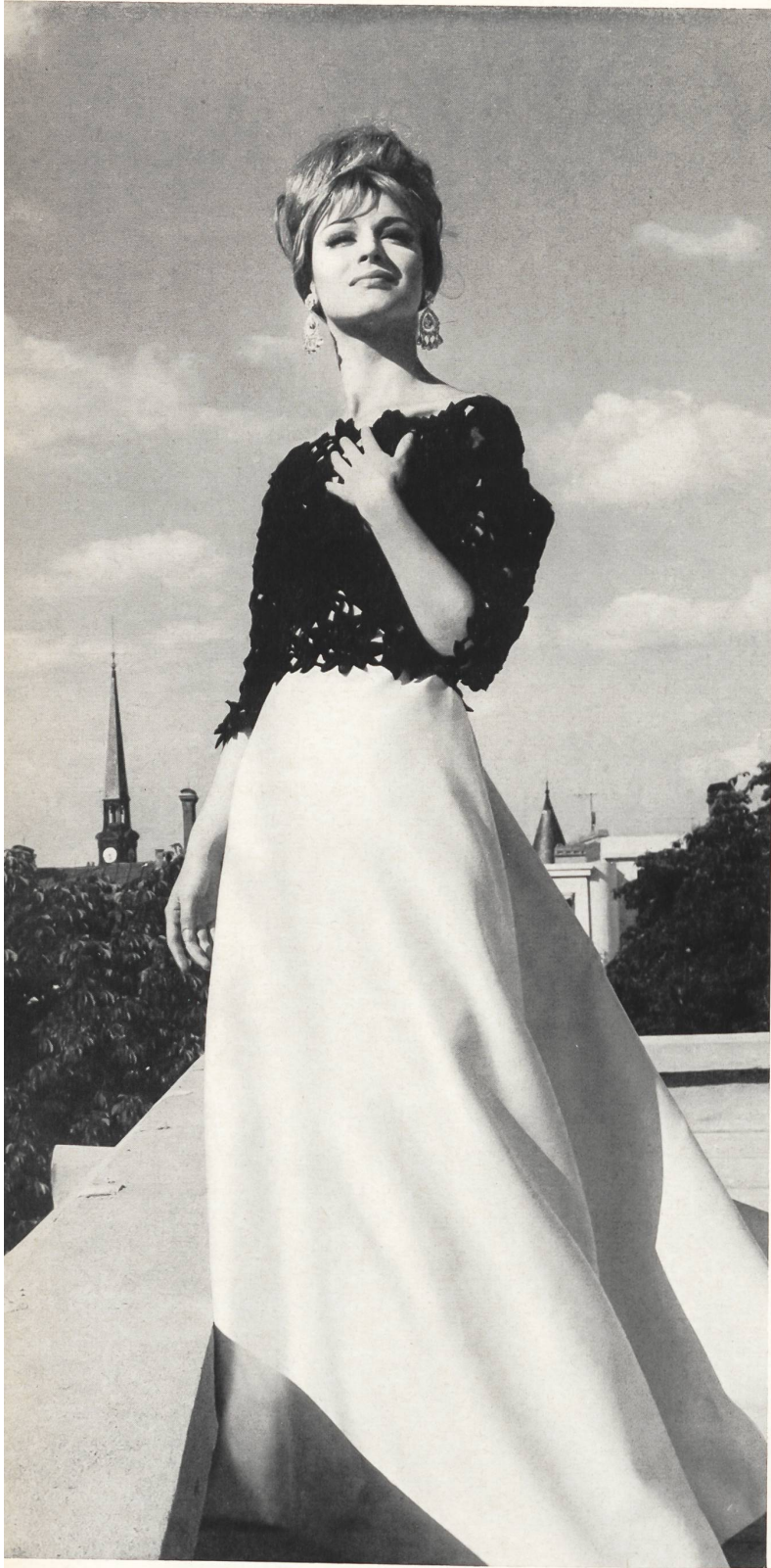
MAGGY ROUFF Broderie sur velours découpé « Nelo » de J.G. Nef & Co. S.A., Herisau Grossiste à Paris: Robert Burg & Cie