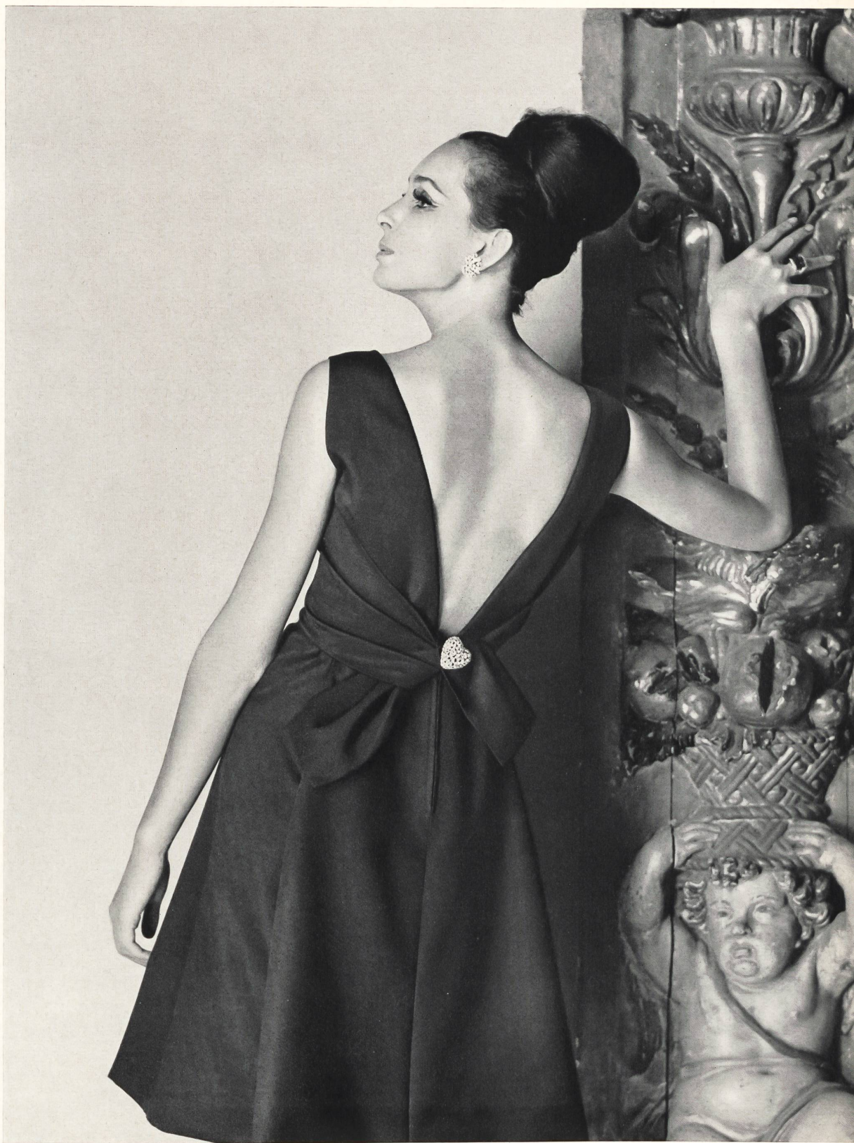
MAGGY ROUFF Pure soie « Victoria » de Robt Schwarzenbach & Cie, Thalwil