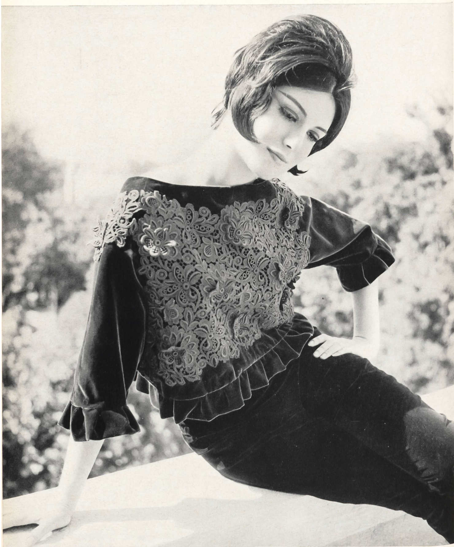
BERNARD SAGARDOY Guipure avec application de fleurs en guipure de Rau S. A., Saint-Gall Grossiste à Paris: Robert Burg & Cie