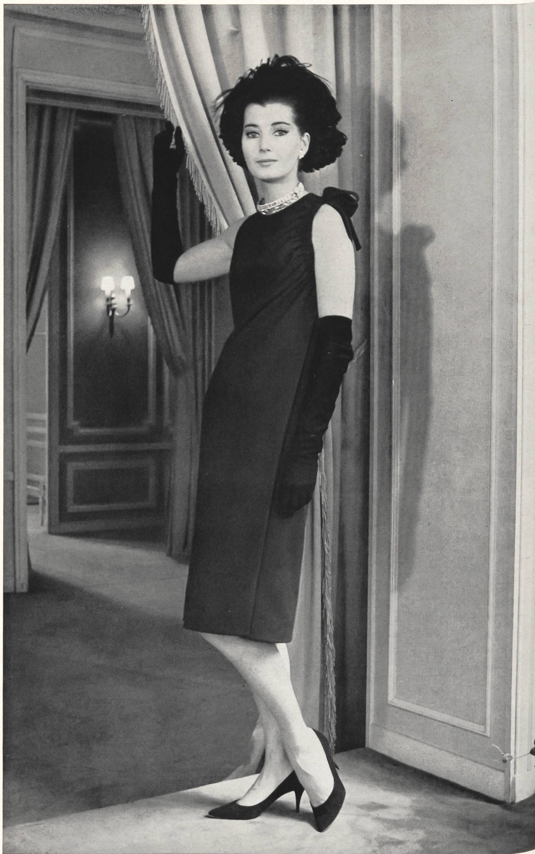
CHRISTIAN DIOR Crêpe de la S. A. Stünzi Fils, Horgen