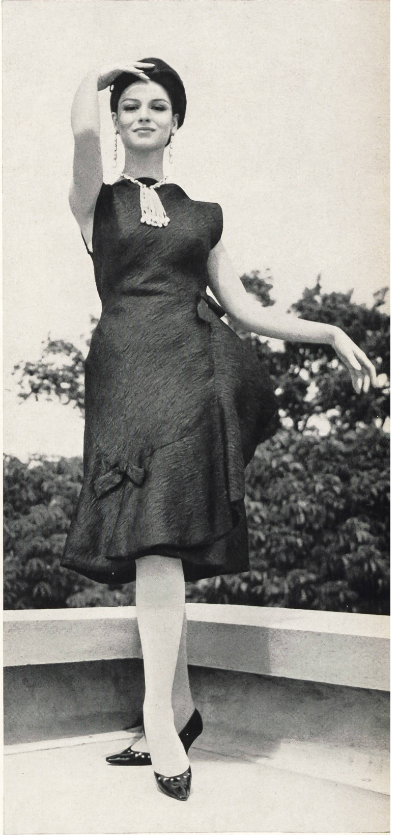
CARVEN Façonné cloqué tout soie des Soieries Stehli S. A., Zurich