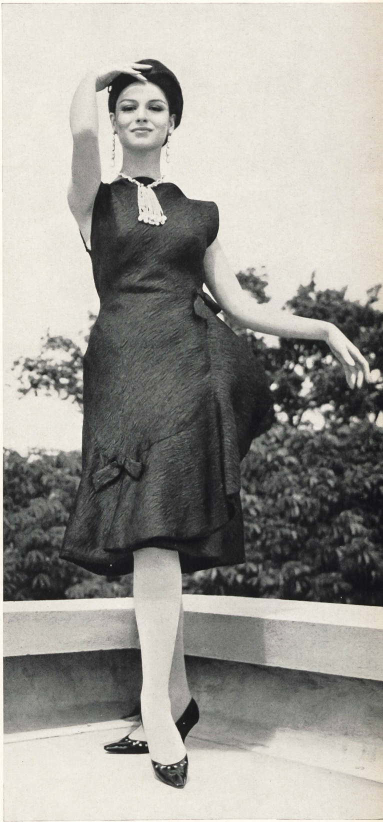
CARVEN Façonné cloqué tout soie des Soieries Stehli S. A., Zurich