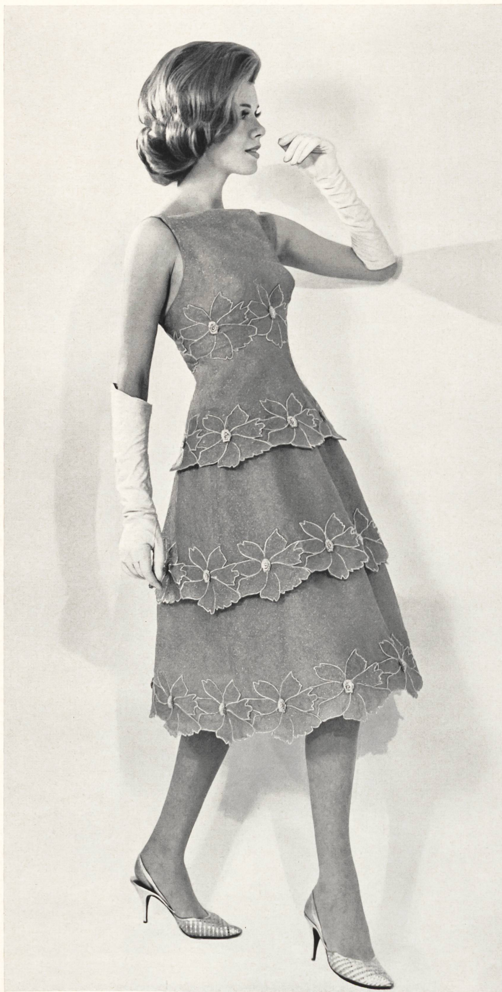
JEAN DESSES Broderie métal de Forster Willi & Co., Saint-Gall Grossiste à Paris: Les Tisseurs B de M