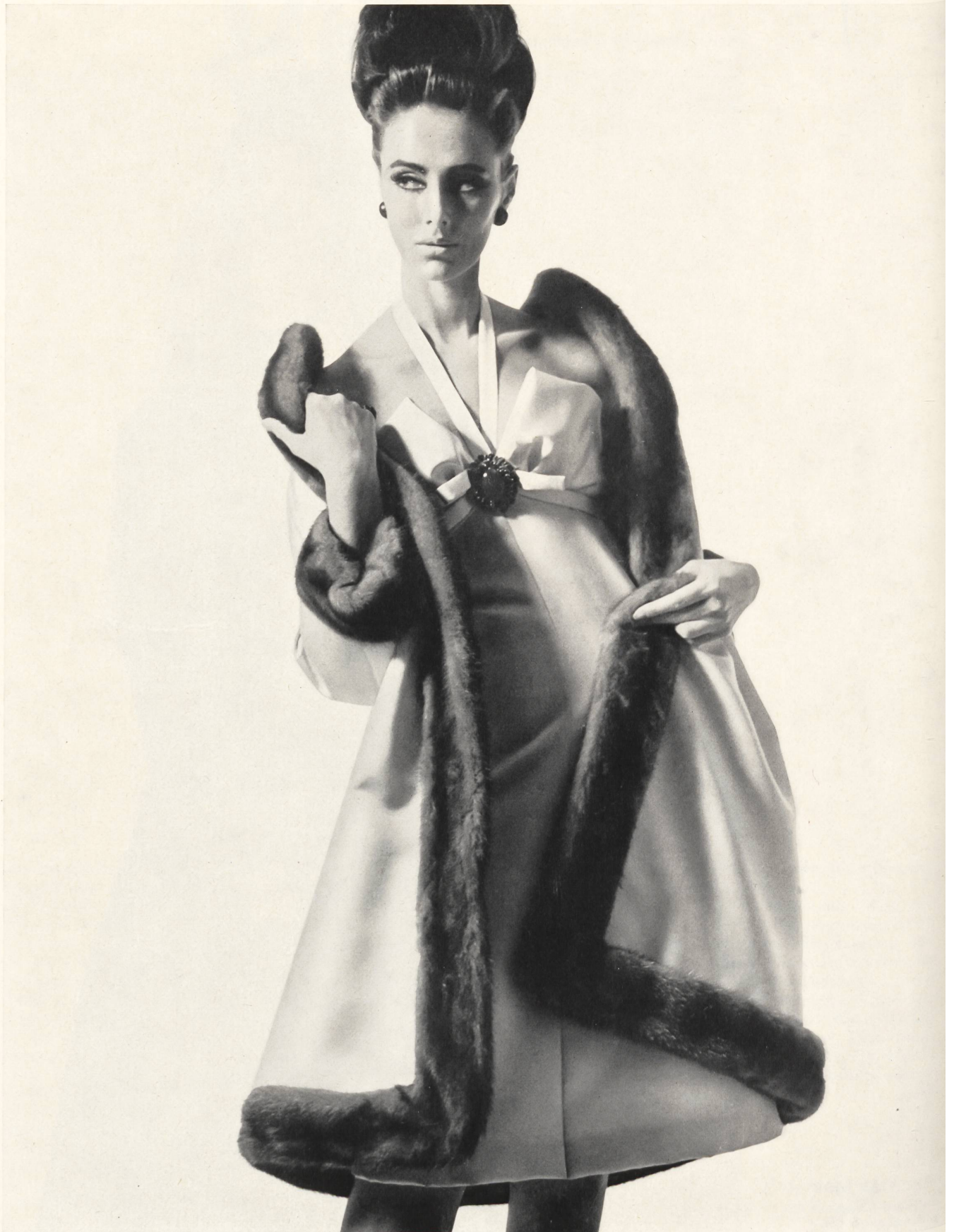
CHRISTIAN DIOR Satin double face de L. Abraham & Cie, Soieries S. A., Zurich