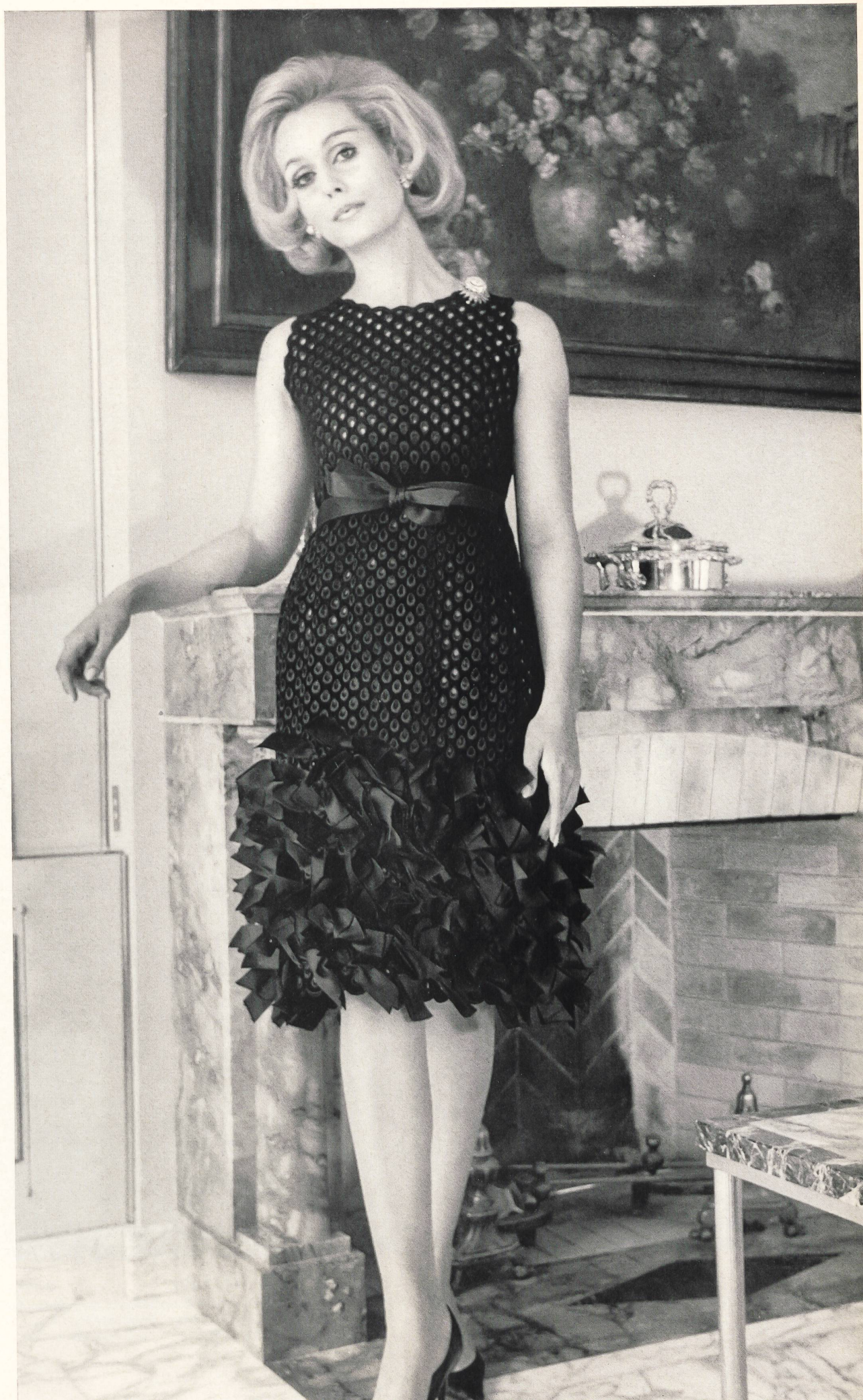
CHRISTIAN DIOR Velours de coton noir avec broderie anglaise de Union S. A., Saint-Gall