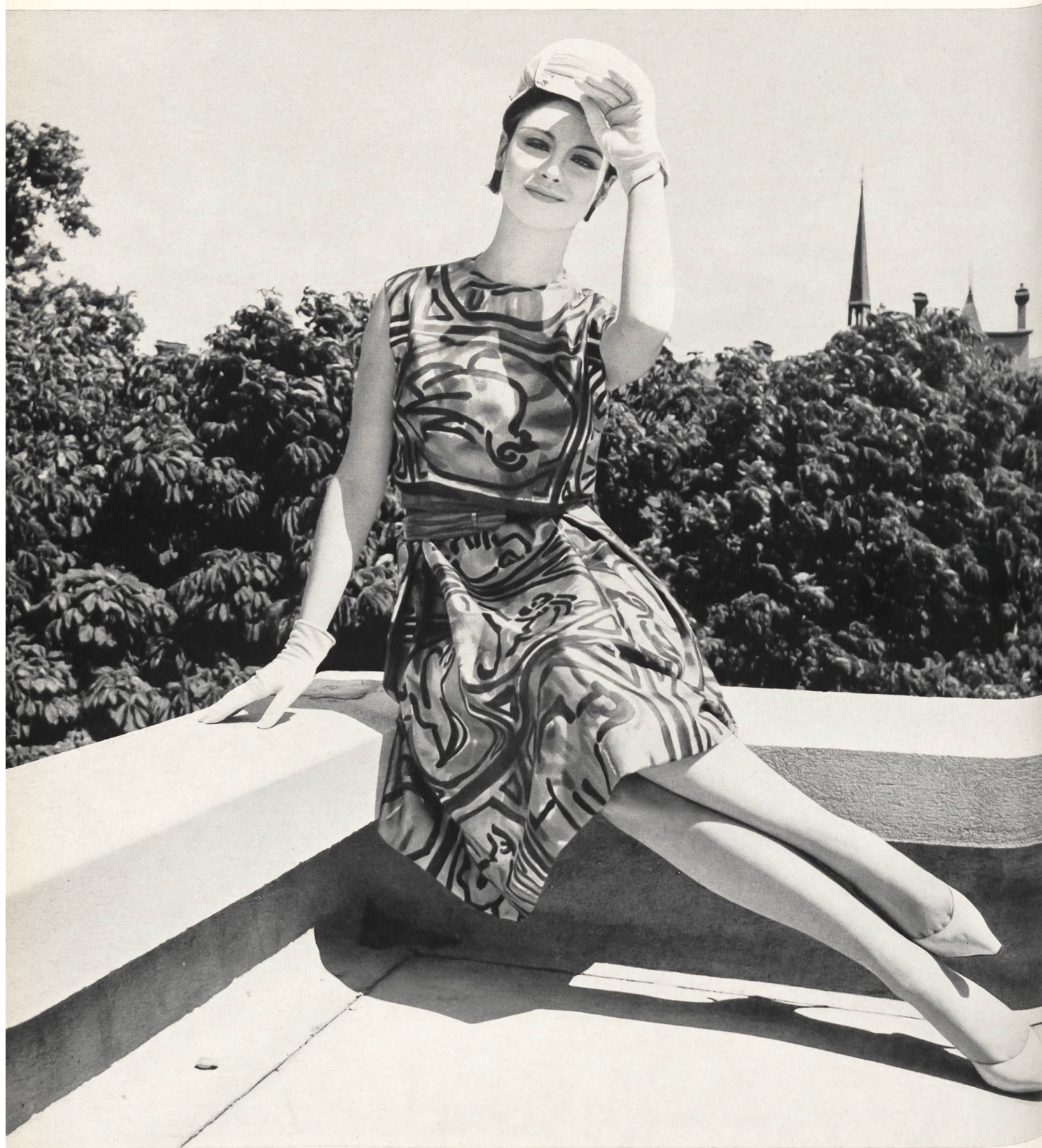
CARVEN « Malibran » imprimé des Soieries Stehli S. A., Zurich