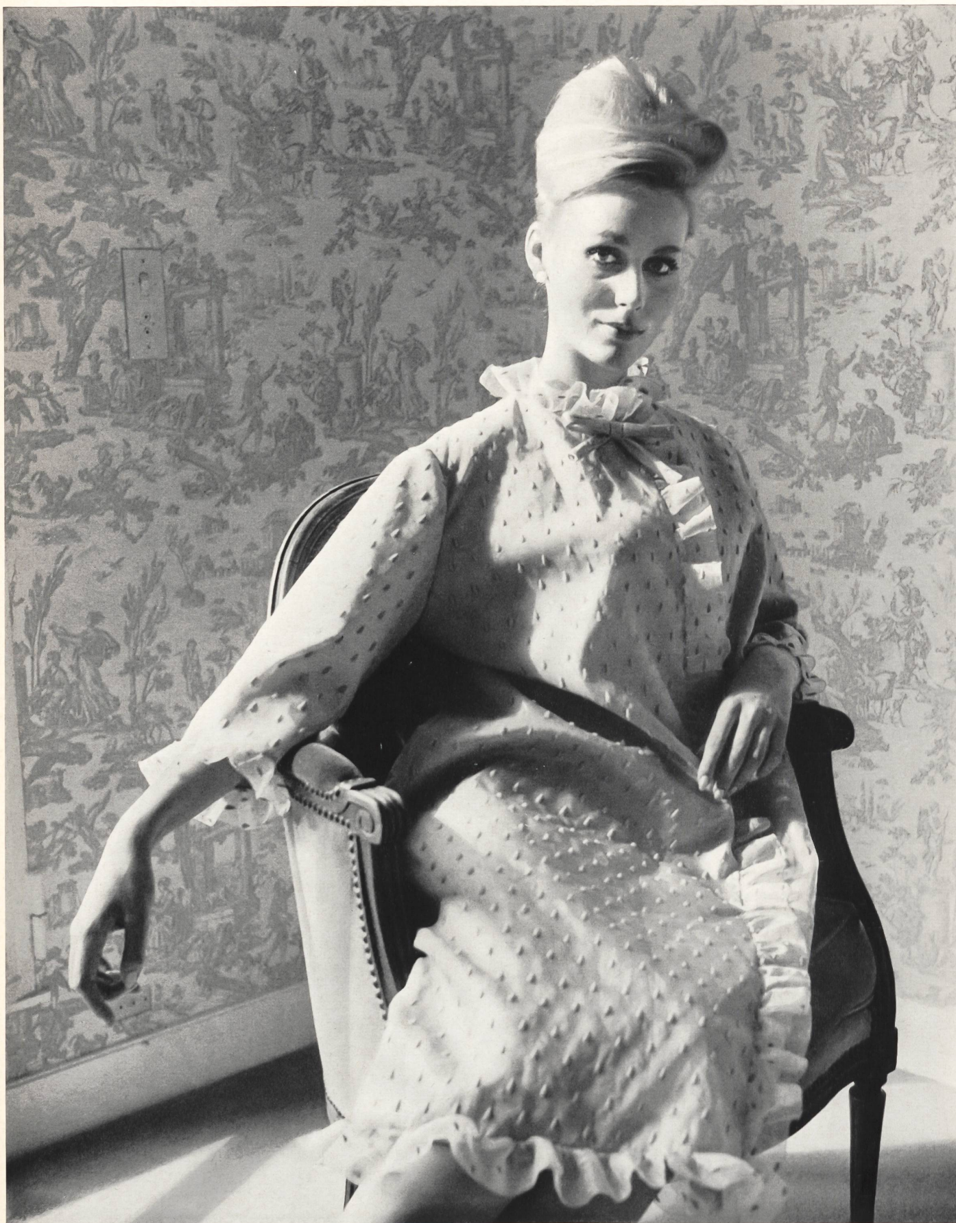
GUY LAROCHE Broderie « Nelo » sur organdi de soie « Mimosa » de J.G. Nef & Co. S. A., Herisau Grossiste à Paris: Robert Burg & Cie