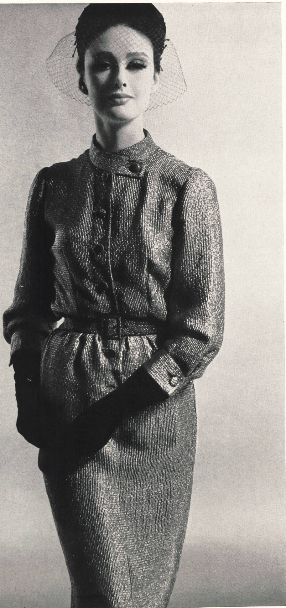
JACQUES HEIM Soie cloquée métal « Gitane » de L. Abraham & Cie, Soieries S. A., Zurich