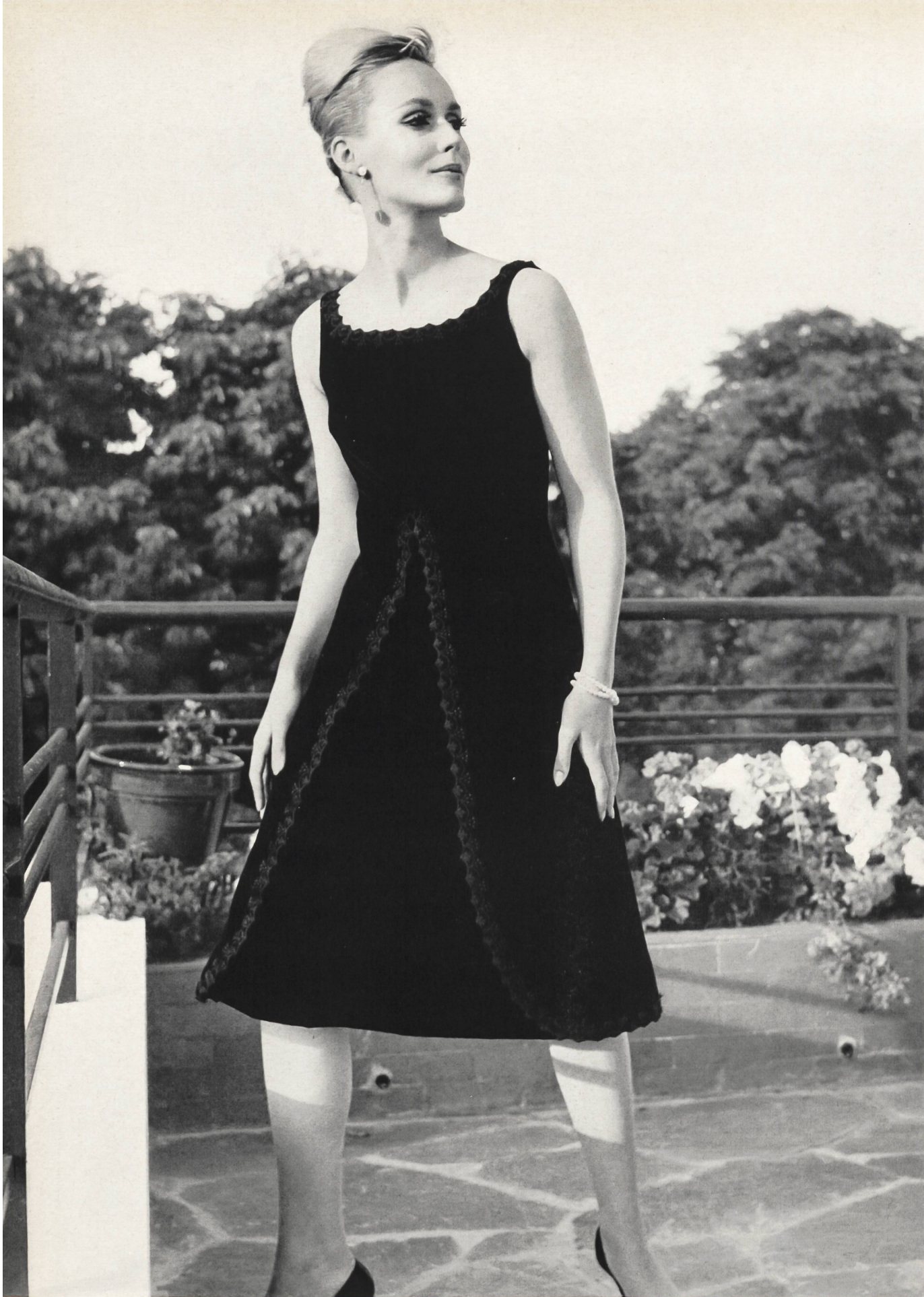
JACQUES HEIM Galon de velours et guipure de Forster Willi & Co., Saint-Gall Grossiste à Paris: Robert Burg & Cie