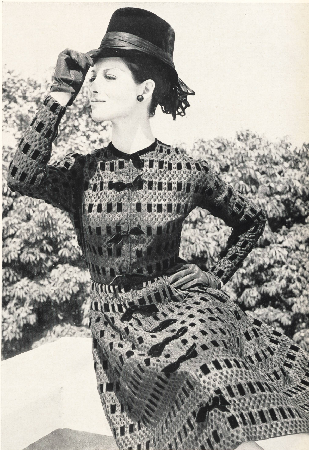
CARVEN Broderie « Nelo » sur pongé « Camilla » de J.G. Nef & Co. S.A., Herisau Grossiste à Paris: Robert Burg & Cie