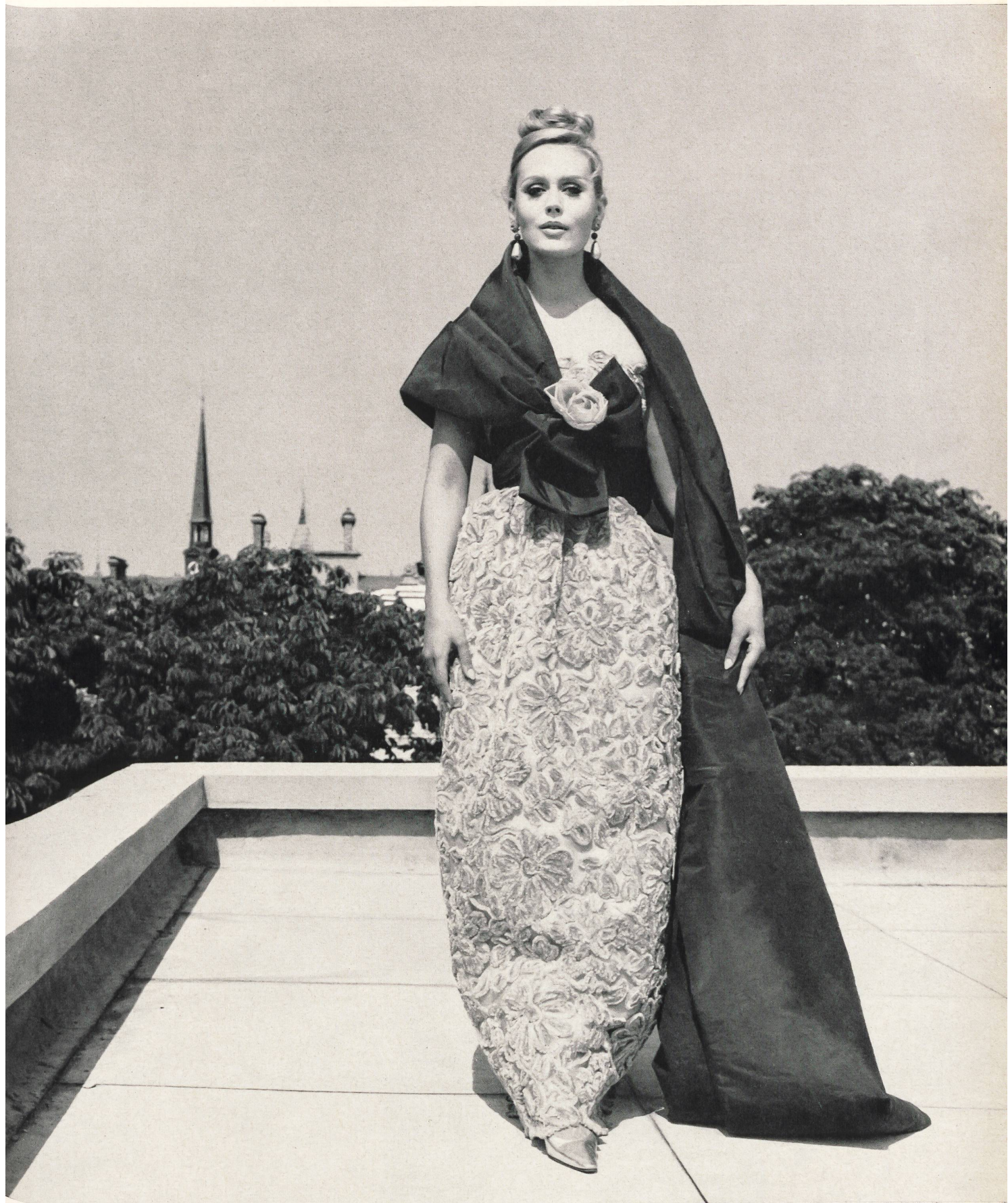
NINA RICCI Broderie de chenille sur tulle de Forster Willi & Co., Saint-Gall Grossiste à Paris: Robert Burg & Cie