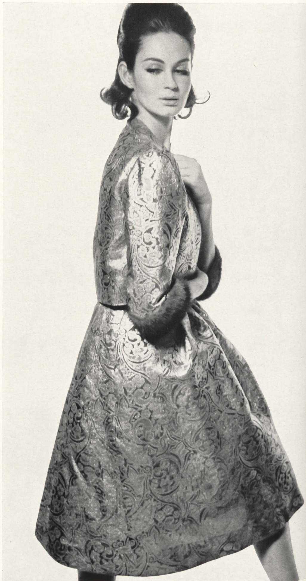
PIERRE BALMAIN Soie damassée métal « Fama » de L. Abraham & Cie, Soieries S. A., Zurich