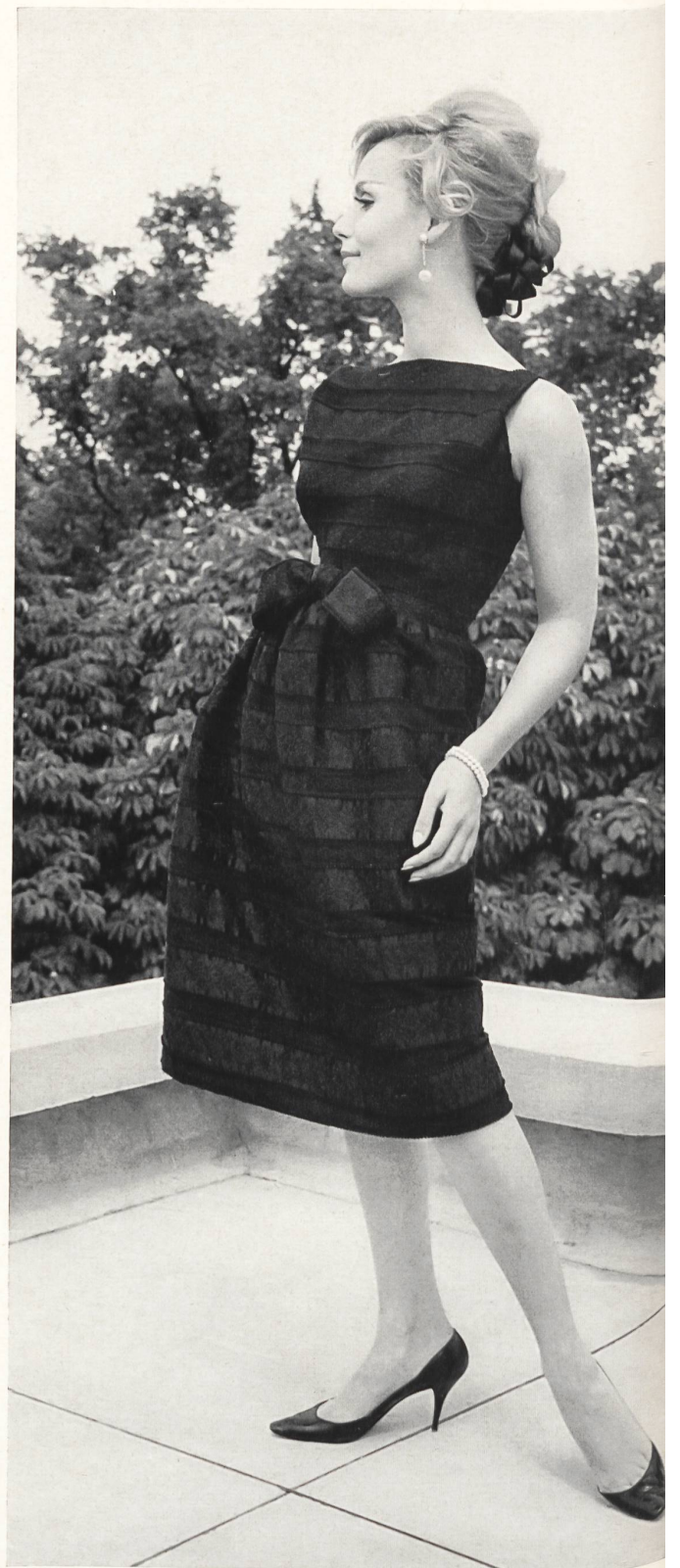
GUY LAROCHE Broderie « Nelo » sur satin de soie « Festival » de J.G. Nef & Co. S.A., Herisau Grossiste à Paris: Robert Burg & Cie