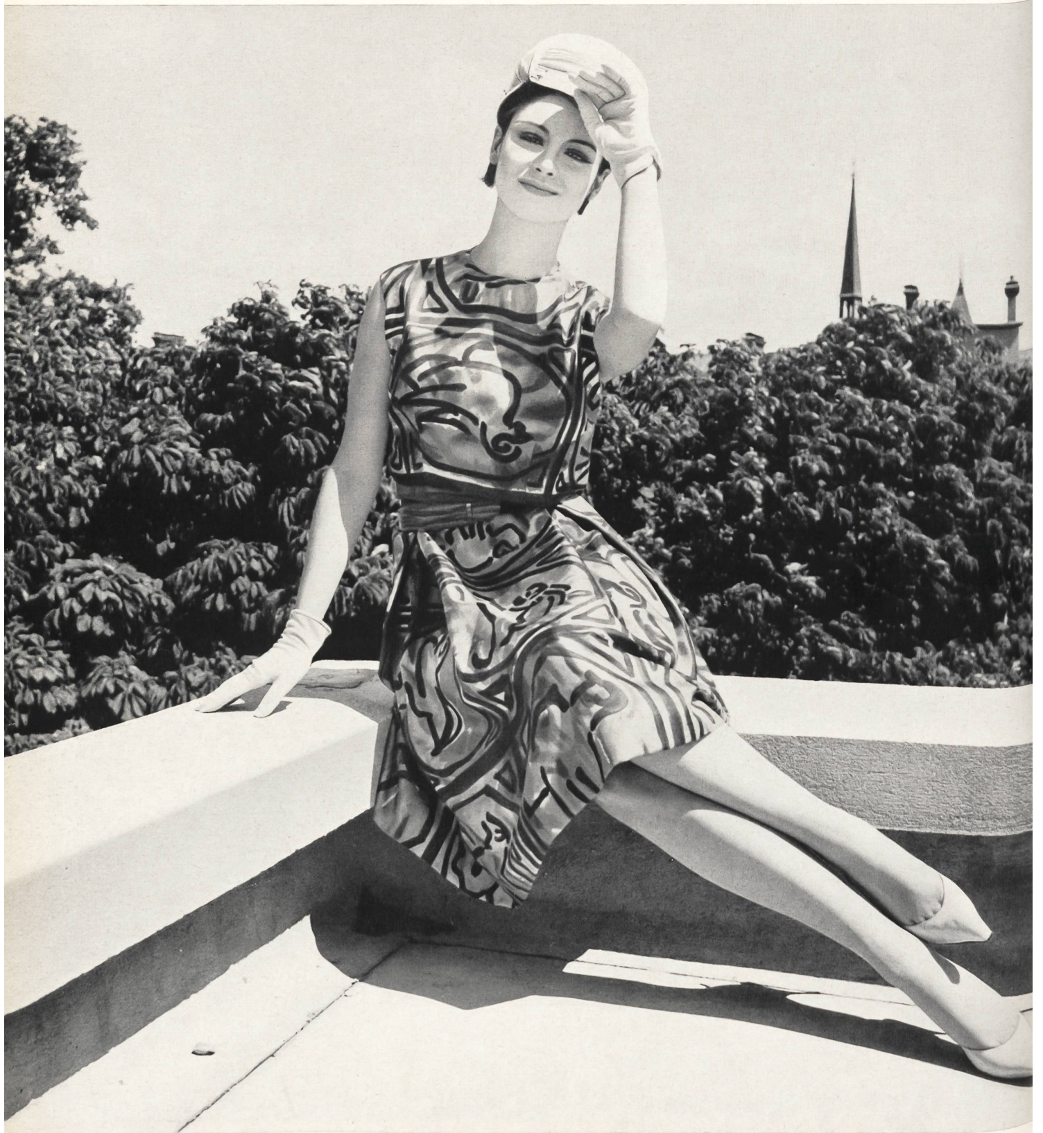
CARVEN « Malibran » imprimé des Soieries Stehli S. A., Zurich