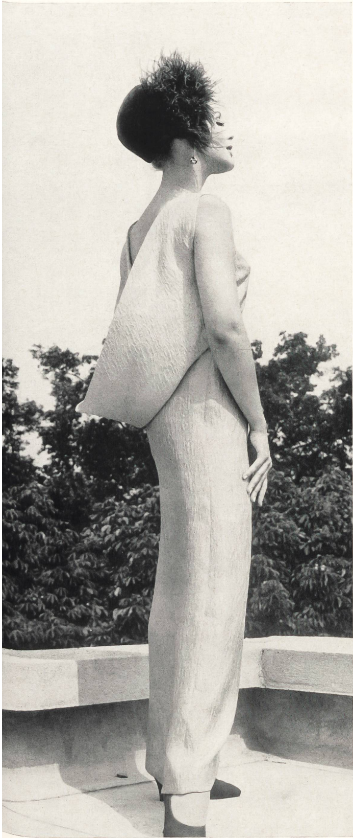
PIERRE CARDIN Façonné cloqué tout soie des Soieries Stehli S. A., Zurich