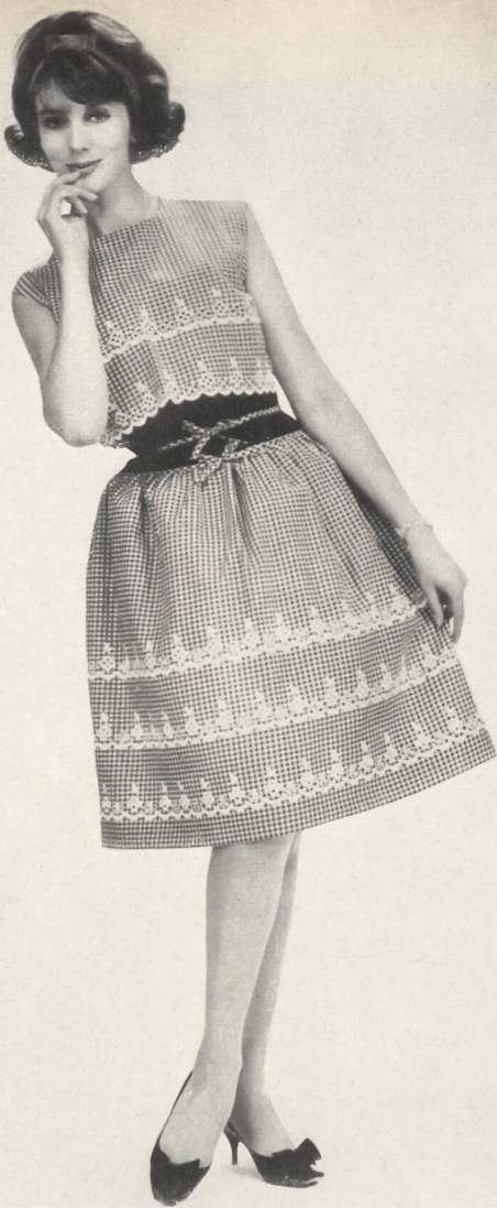
1 JACOB SCHLÄPFER & CO., SAINT-GALL Broderie sur batiste tissée en couleurs, genre Vichy. Modèle Sabrina, Nice.