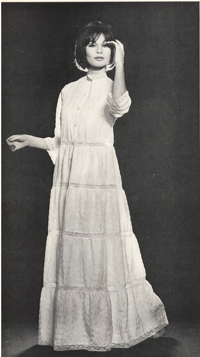
METTLER & CIE S. A., SAINT-GALL Violine gaufrée. Modèle Andréa Grenier, Paris.