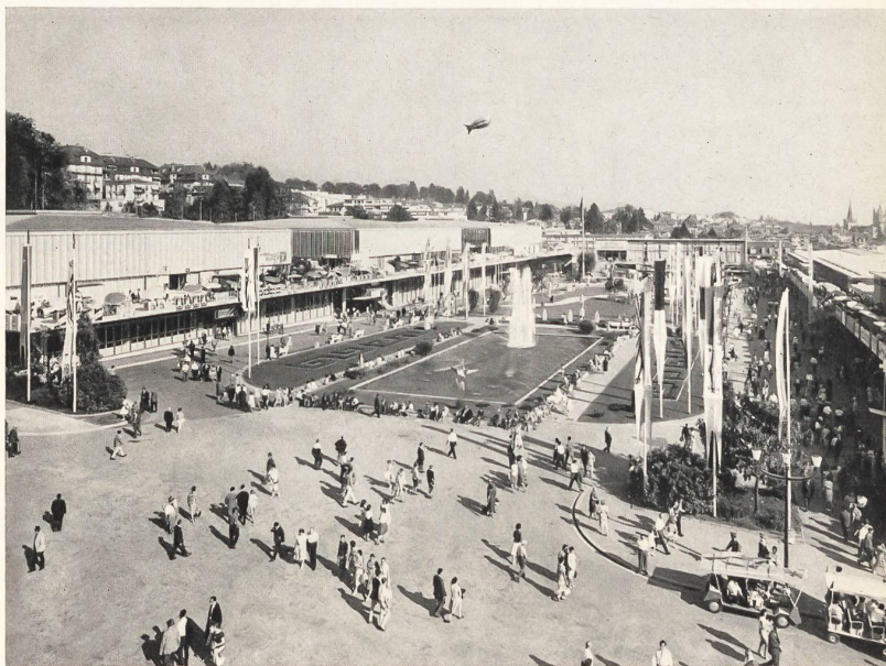
Les jardins et les halles latérales de la Foire de Lausanne, vus de la halle centrale.

Die 43. Lausanner Messe dauert dieses Jahr vom 8. bis zum 23. September. Annähernd 2400 Schweizer Aussteller werden sich beteiligen und wie alljährlich ein zusammenfassendes Bild von der mannigfaltigen nation-