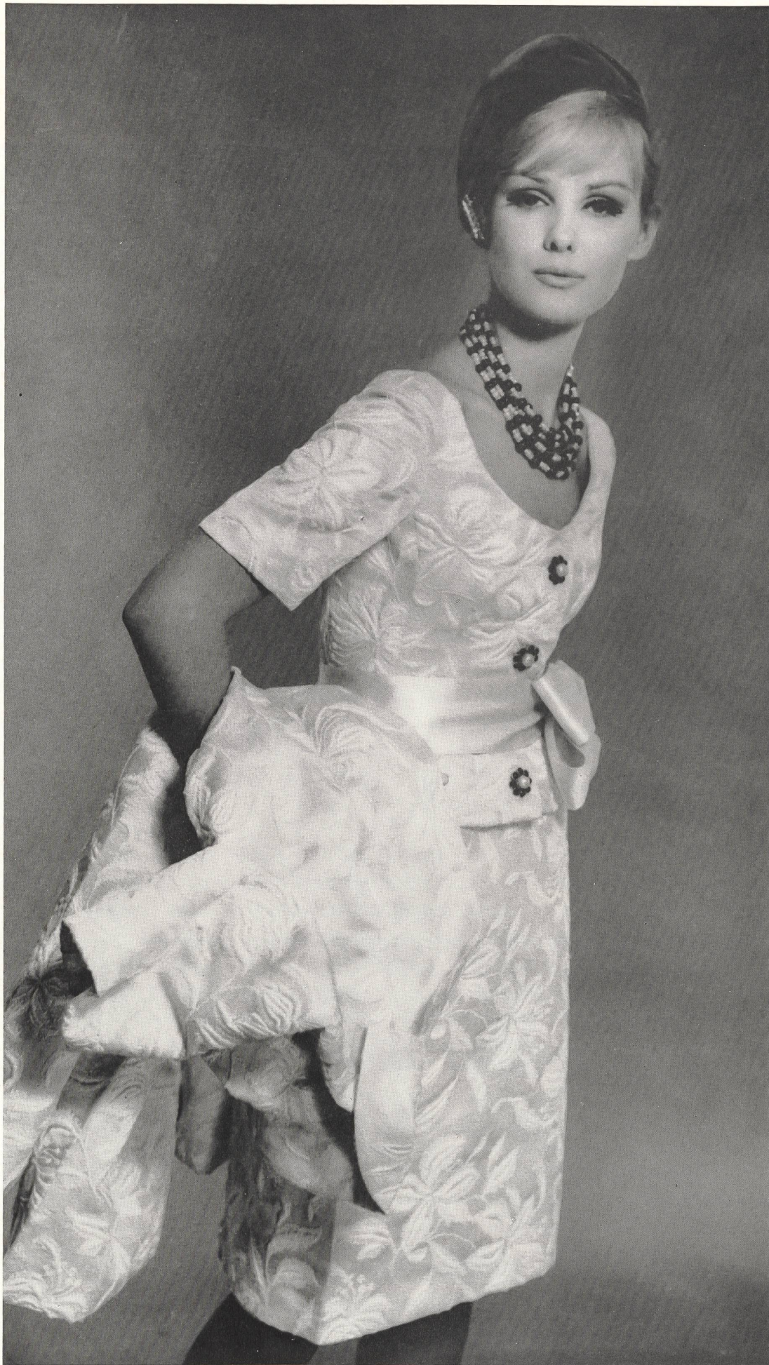
CHRISTIAN DIOR Deux-pièces et manteau en «Tundra brodé» de L. Abraham & Cie, Soieries S. A., Zurich