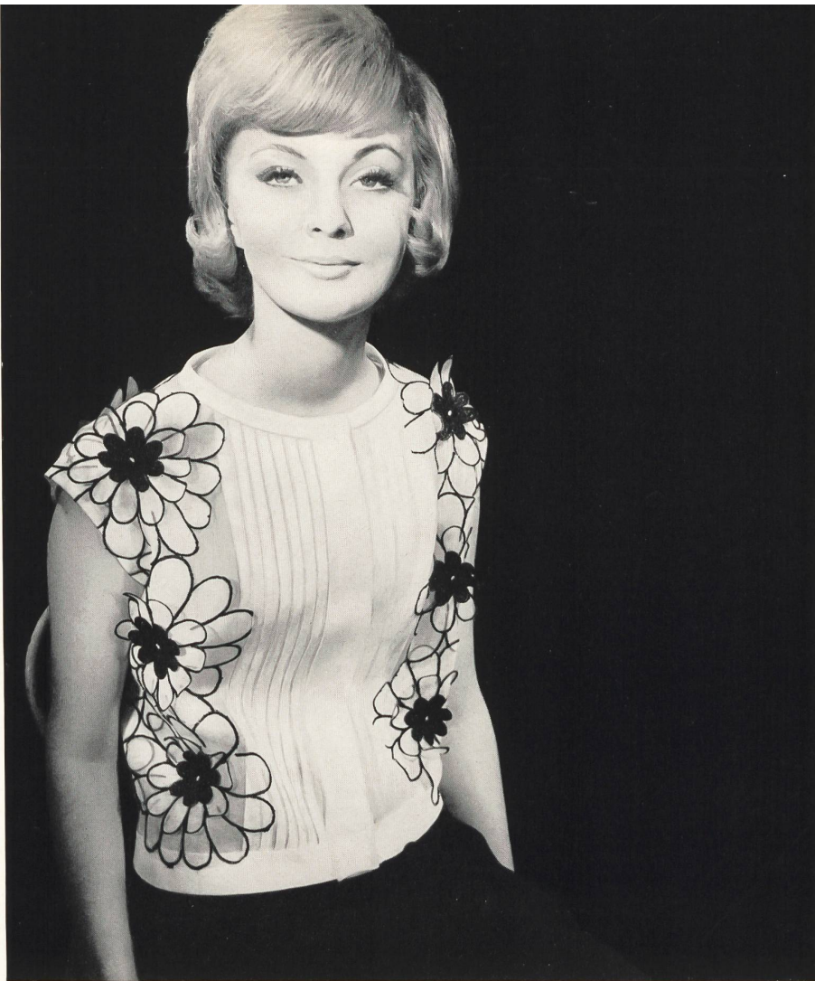
BERNARD SAGARDOY Laize d'organdi avec application de motifs découpés de Union S. A., Saint-Gall