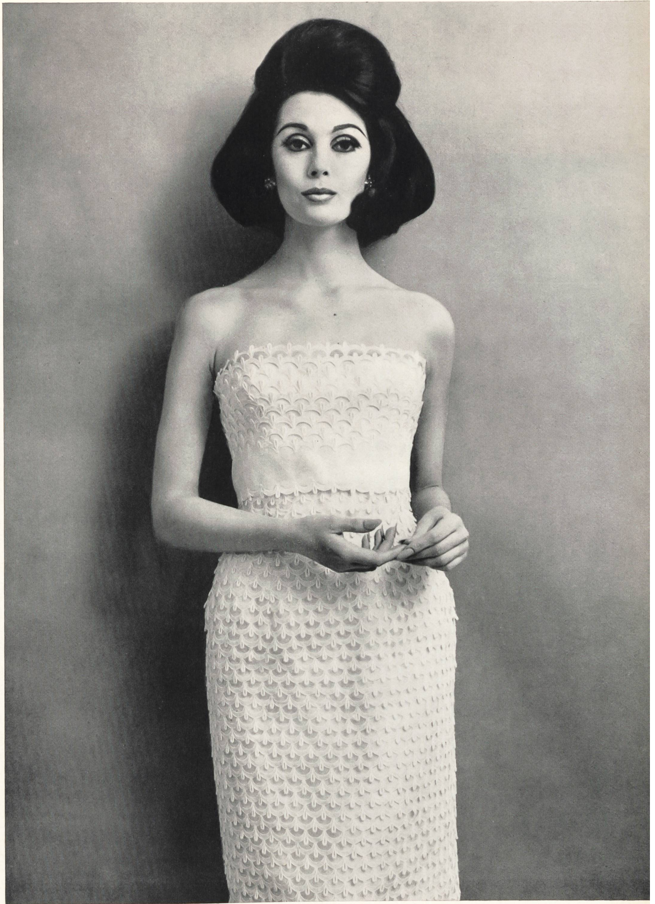
CARVEN Laize et bordure en broderie découpée sur organdi de Union S. A., Saint-Gall Grossiste à Paris: Pierre Brivet, S. à r. l.