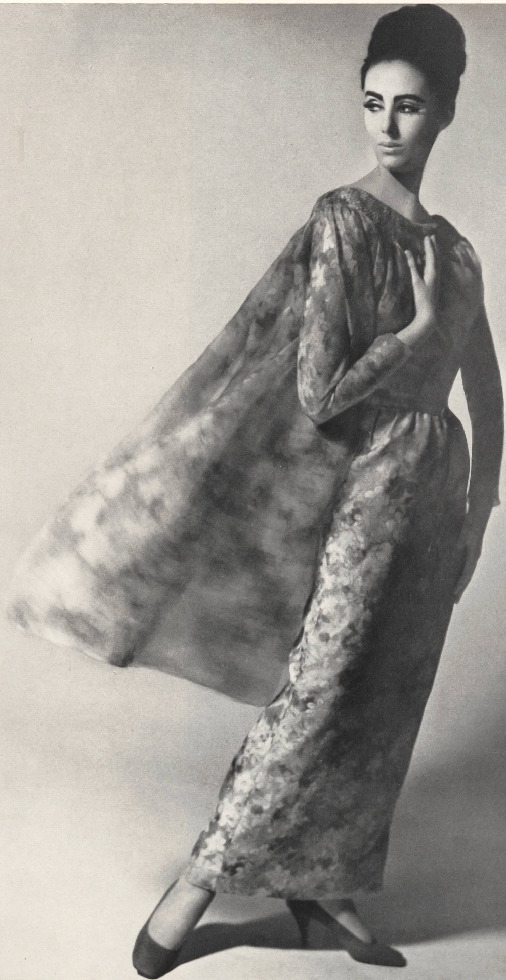
PIERRE CARDIN Robe du soir en «Mousseline Chichi» de L. Abraham & Cie, Soieries S.A., Zurich