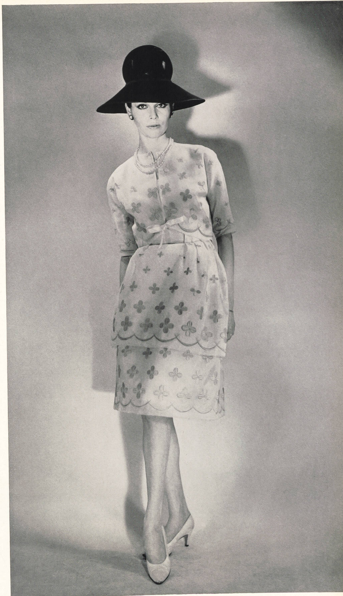
BERNARD SAGARDOY Laize d'organdi de soie brodé couleur de Union S. A., Saint-Gall