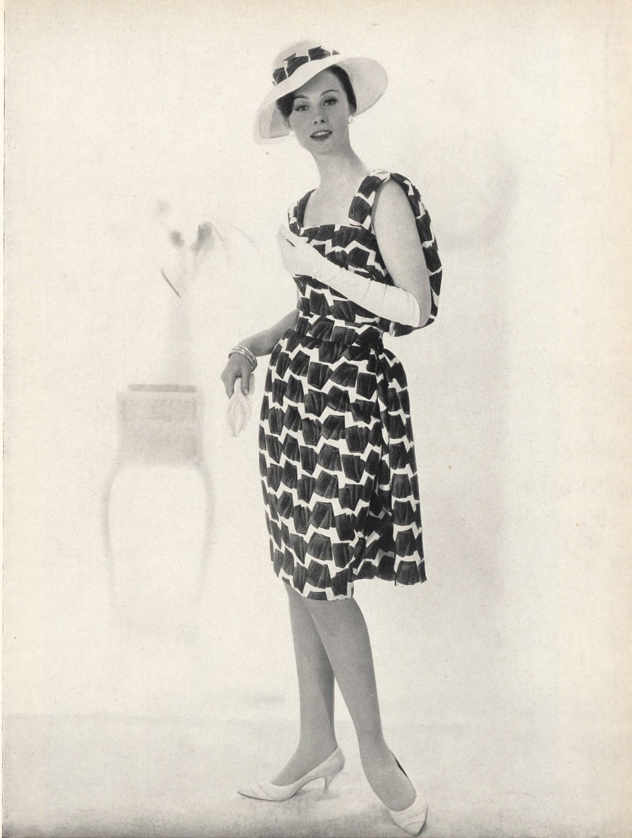
BÉGÉ S. A., TISSUS NOUVEAUTÉS, ZURICH « bégé » Coïmbra, pure soie, - pure silk - seda pura - reine Seide