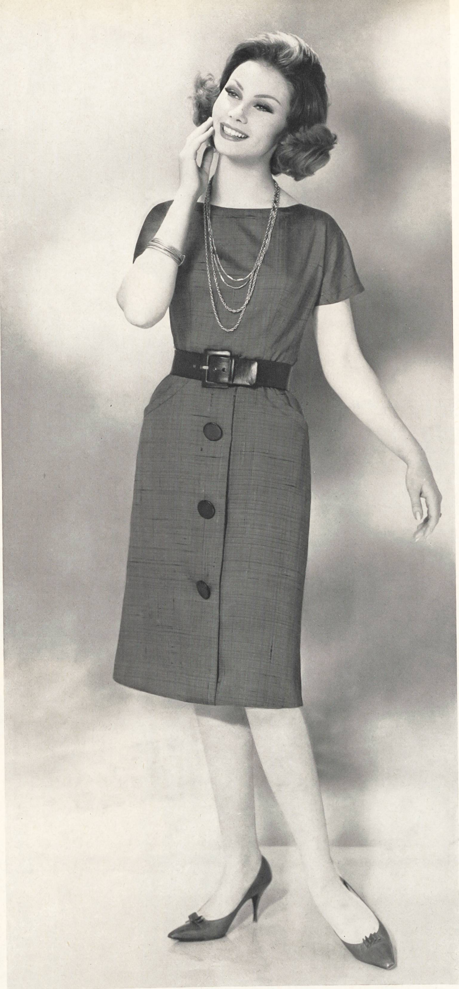
ROBT. SCHWARZENBACH & CO., THALWIL Bemberg shantung Modèle Algo S. A., Zurich