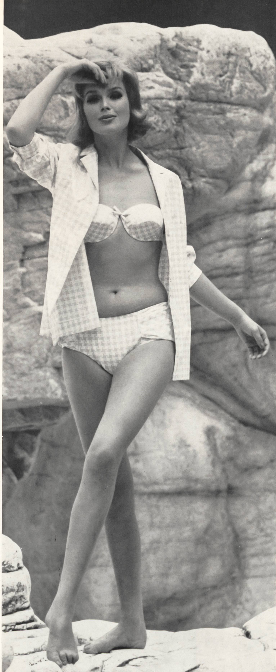
LAHCO S. A., BADEN «Hawaiï», ensemble de coton - cotton - algodón - Baumwolle