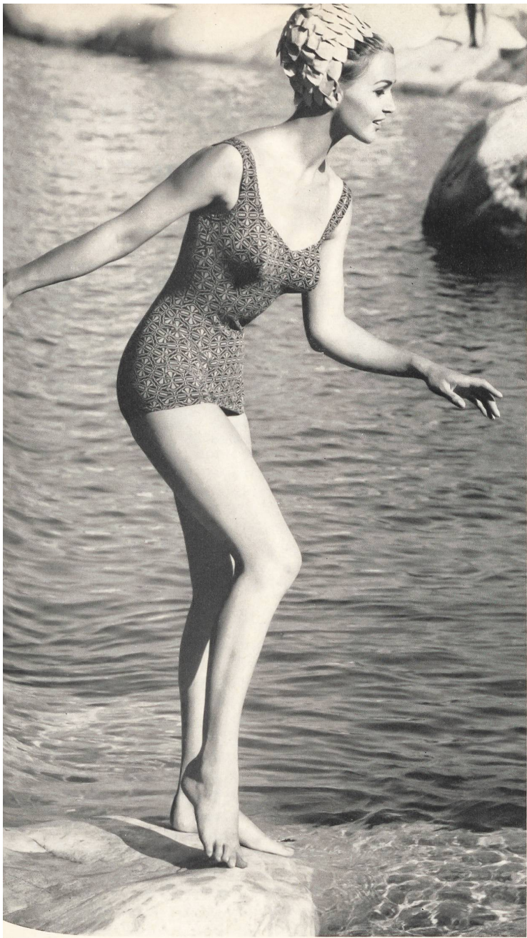
LAHCO S. A., BADEN « Florida », maillot de bain en « Hélanca » tricoté - knitted - tejido de mallas - gestrickt