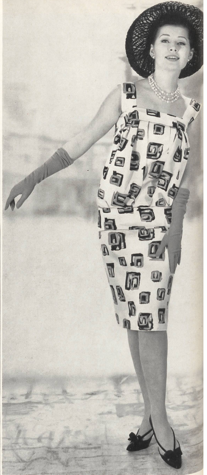
BÉGÉ S. A., TISSUS NOUVEAUTÉS, ZURICH «bégé» Coïmbra, pure soie - pure silk - seda pura - reine Seide