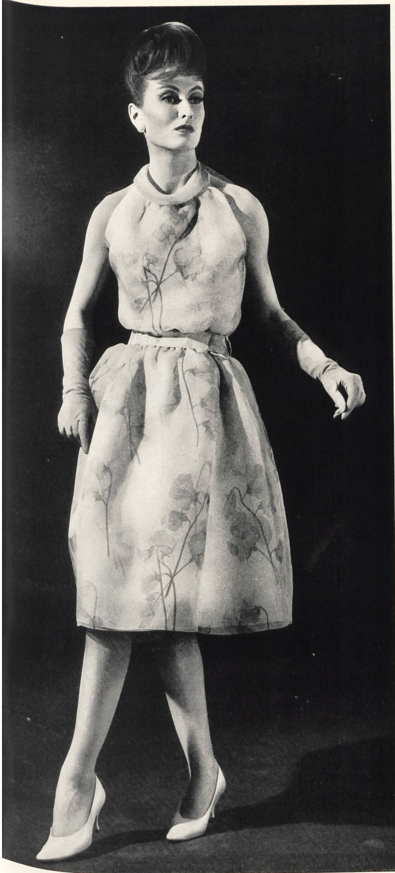
CHRISTIAN DIOR (Boutique) Organdi de soie imprimé de Rudolf Brauchbar & Cie S.A., Zurich