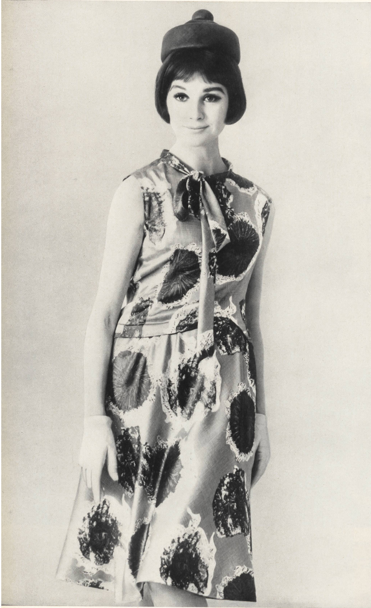
PIERRE CARDIN Satin « Mindo » imprimé, soie des Tissages de Soieries Naef Frères S.A., Zurich