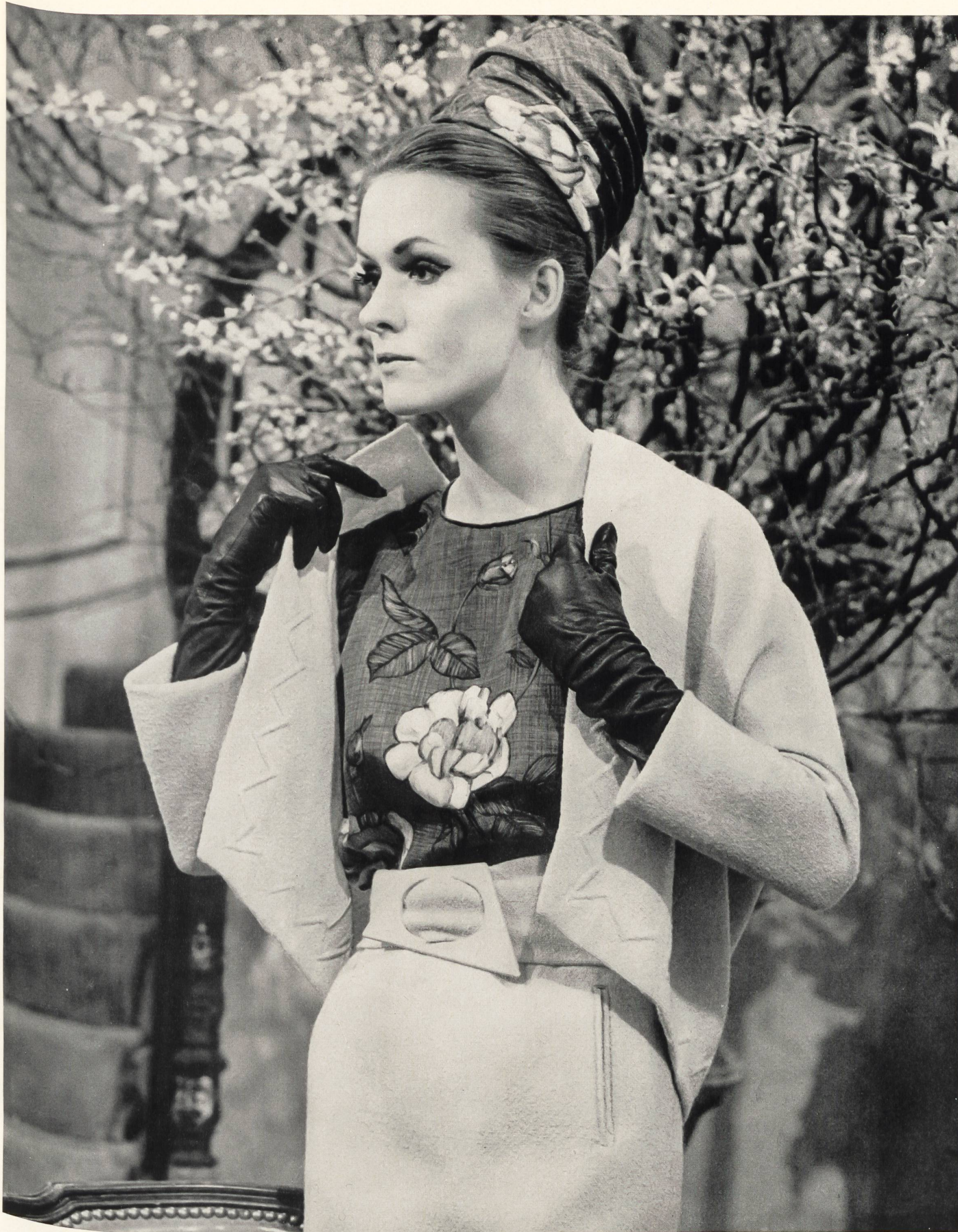
PIERRE CARDIN Soie « Hirondelle » imprimée des Tissages de Soieries Naef Frères S.A., Zurich